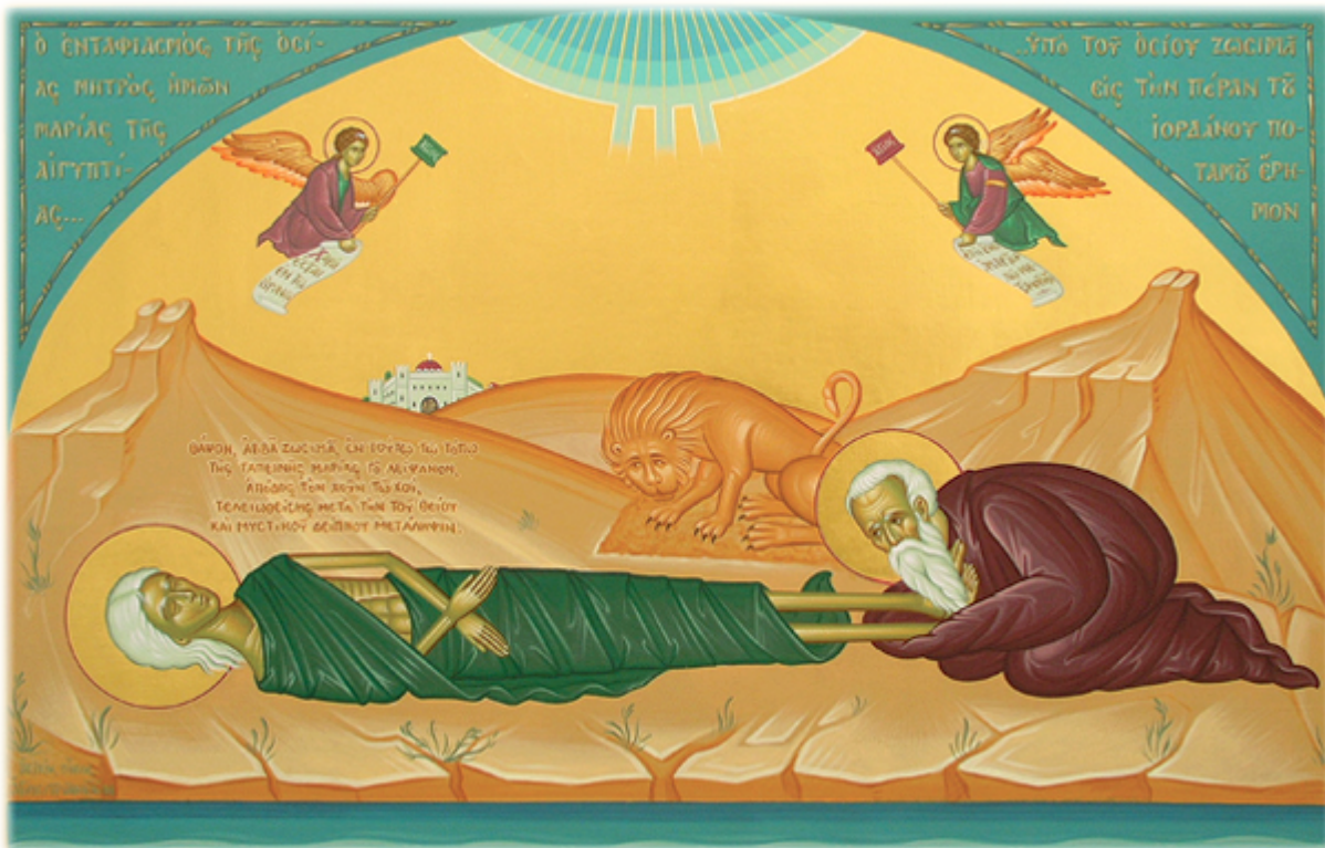
Ο ενταφιασμός της Οσίας Μητρός ημών Μαρίας της Αιγυπτίας υπό του Οσίου Ζωσιμά εις την πέραν του Ιορδάνου ποταμού ἔρημον