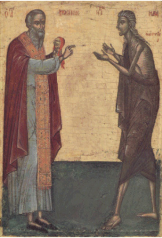
Οσία Μαρία η Αιγυπτία και Όσιος Ζωσιμάς