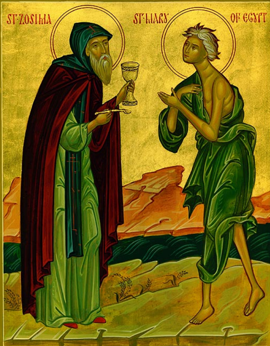
Οσία Μαρία η Αιγυπτία και Όσιος Ζωσιμάς