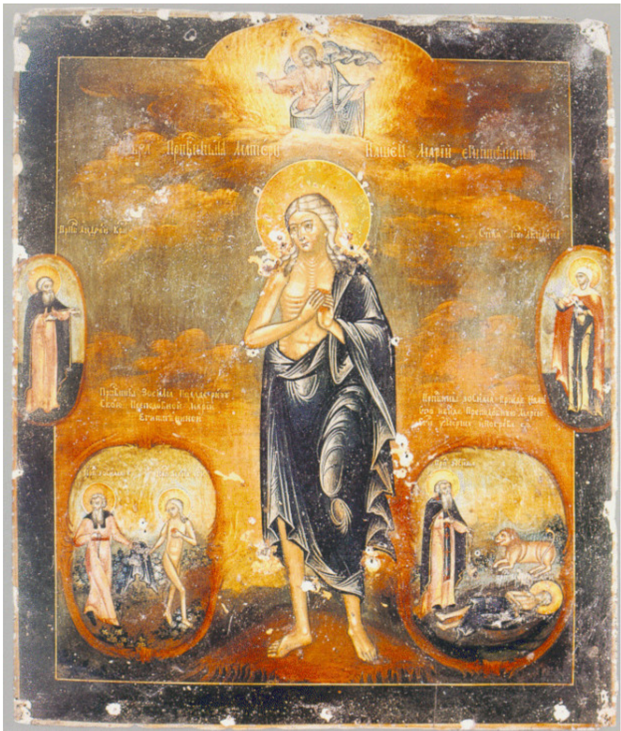
Οσία Μαρία η Αιγυπτία