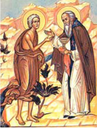
Οσία Μαρία η Αιγυπτία