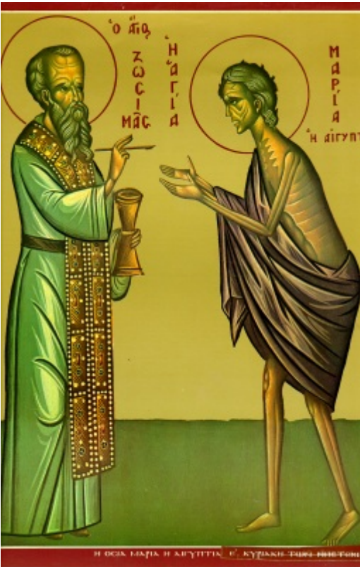
Οσία Μαρία η Αιγυπτία και Όσιος Ζωσιμάς