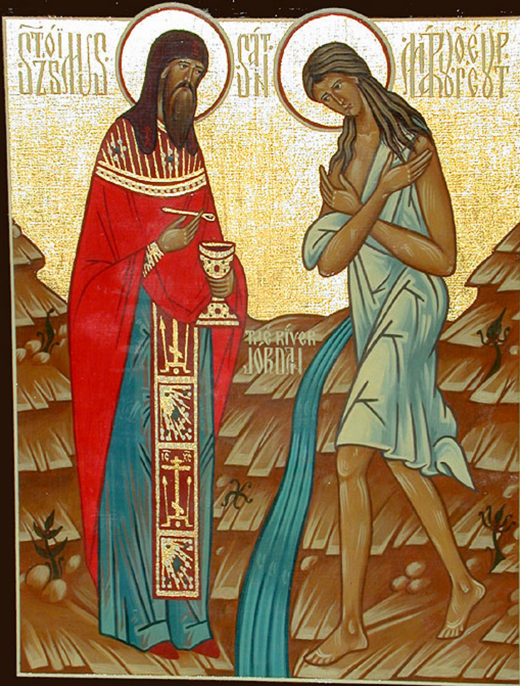
Οσία Μαρία η Αιγυπτία και Όσιος Ζωσιμάς