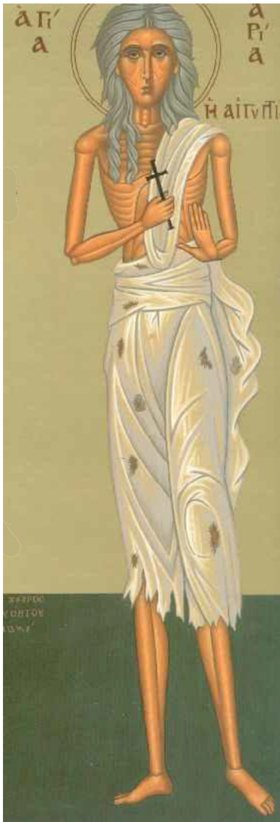
Οσία Μαρία η Αιγυπτία