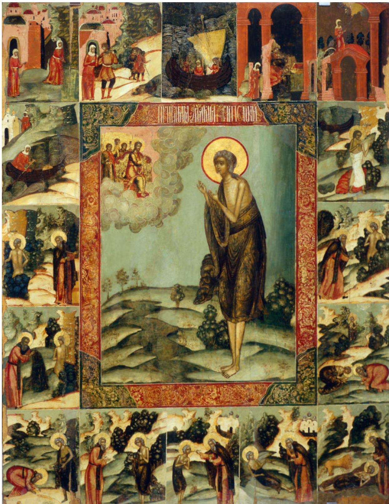
Οσία Μαρία η Αιγυπτία