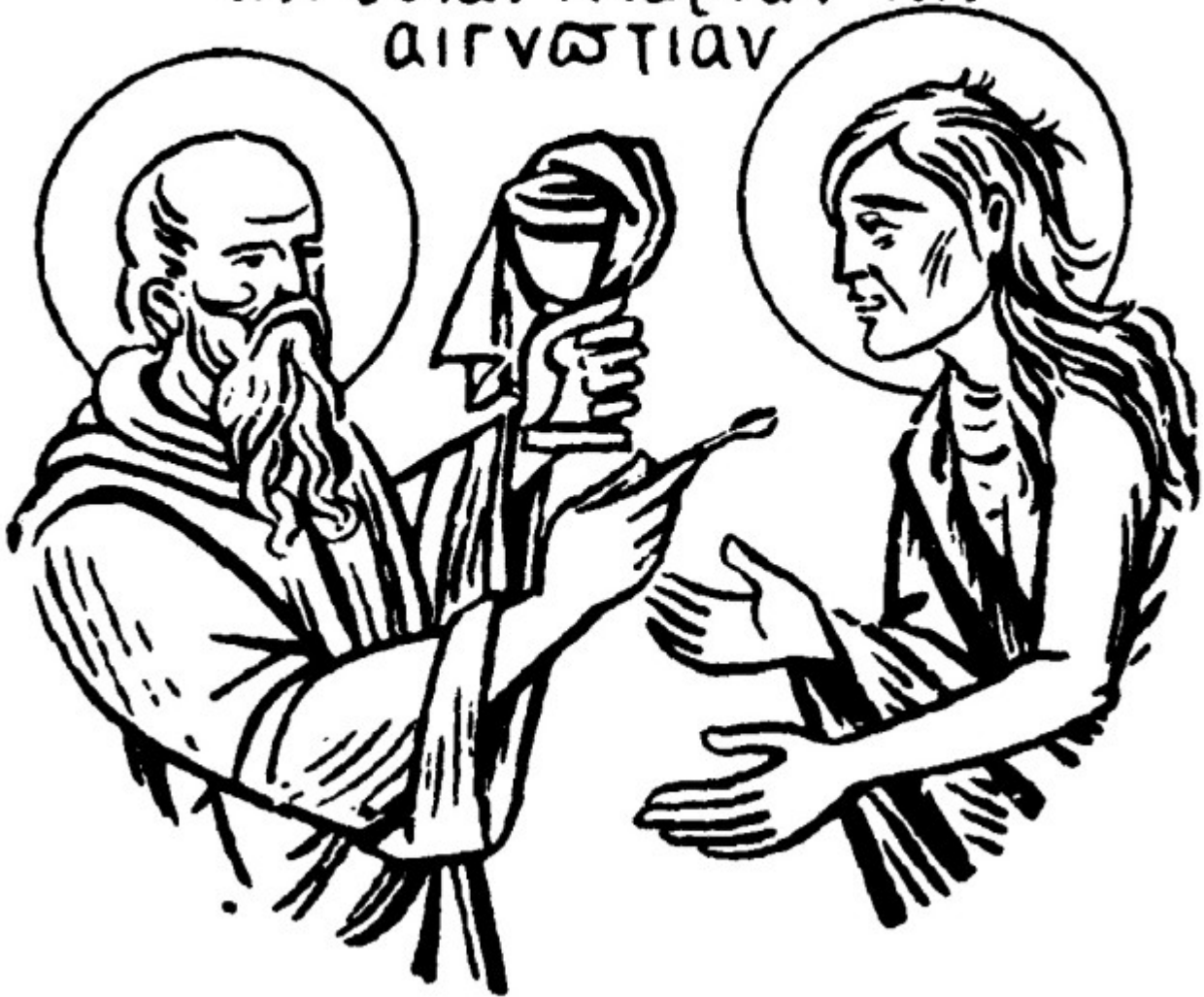
Οσία Μαρία ἡ Αἰγυπτία καὶ Ὁσιος Ζωσιμάς