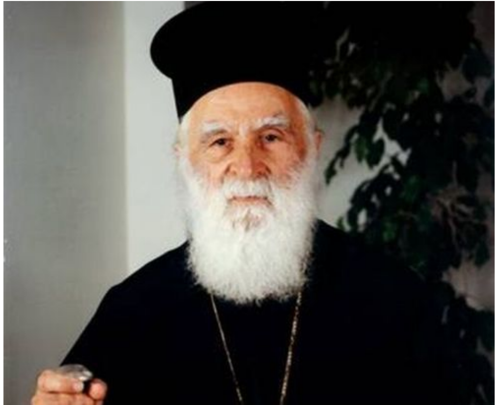
του Άγγελου Ασημινάκη, Θεολόγου

Ευλαβικό αφιέρωμα στον Μητροπολίτη πρ. Κισάμου και Σελίνου Ειρηναίο