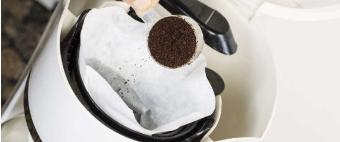
Freshly Ground Coffee

Θα έχετε παρατηρήσει ότι κάθε φορά που βάζετε το φίλτρο του καφέ στην αντίστοιχη θέση της καφετιέρας, κάτι δεν πάει καλά. Το φίλτρο δεν εφαρμόζει ποτέ τέλεια. Εάν, λοιπόν, είστε από εκείνους που αυτή η «ατέλεια» σας δίνει στα νεύρα, όπως σε εμάς, πρέπει να σας πούμε ότι υπάρχει τρόπος για να την αποφύγετε και είναι πολύ απλός.