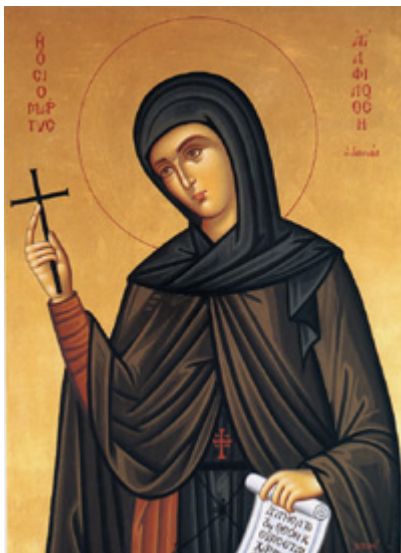
Αγία Φιλοθέη η Αθηναία