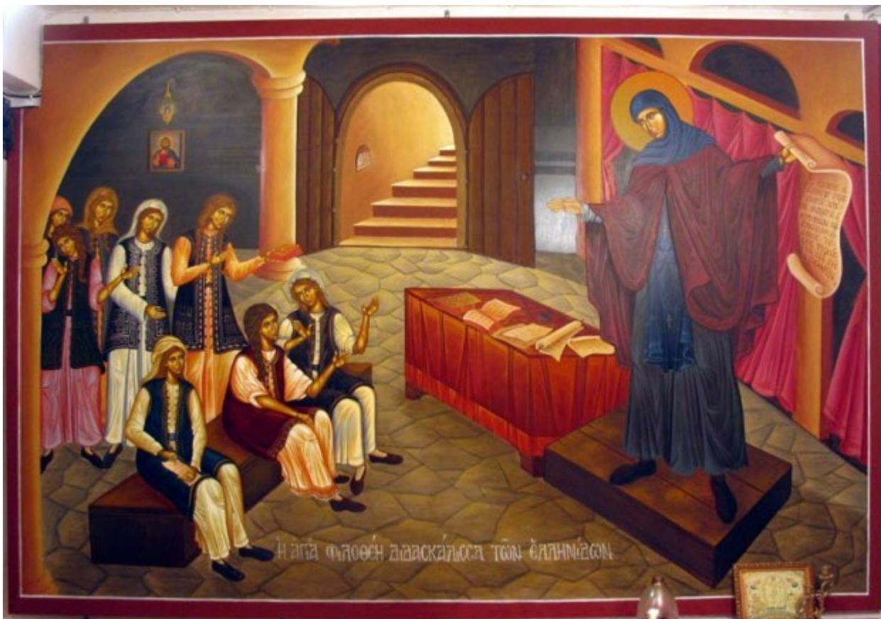
Η Αγία Φιλοθέη διδάσκει τις Ελληνίδες