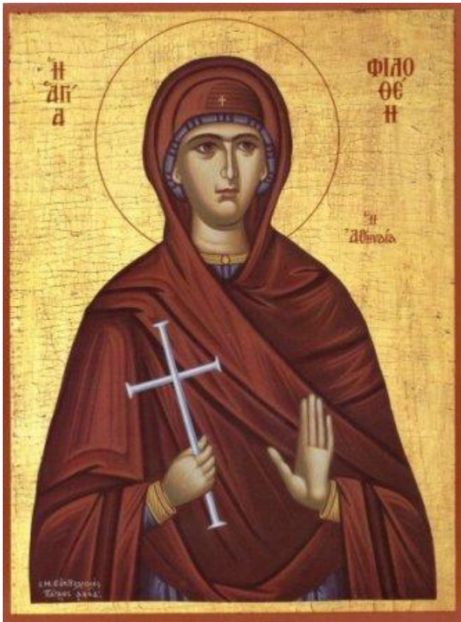
Αγία Φιλοθέη η Αθηναία