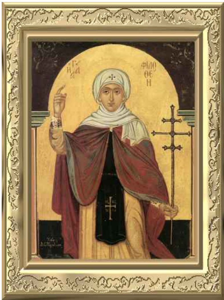
Αγία Φιλοθέη η Αθηναία