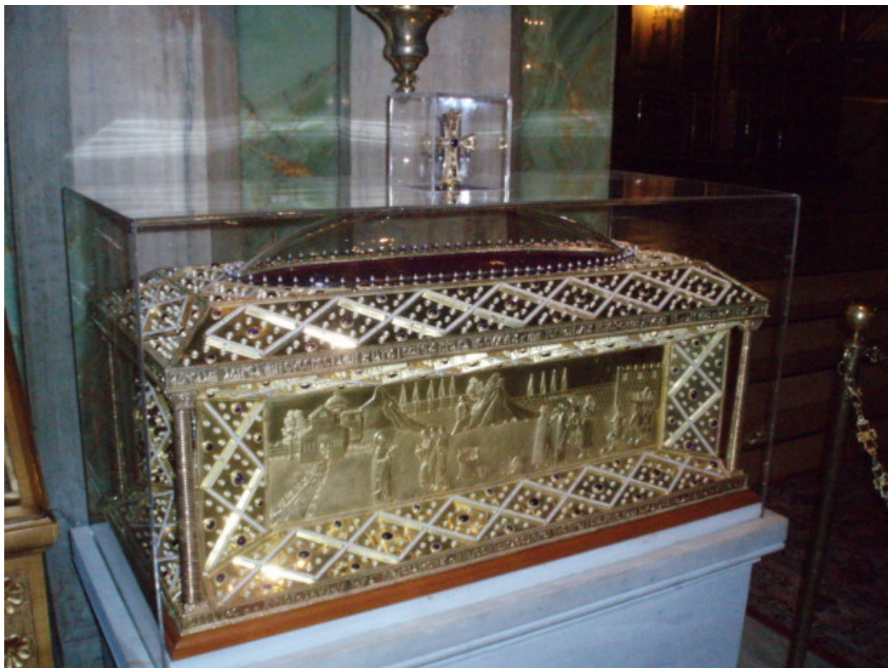
Η ασημένια λειψανοθήκη της Αγίας Φιλοθέης (Μητροπολιτικός Ναός - Αθήνα)