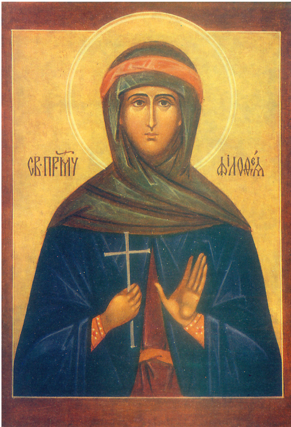
Αγία Φιλοθέη η Αθηναία