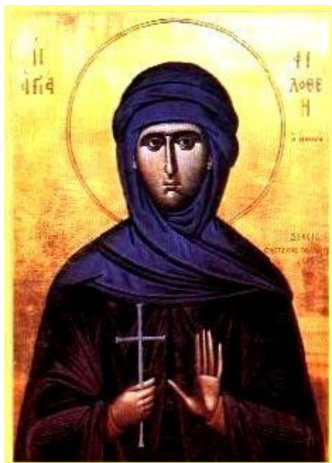
Αγία Φιλοθέη η Αθηναία