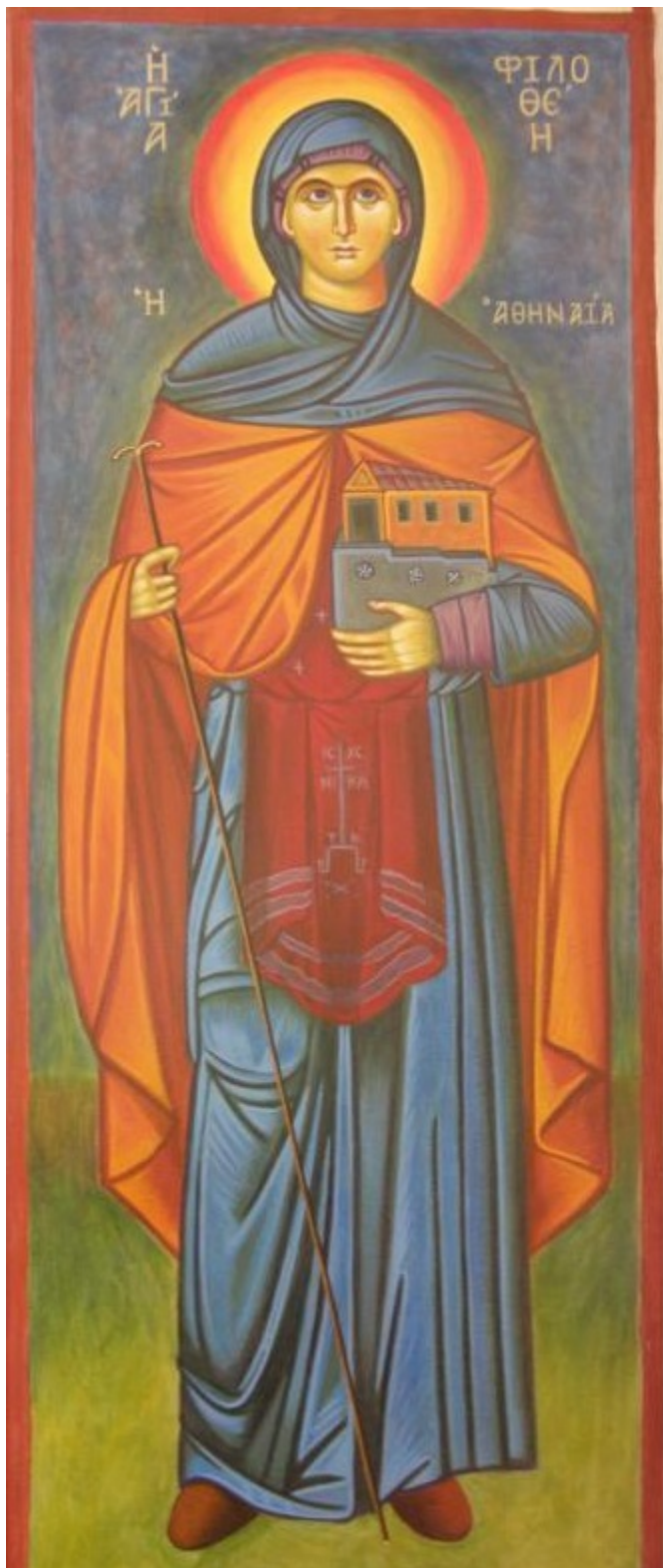
Αγία Φιλοθέη η Αθηναία - Ησυχαστήριο «Παναγία των Βρυούλων»