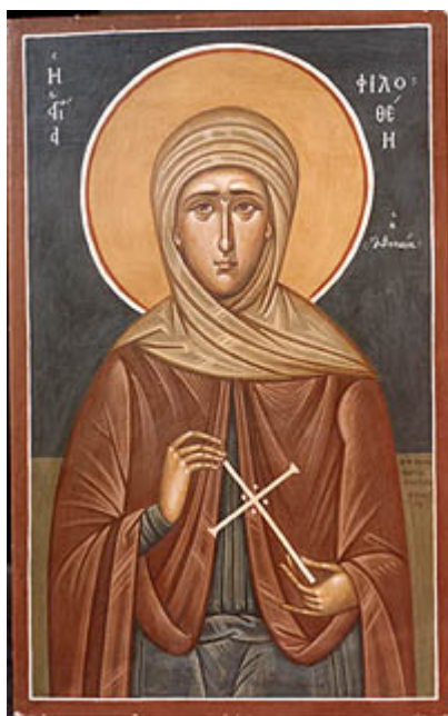
Αγία Φιλοθέη η Αθηναία