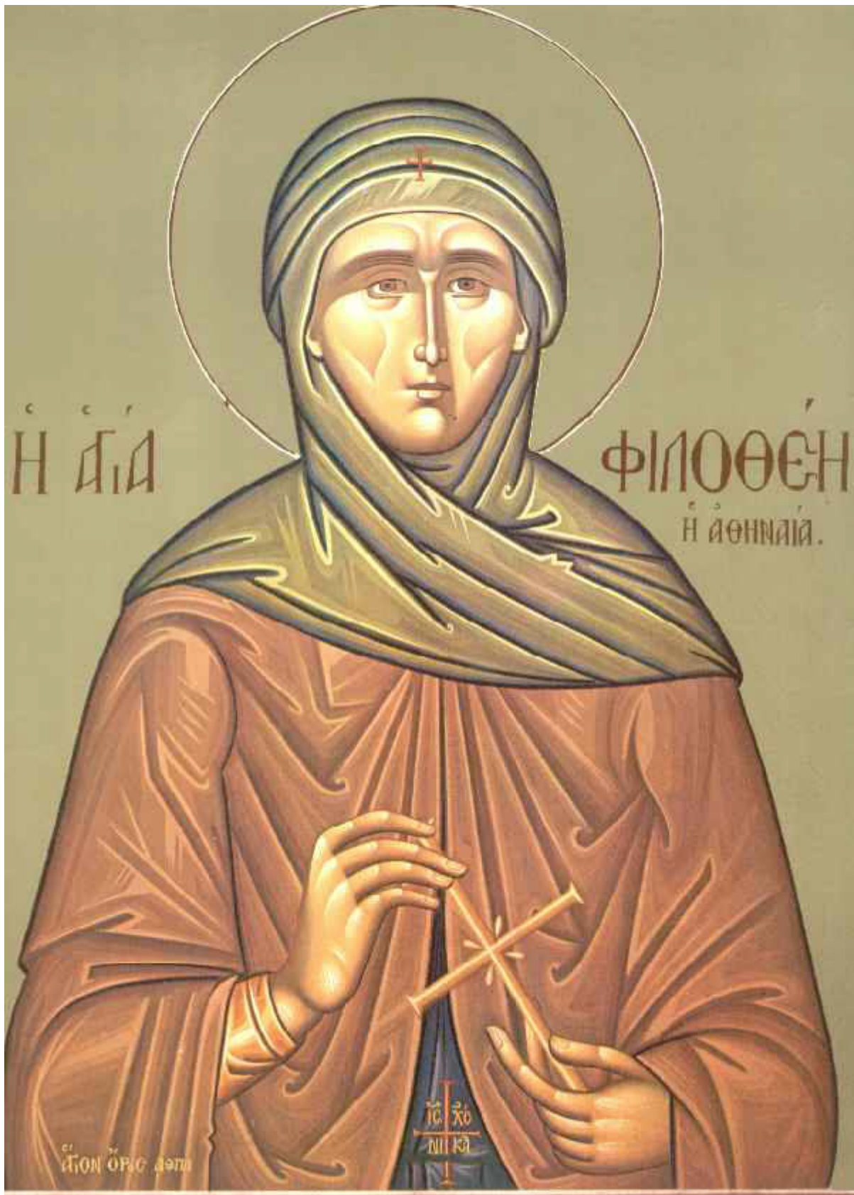
Αγία Φιλοθέη η Αθηναία