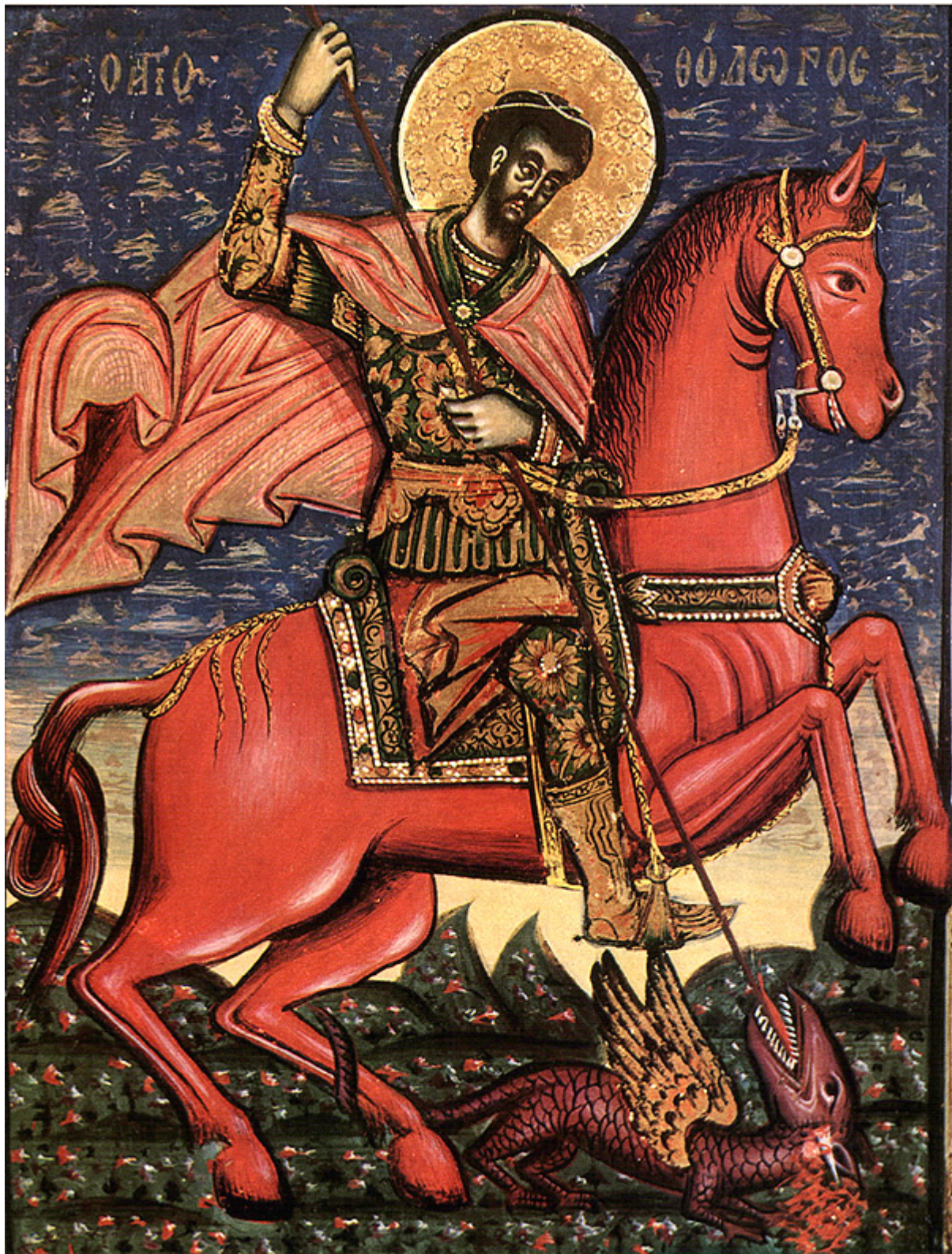
Άγιος Θεόδωρος ο Στρατηλάτης