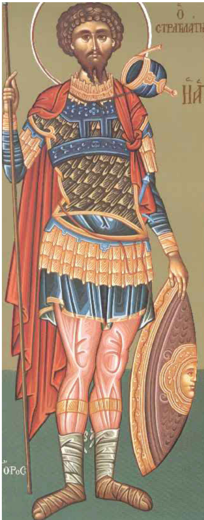
Άγιος Θεόδωρος ο Στρατηλάτης