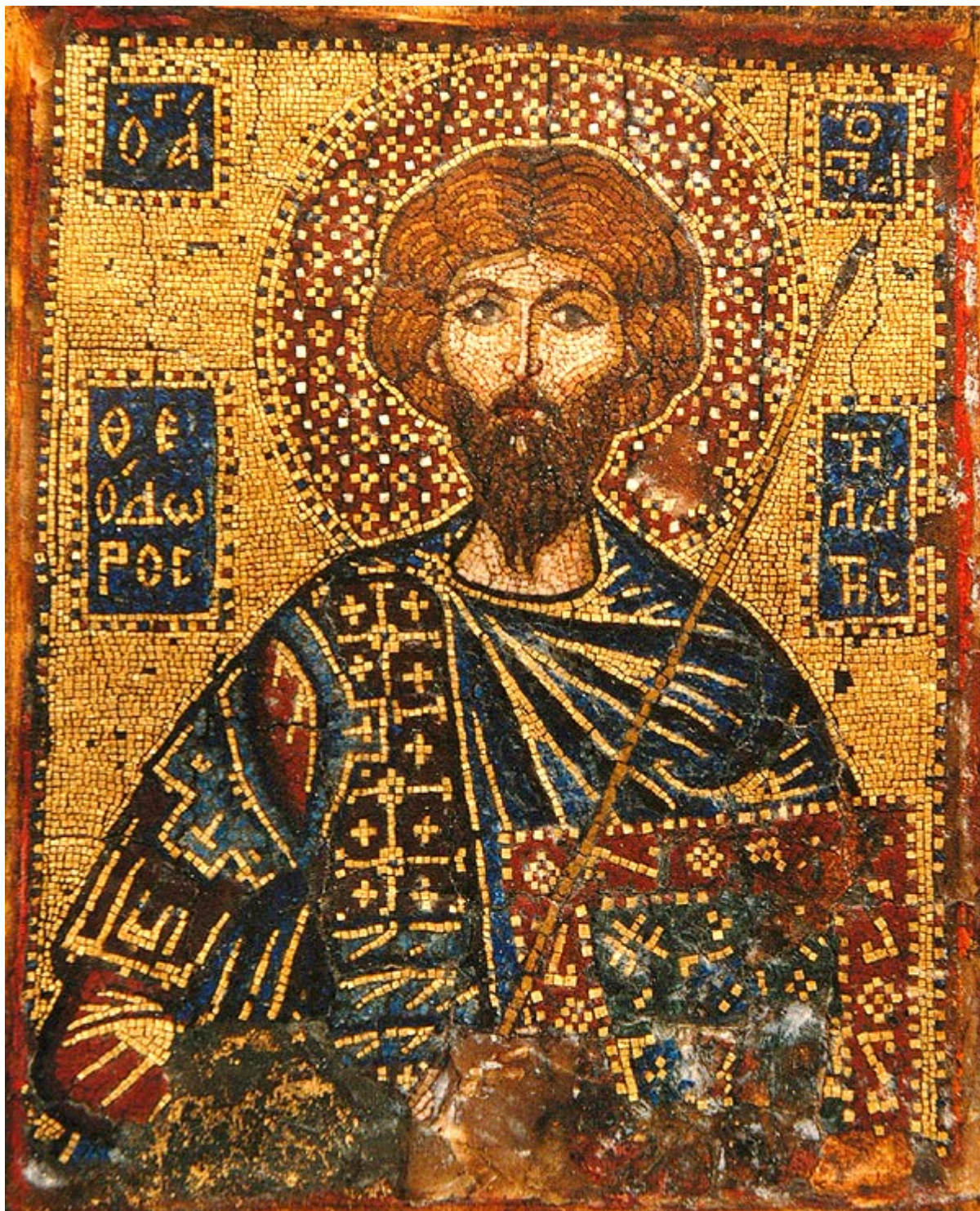
Άγιος Θεόδωρος ο Στρατηλάτης