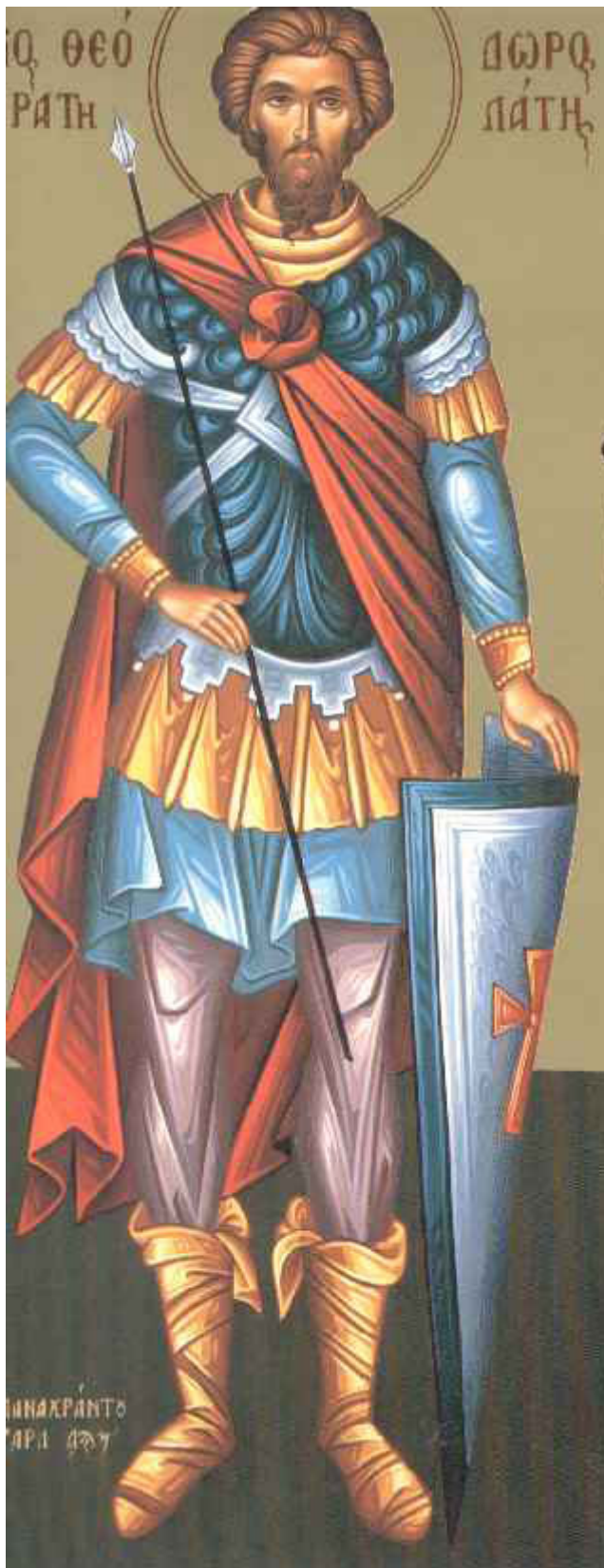
Άγιος Θεόδωρος ο Στρατηλάτης