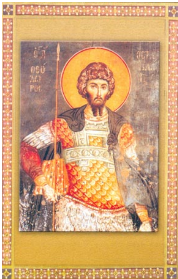
Άγιος Θεόδωρος ο Στρατηλάτης