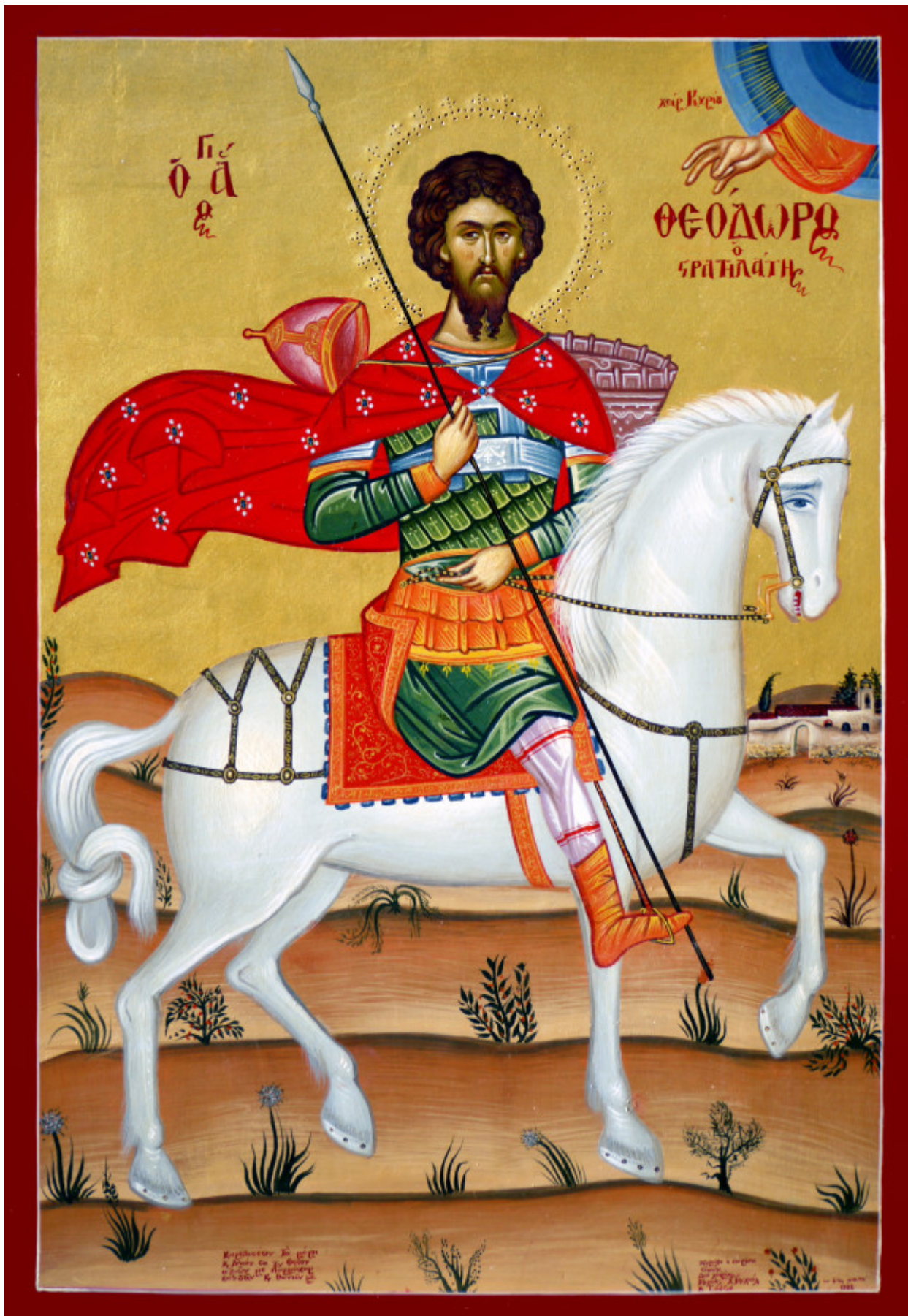
Άγιος Θεόδωρος ο Στρατηλάτης - Μιχαήλ Χατζημιχαήλ © www.michaelhadjimichael.com