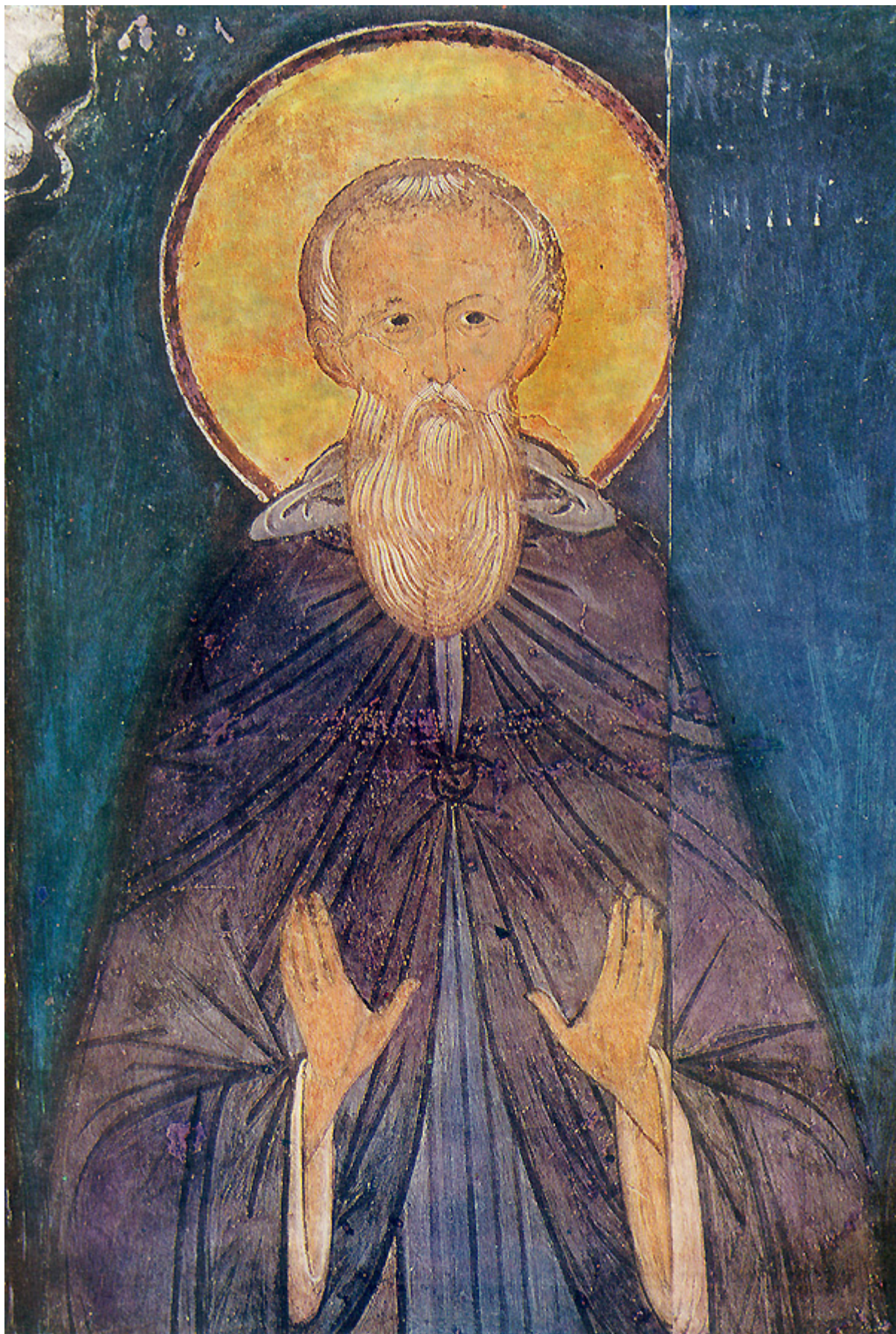
Όσιος Παρθένιος επίσκοπος Λαμψάκου