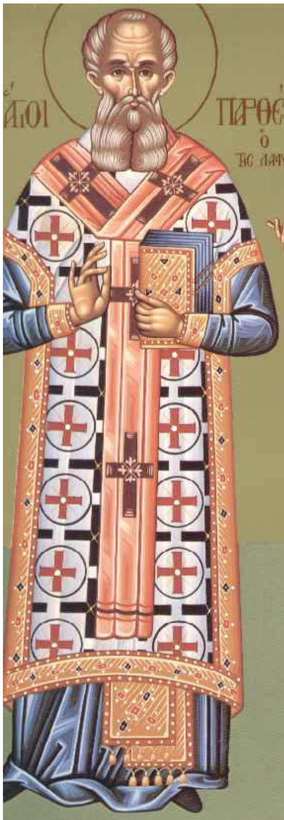
Όσιος Παρθένιος επίσκοπος Λαμψάκου