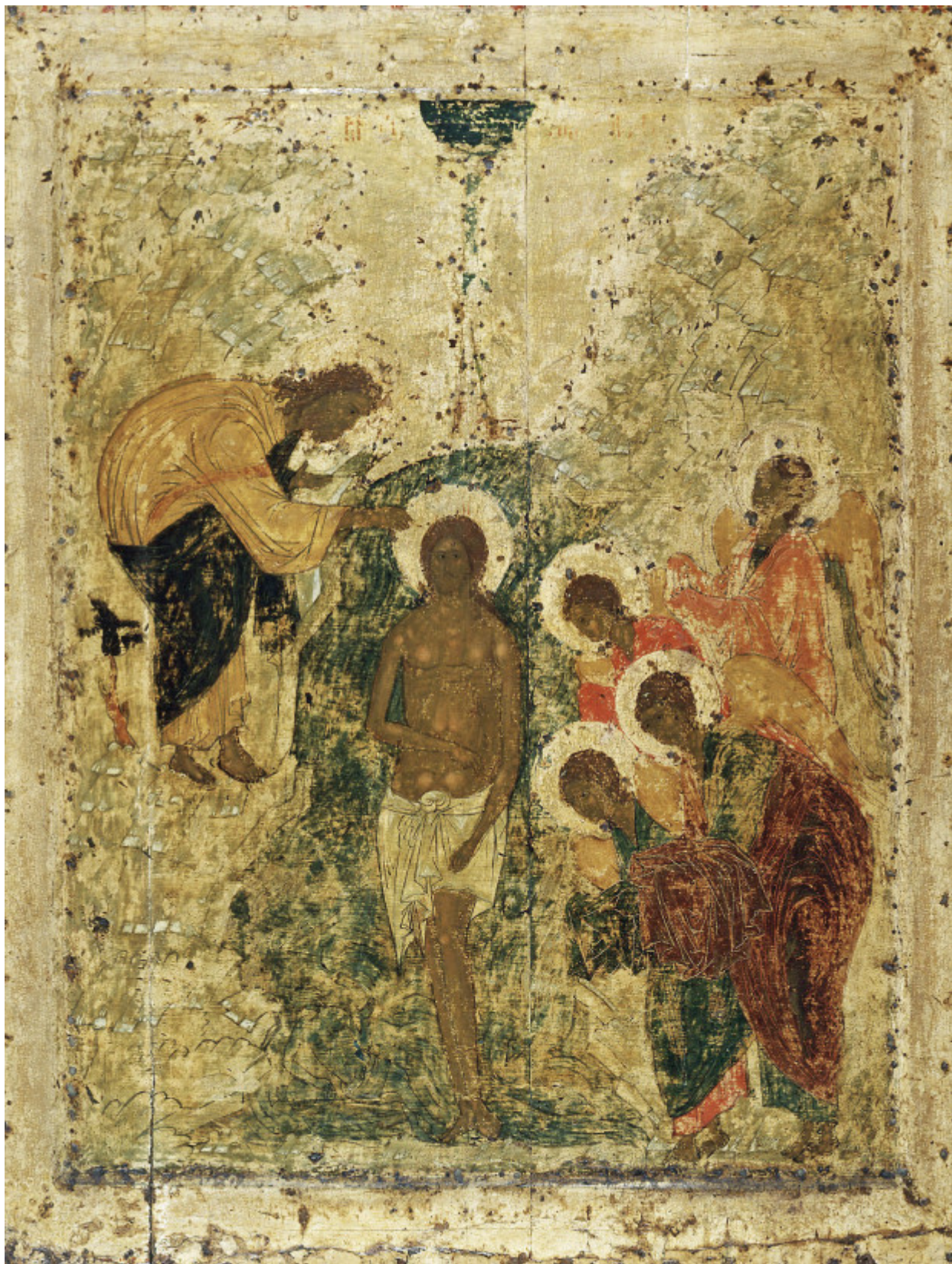
Αντρέι Ρουμπλιόβ - Η Βάπτιση, Ναός του Ευαγγελισμού, 1405