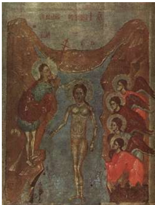
Αγία Θεοφάνεια - Ρώσικη εικόνα (Ρσκον), τέλος 13ου, αρχές 14ου αιώνα μ.Χ.