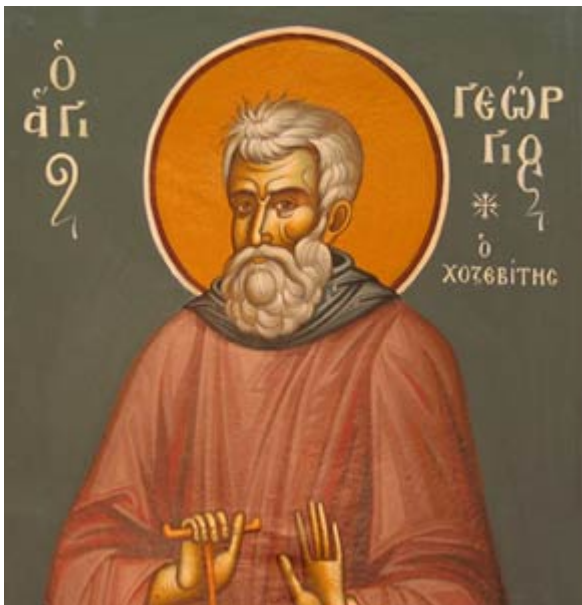
Όσιος Γεώργιος ο Χοζεβίτης

Εορτάζει στις 8 Ιανουαρίου εκάστου έτους.