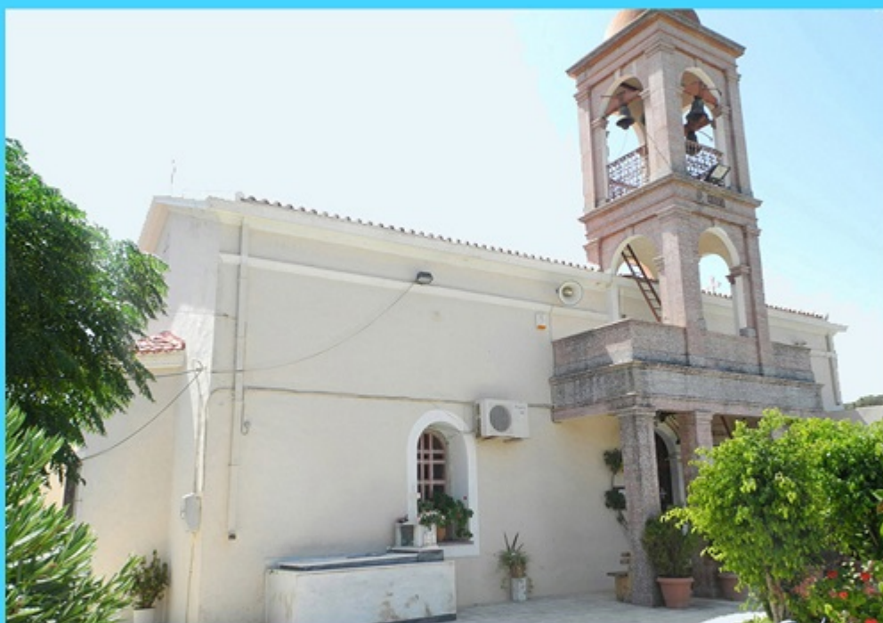
Ο Ναός του Αγίου Ελευθερίου και ο τάφος του Ιερέα Ιωάννη Ματωνάκη στο Γεράνι

Προσεύχεται εκφράζοντας την ευγνωμοσύνη του για όλα τα αγαθά και τη δύναμη που του δίνει ο Παντοδύναμος, για ν' αντεπεξέλθει στα βάσανα της καθημερινότητας και των δύσκολων συγκυριών που ζει ο λαός του.