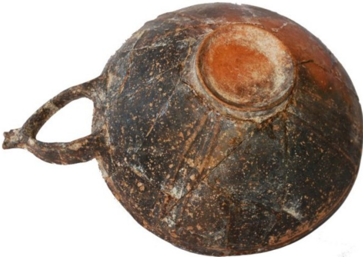
Κεραμική σε δακτυλιόσχημη βάση

Σημαντική πρόοδο σημείωσαν οι αρχαιολογικές ανασκαφές κοντά στον διεθνή αερολιμένα Λάρνακας, καθώς αποκάλυψαν ακόμη ένα τμήμα της προϊστορικής πόλης, η οποία φαίνεται να ιδρύθηκε τον 16ο αι. π.Χ. (παρόλο που, βάσει της κεραμικής, η χρονολόγηση είναι πιο πρώιμη). Τον 12ο αι. π.Χ. η πόλη καταστράφηκε και εγκαταλείφθηκε.