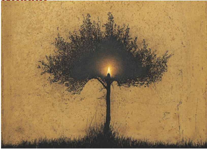
Δημιουργοί έν πλῶ