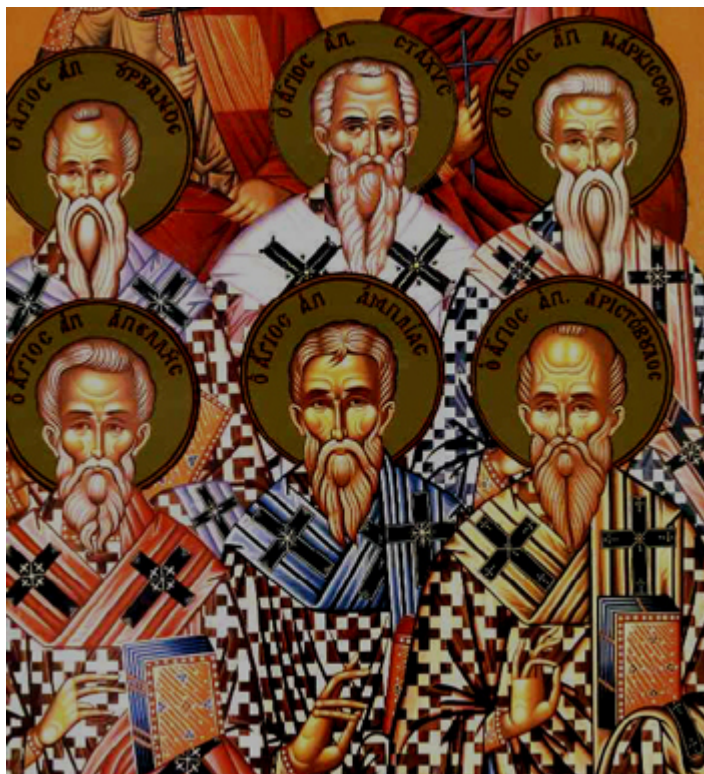
Άγιοι Στάχυς, Απελλής, Αμπλίας, Ουρβανός, Νάρκισσος και Αριστόβουλος οι Απόστολοι από τους Εβδομήκοντα

Εορτάζει στις 31 Οκτωβρίου εκάστου έτους.