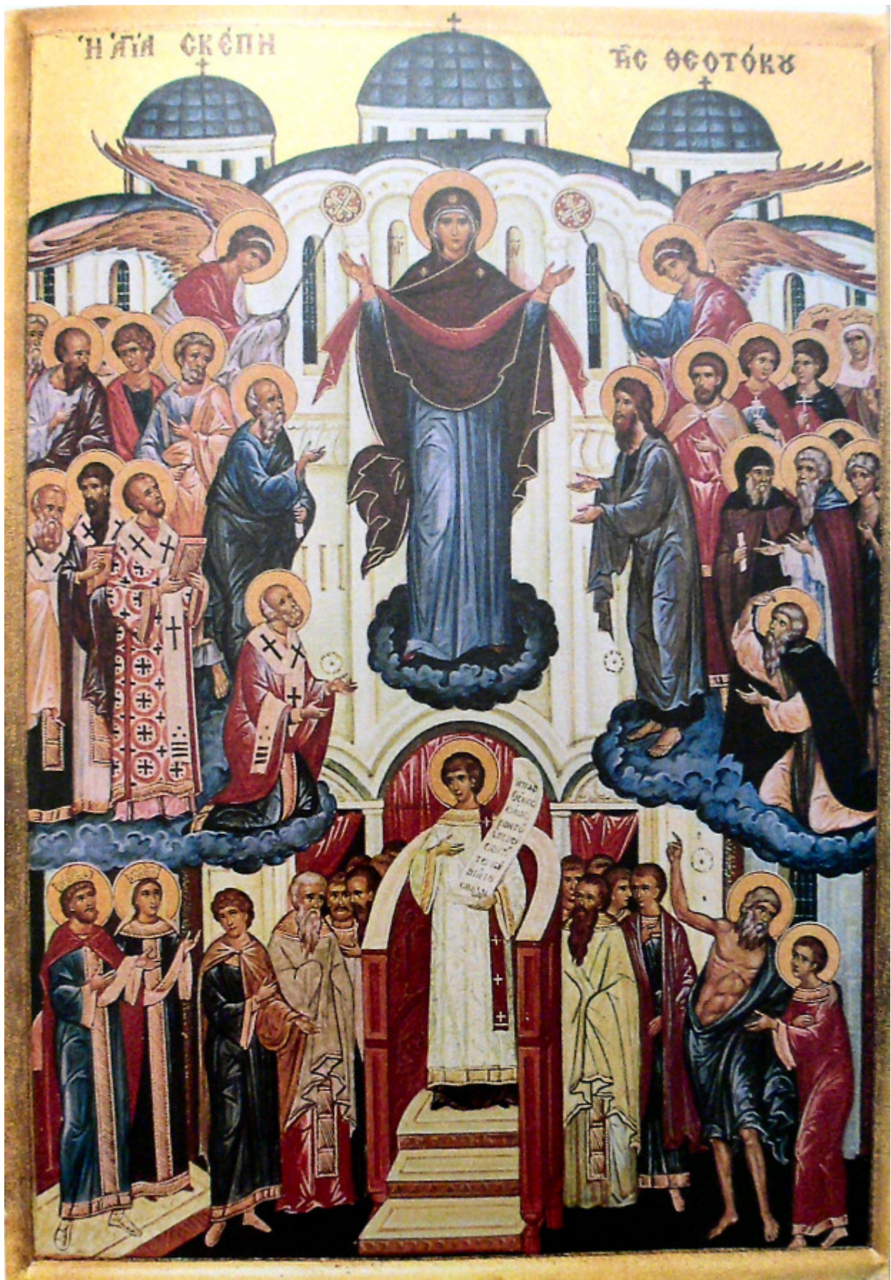
Αγία Σκέπη της Υπεραγίας Θεοτόκου