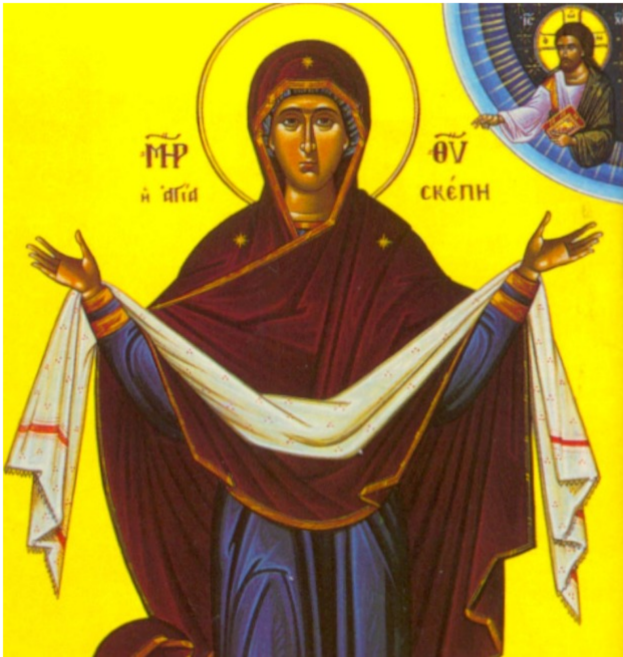
Αγία Σκέπη της Υπεραγίας Θεοτόκου