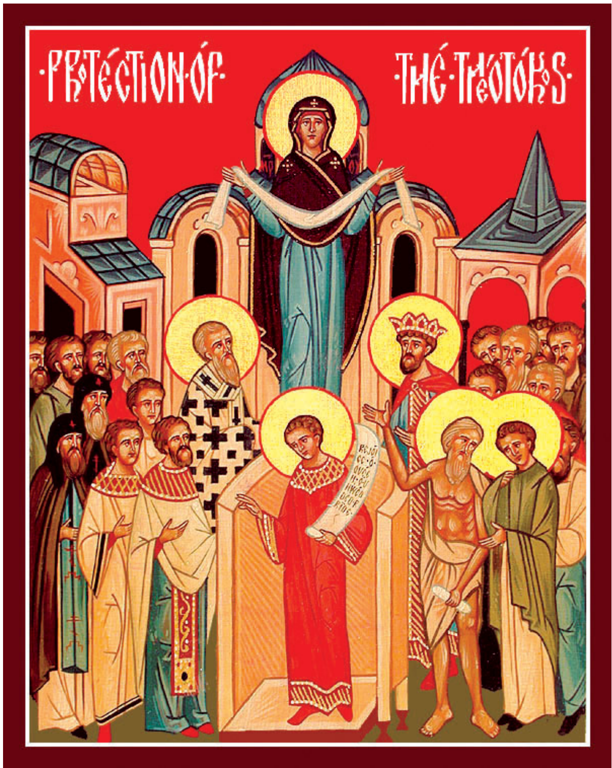
Αγία Σκέπη της Υπεραγίας Θεοτόκου