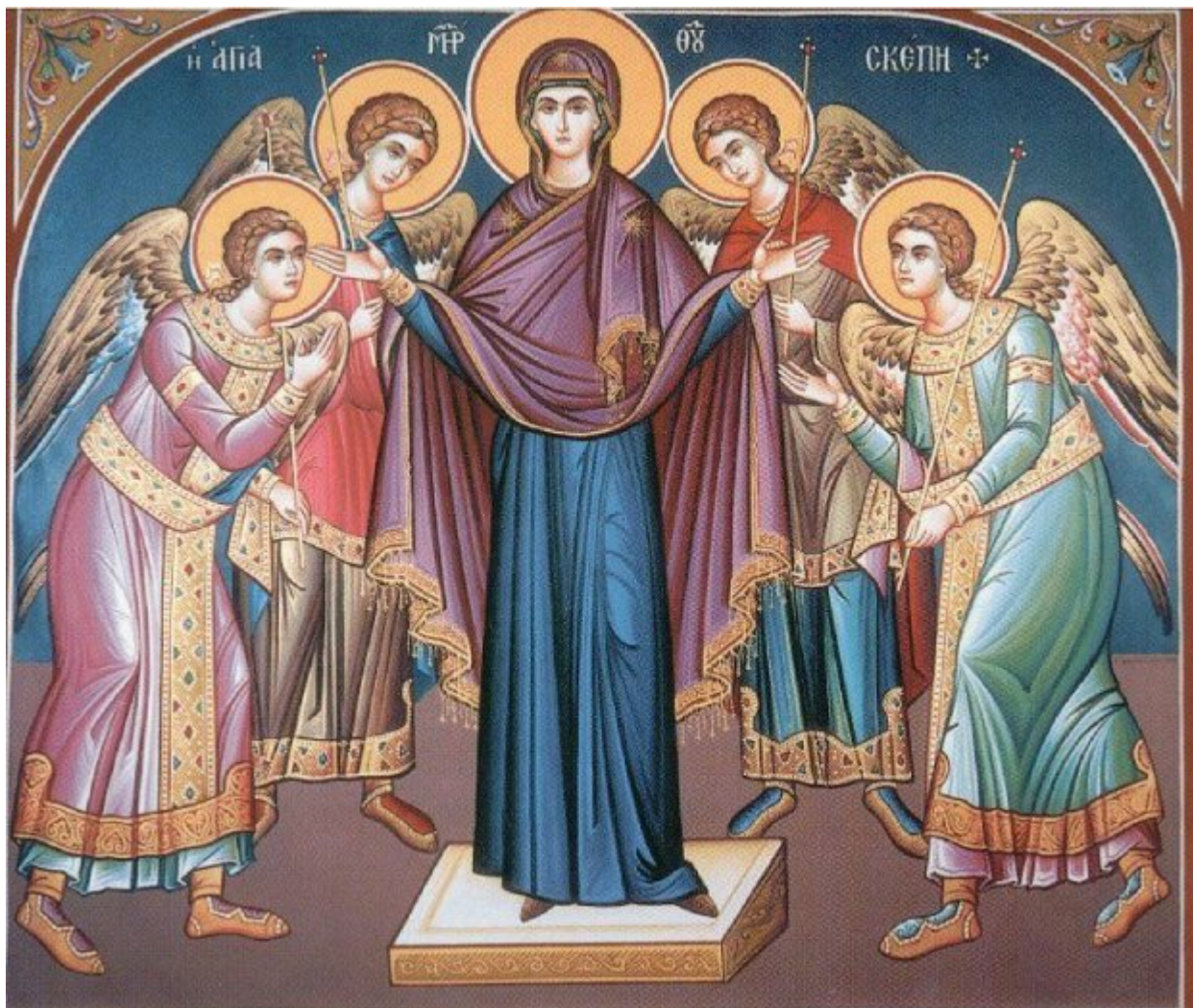
Αγία Σκέπη της Υπεραγίας Θεοτόκου

Εορτάζει στις 28 Οκτωβρίου εκάστου έτους.