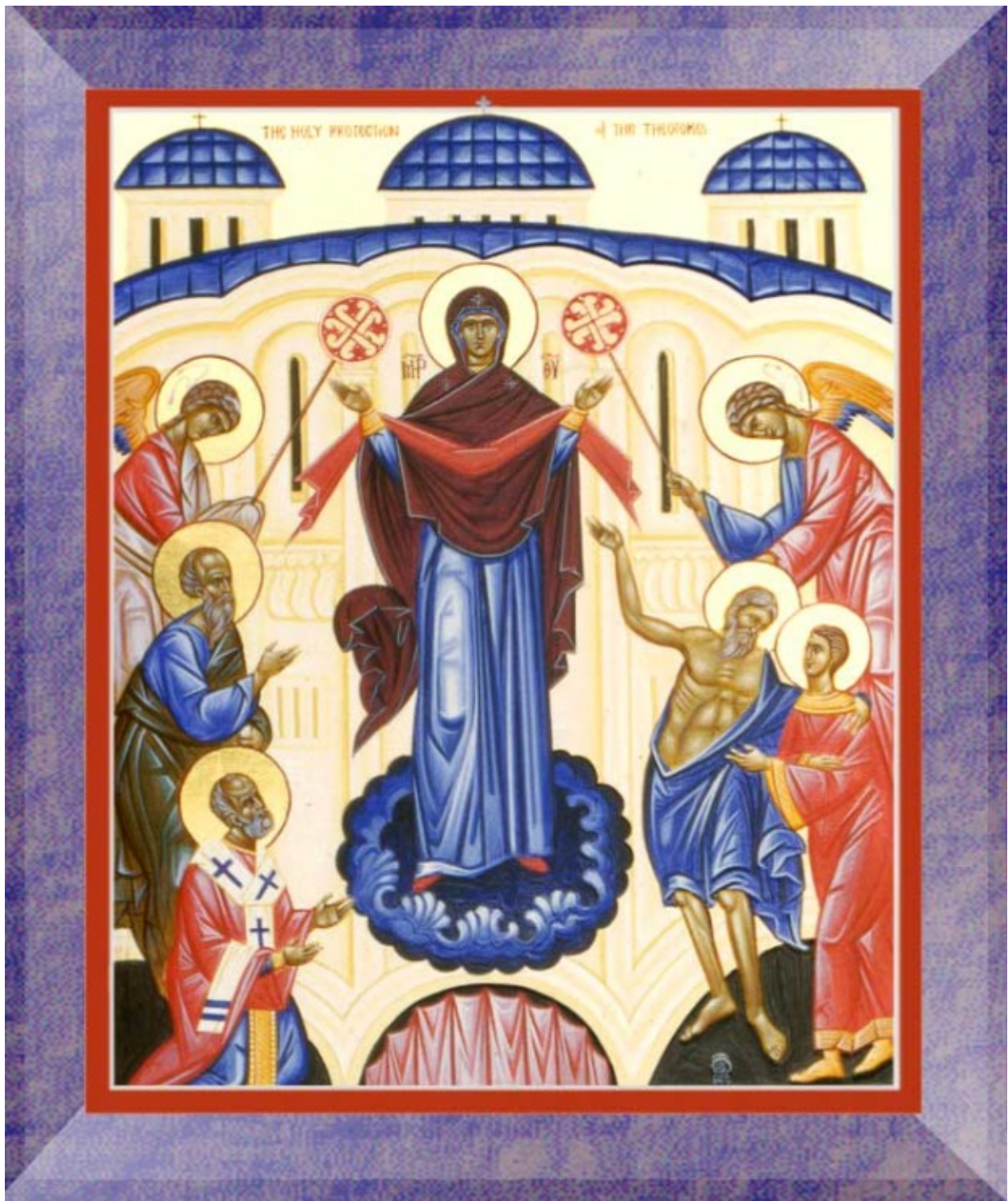
Αγία Σκέπη της Υπεραγίας Θεοτόκου