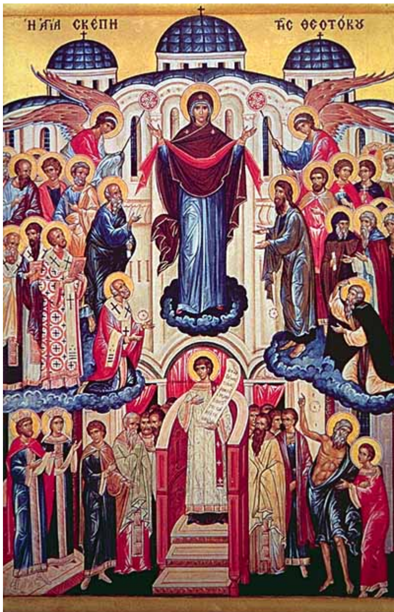
Αγία Σκέπη της Υπεραγίας Θεοτόκου