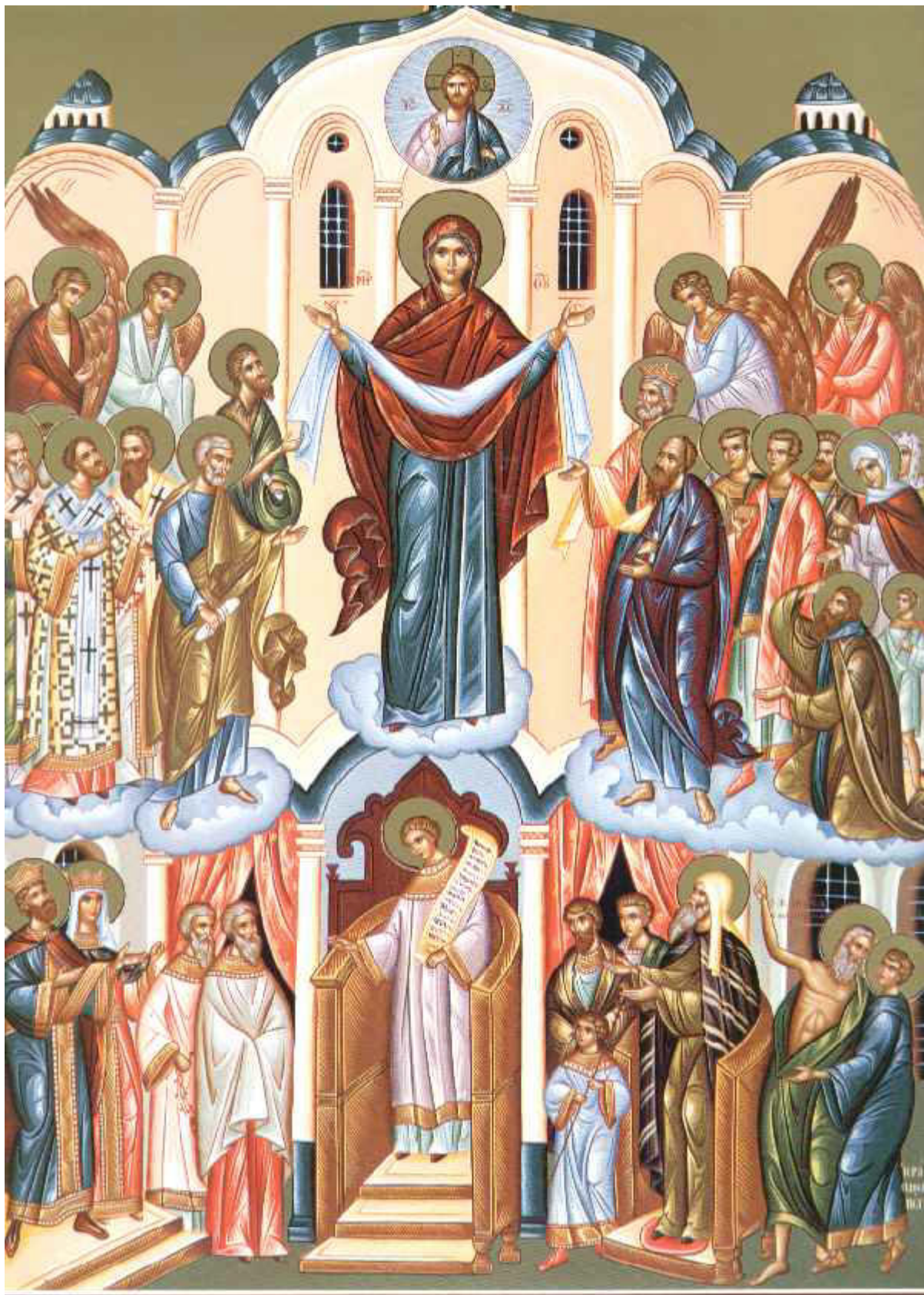
Αγία Σκέπη της Υπεραγίας Θεοτόκου