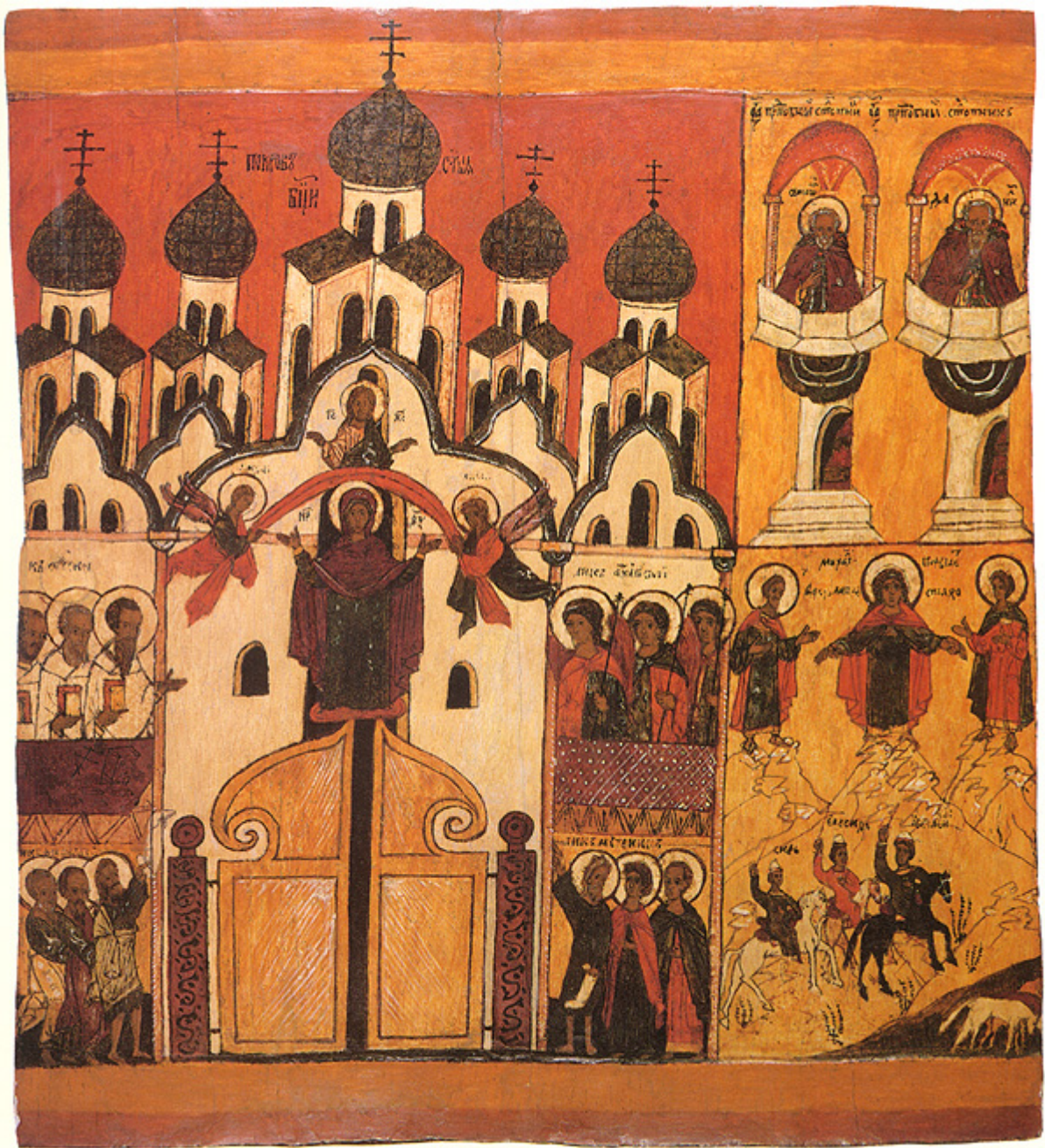
Αγία Σκέπη της Υπεραγίας Θεοτόκου