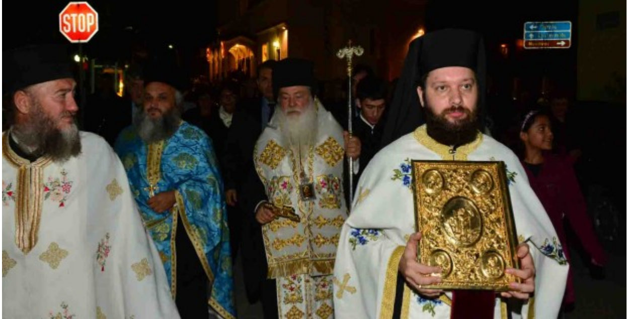
ΤΟΝ ΑΓΙΟ ΔΗΜΗΤΡΙΟ ΤΙΜΗΣΕ ΤΟ ΚΕΜΧ ΝΑΥΠΛΙΟΥ