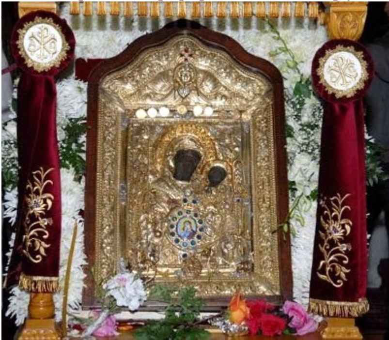
Την θαυματουργή εικόνα της

Παναγίας της Έλωνα, από την Νότια Κυνουρία και από την Ιερά Μητρόπολη Μαντινείας και Κυνουρίας, υποδέχεται την Κυριακή 18 Οκτωβρίου ο Πειραιάς, στο πλαίσιο των εορτασμών των ΔΗΜΗΤΡΙΩΝ 2015 , που πραγματοποιούνται στον Ιερό Ναό Αγίου Δημητρίου Πειραιώς από 18-28 Οκτωβρίου 2015 .