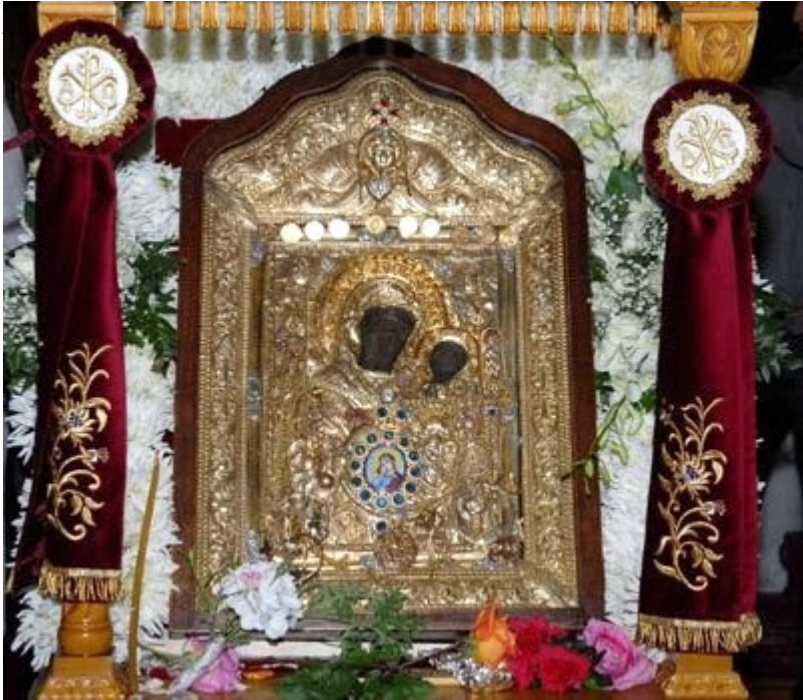
Την θαυματουργή εικόνα της

Παναγίας της Έλωνα, από την Νότια Κυνουρία και από την Ιερά Μητρόπολη Μαντινείας και Κυνουρίας, υποδέχεται την Κυριακή 18 Οκτωβρίου ο Πειραιάς, στο πλαίσιο των εορτασμών των ΔΗΜΗΤΡΙΩΝ 2015 , που πραγματοποιούνται στον Ιερό Ναό Αγίου Δημητρίου Πειραιώς από 18-28 Οκτωβρίου 2015 .