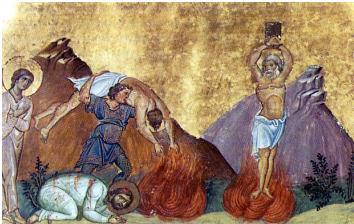
Άγιοι Κάρπος, Πάπυλος, Αγαθόδωρος και Αγαθονίκη

Εορτάζει στις 13 Οκτωβρίου εκάστου έτους.