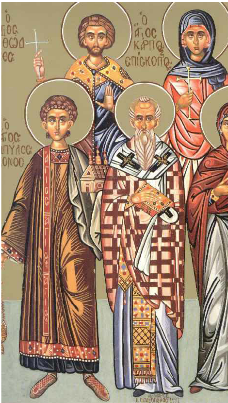
Άγιοι Κάρπος, Πάπυλος, Αγαθόδωρος και Αγαθονίκη