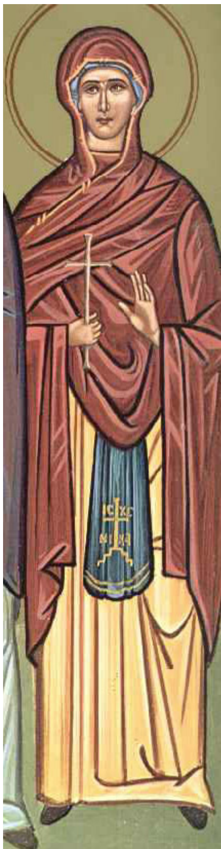
Αγία Αναστασία η Ρωμαία, η Οσιομάρτυς