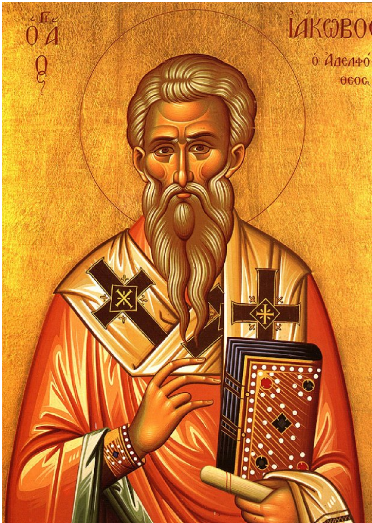
Άγιος Ιάκωβος ο Απόστολος και Αδελφός Θεός πρώτος επίσκοπος Ιεροσολύμων