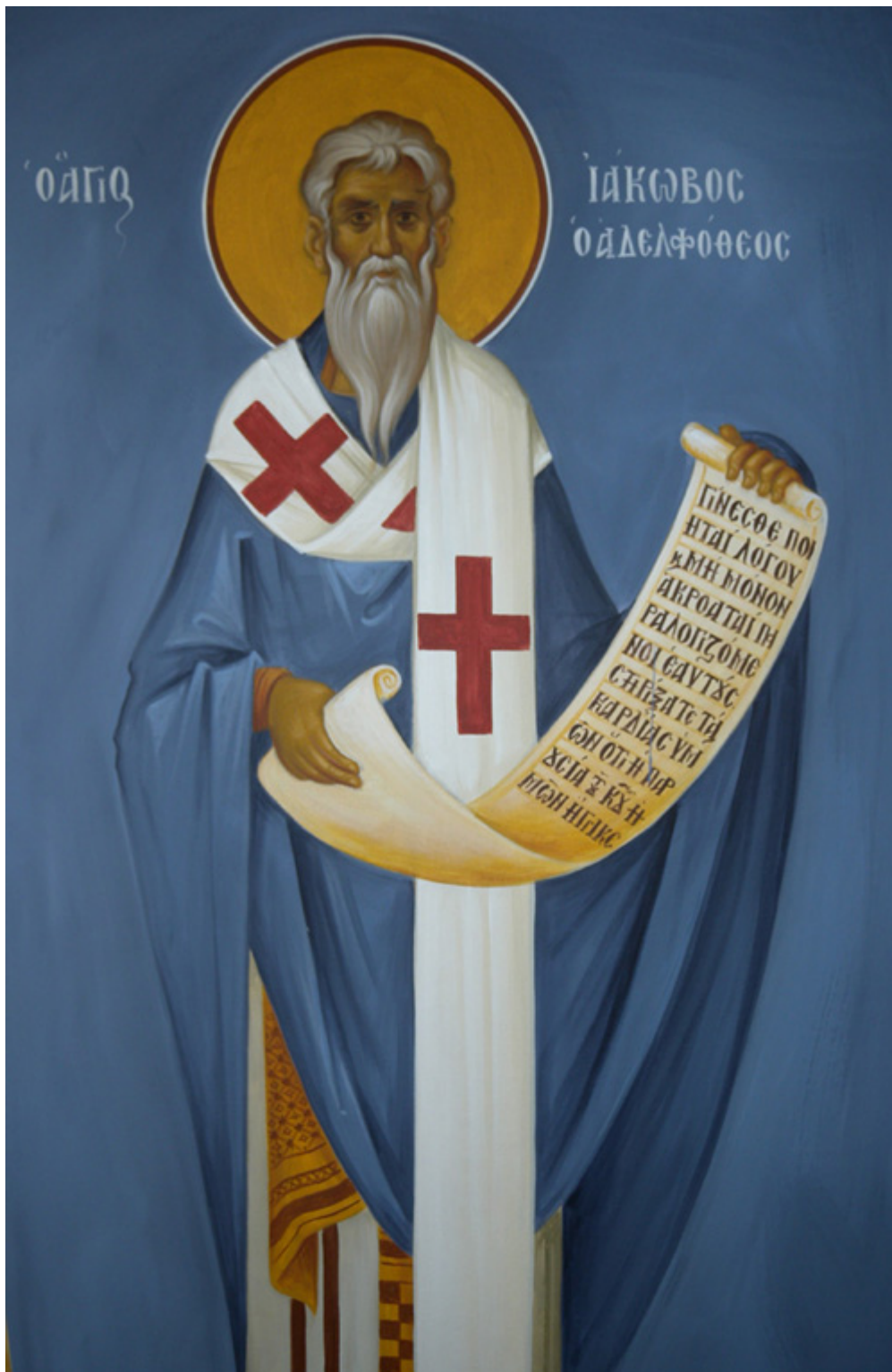
Άγιος Ιάκωβος ο Απόστολος και Αδελφός - Ι. Ν. Οσίων Παρθενίου και Ευμενίου των εν Κουδουμά, δια χειρός Παναγιώτη Μόσχου (2006 μ.Χ.)

Εορτάζει στις 23 Οκτωβρίου εκάστου έτους.