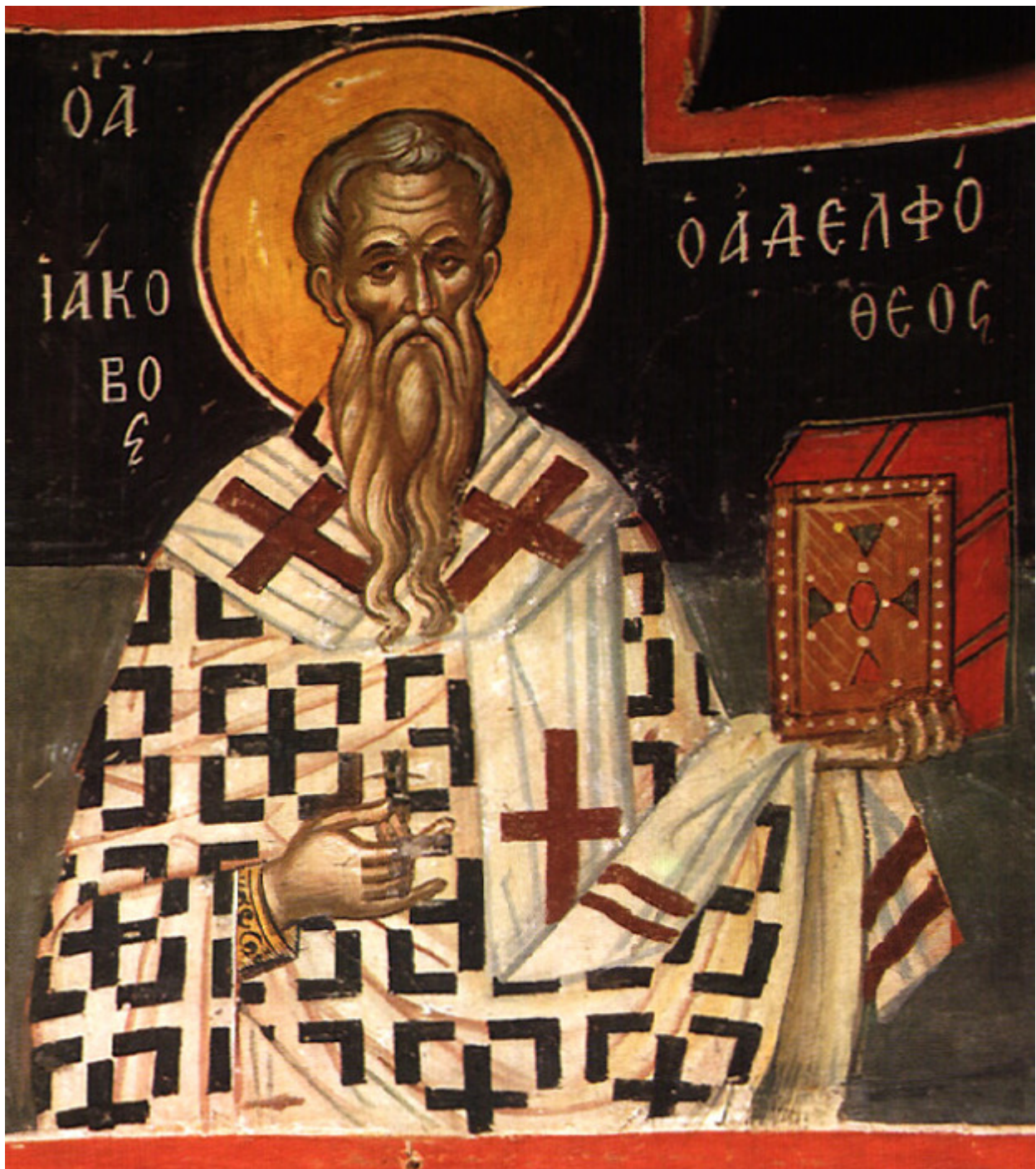
Άγιος Ιάκωβος ο Απόστολος και Αδελφός Θεός πρώτος επίσκοπος Ιεροσολύμων