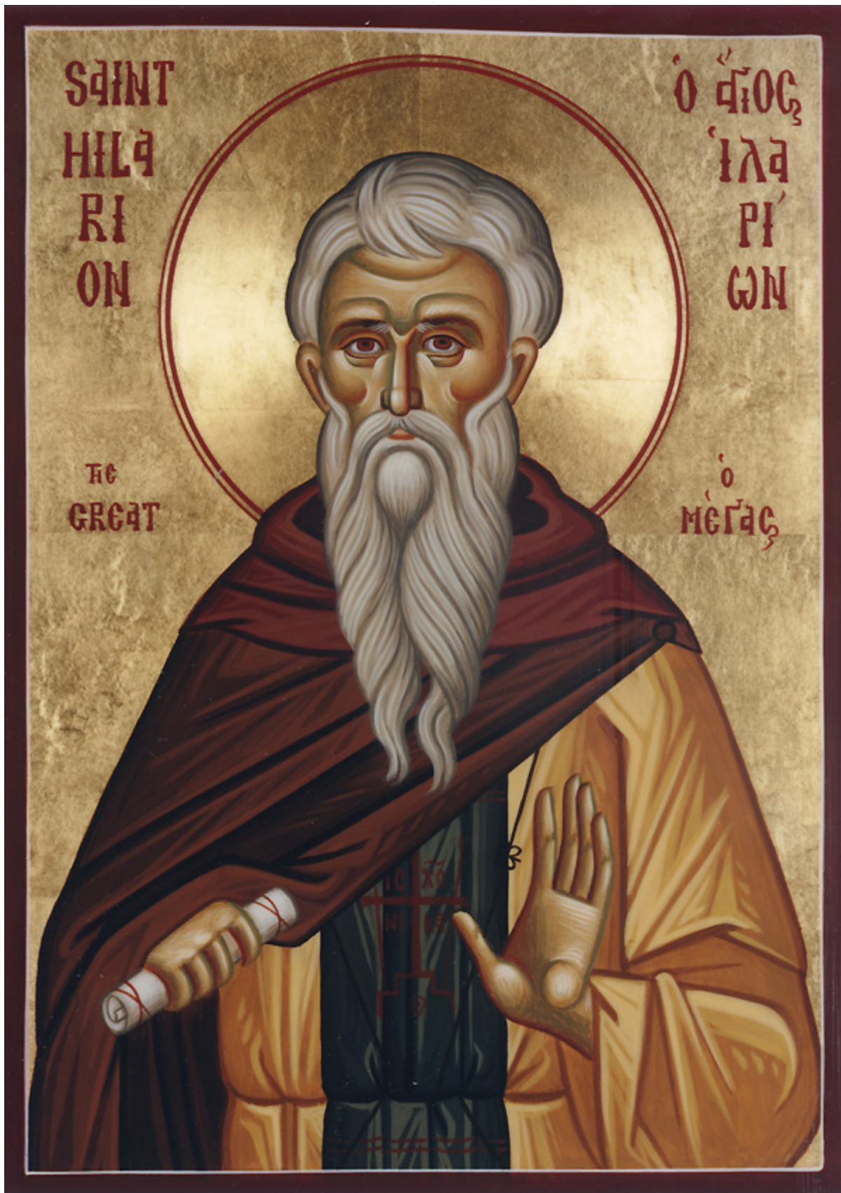
Όσιος Ιλαρίων ο Μέγας

Εορτάζει στις 21 Οκτωβρίου εκάστου έτους.