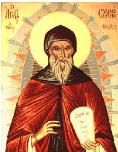
Όσιος Συμεών ο Νέος Θεολόγος