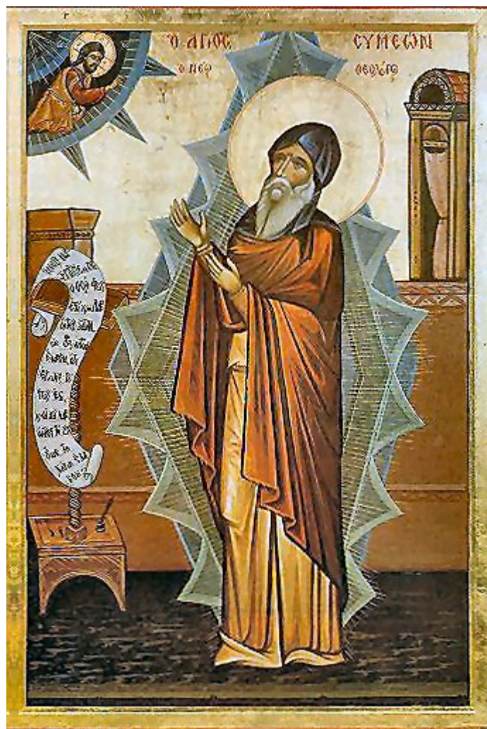
Όσιος Συμεών ο Νέος Θεολόγος