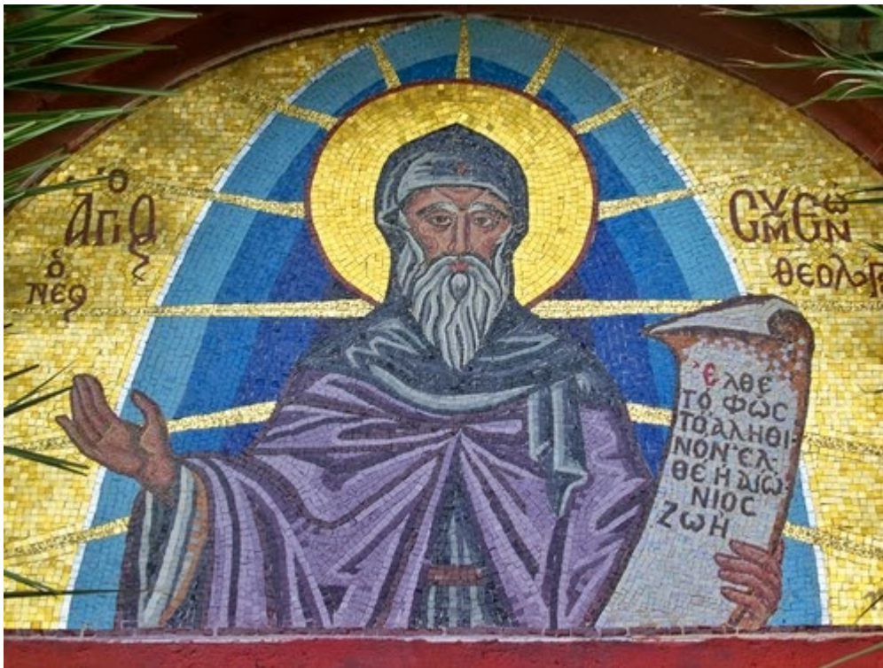
Όσιος Συμεών ο Νέος Θεολόγος