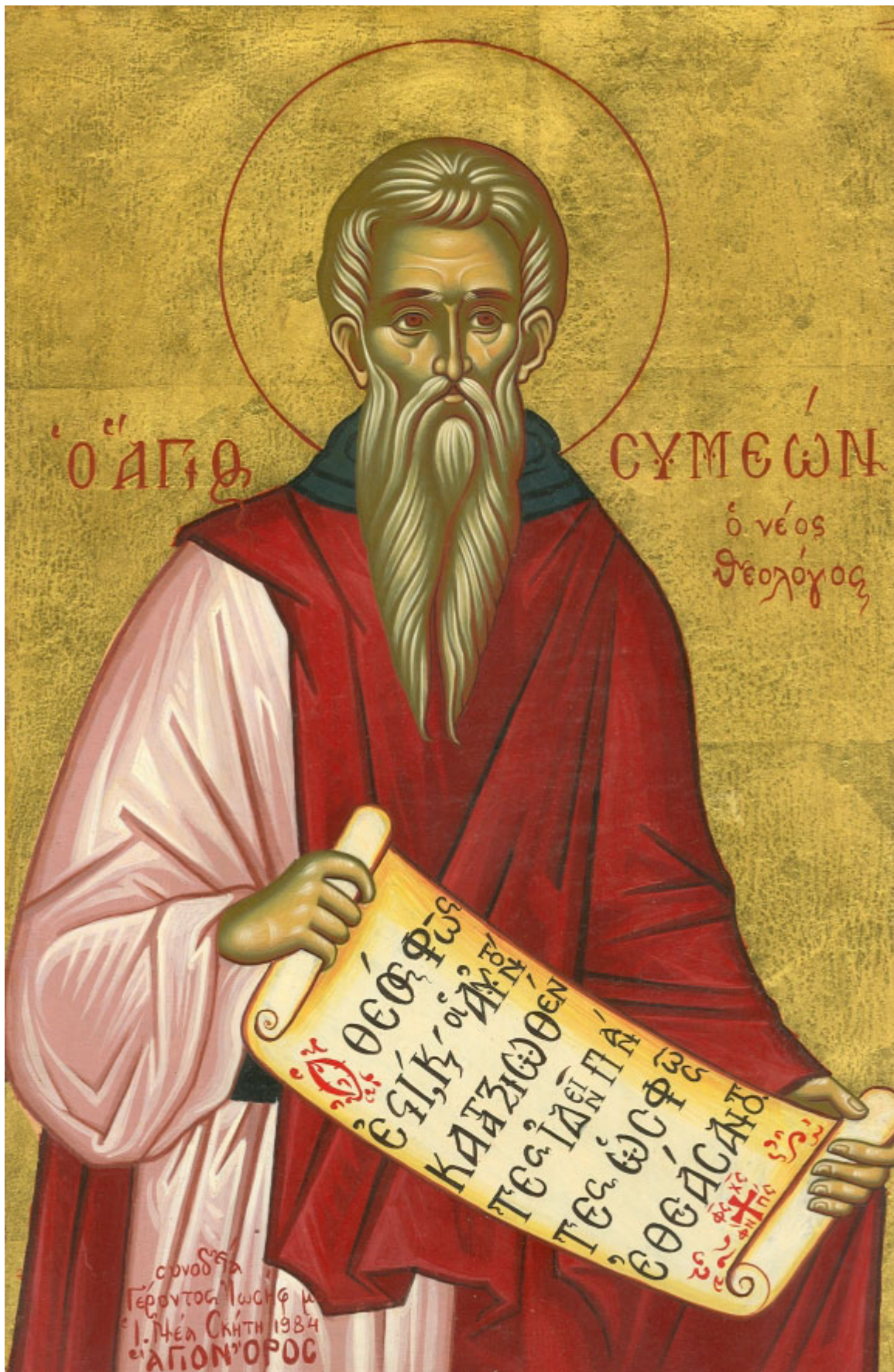
Όσιος Συμεών ο Νέος Θεολόγος