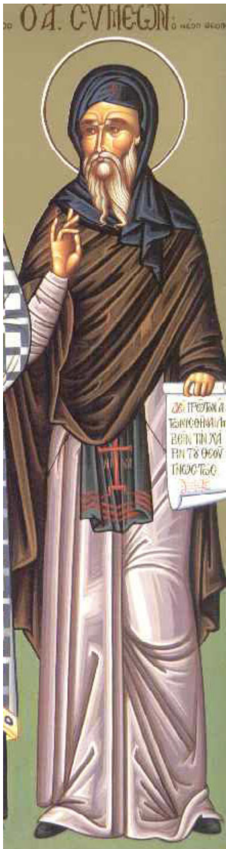
Όσιος Συμεών ο Νέος Θεολόγος