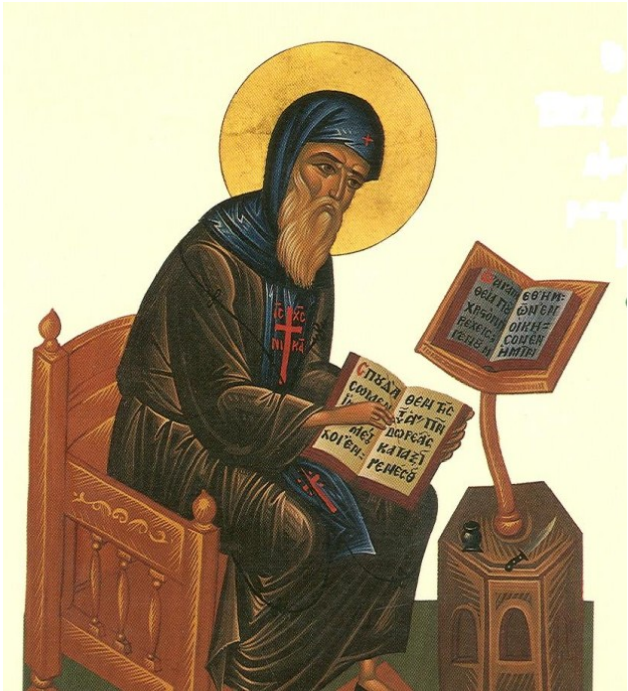
Όσιος Συμεών ο Νέος Θεολόγος