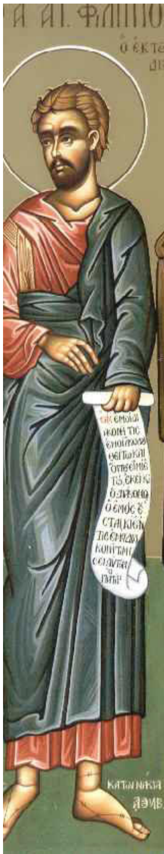
Άγιος Φίλιππος ο Απόστολος ένας από τους επτά Διακόνους