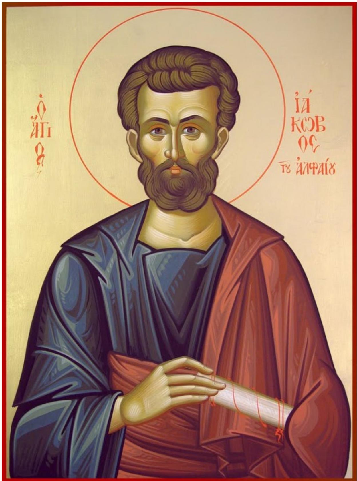
Ἅγιος Ἰάκωβος του Αλφαίου, ο Απόστολος

Εορτάζει στις 9 Οκτωβρίου εκάστου έτους.