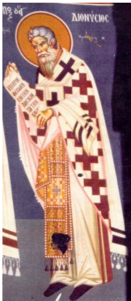
Άγιος Διονύσιος ο Αρεοπαγίτης