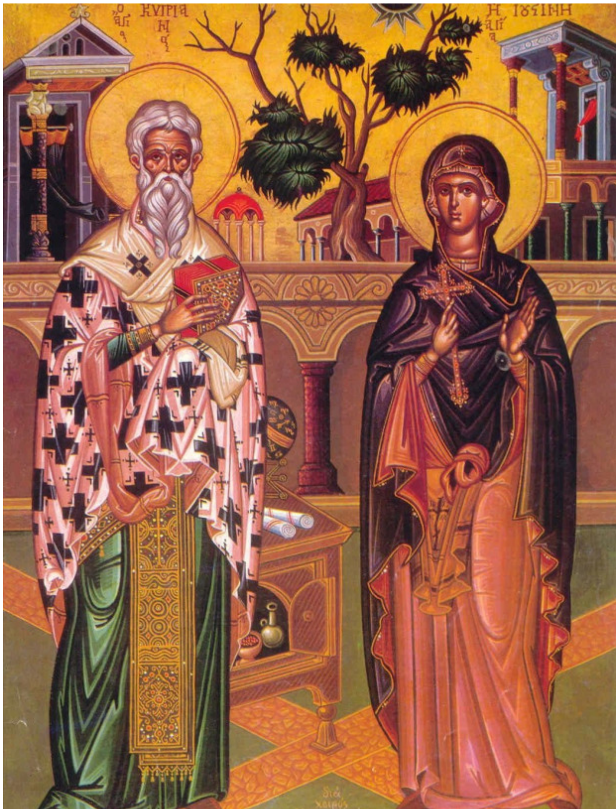
Άγιος Κυριανός και Αγία Ιουστίνη