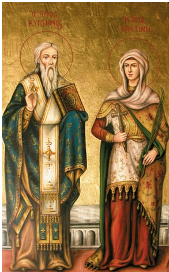
Άγιος Κυπριανός και Αγία Ιουστίνη

Εορτάζει στις 2 Οκτωβρίου εκάστου έτους.