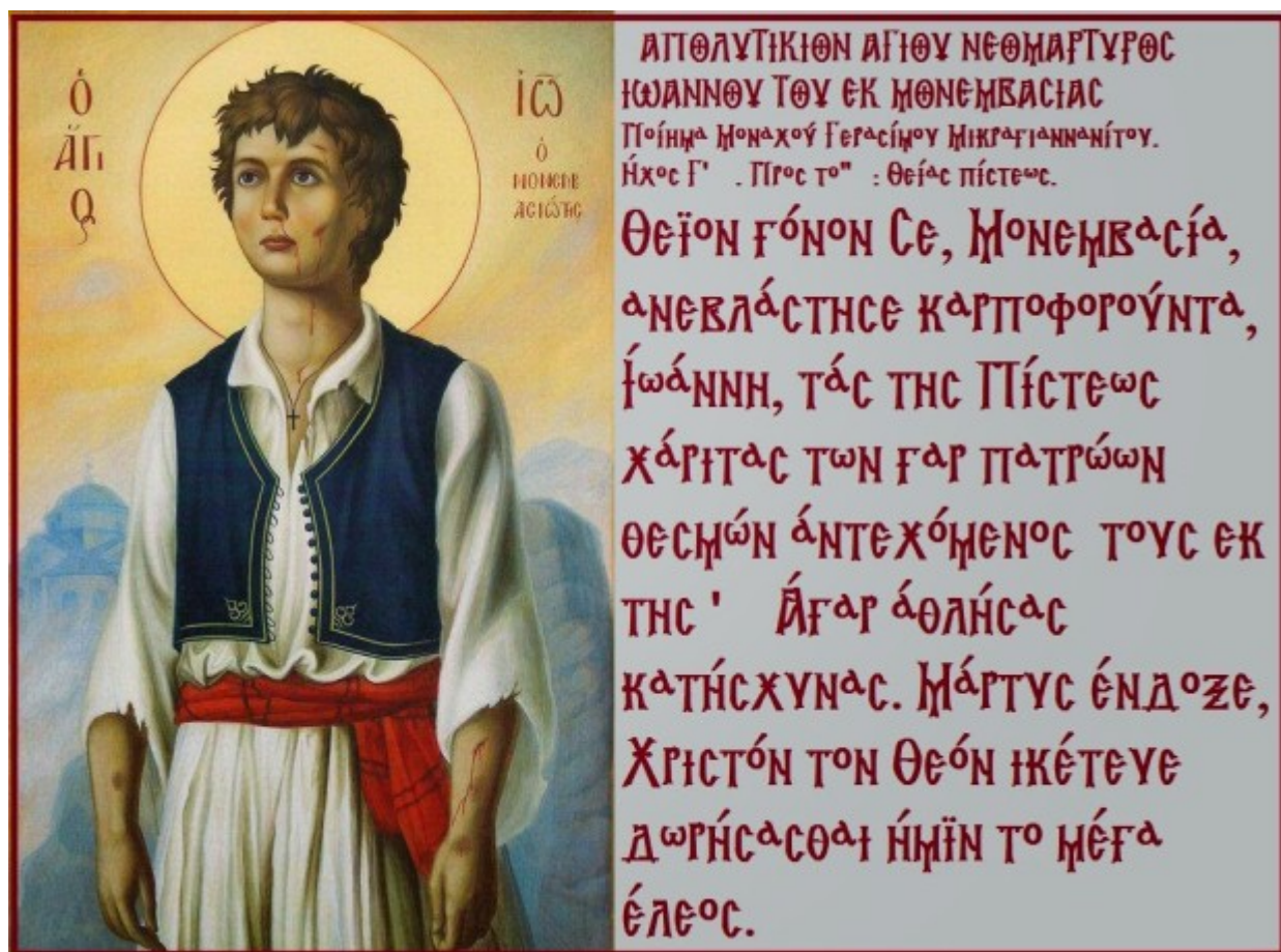
Ο Άγιος Νεομάρτυς Ιωάννης ο Μονεμβασιώτης