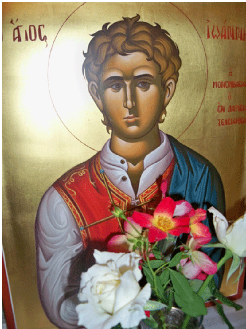
Ο έφηβος Νεομάρτυς Άγιος Ιωάννης ο Μονεμβασιώτης (1758 - 21η Οκτωβρίου 1773). Ένα πρότυπο για τους συγχρόνους εφήβους- νέους