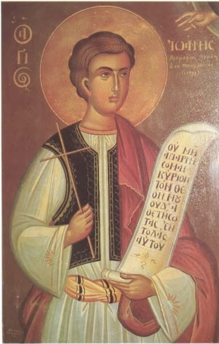
Φορητή εικών του άγιου Ιωάννου του Μονεμβασιώτου. Έργον του Λαρισσίου άγιογράφου Εύαγγ. Καραβασίλη.