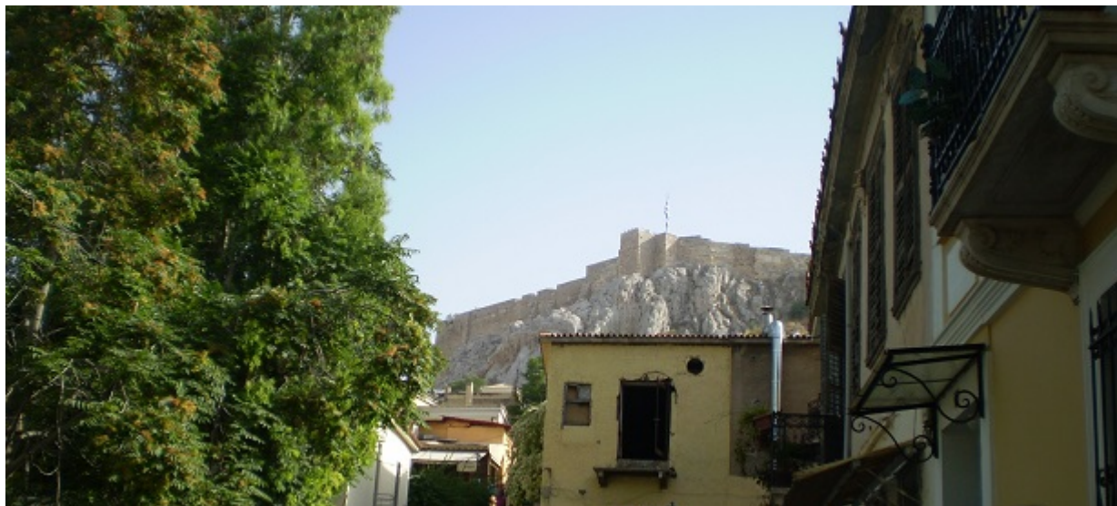
OLYMPUS DIGITAL CAMERA

20.00: Επίσκεψη στο ΠΛΙ - Μουσείο "Β.Παπαντωνίου" στην προθήκη για τον πρώτο κυβερνήτη της Ελλάδας όπου θα εκτίθεται και το έργο του Διονυσίου Τσόκου «Η δολοφονία του Ιωάννη Καποδίστρια»