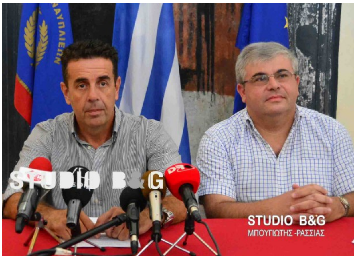
STUDIO B&G ΜΠΟΥΓΙΩΤΗΣ -ΡΑΣΣΙΑΣ