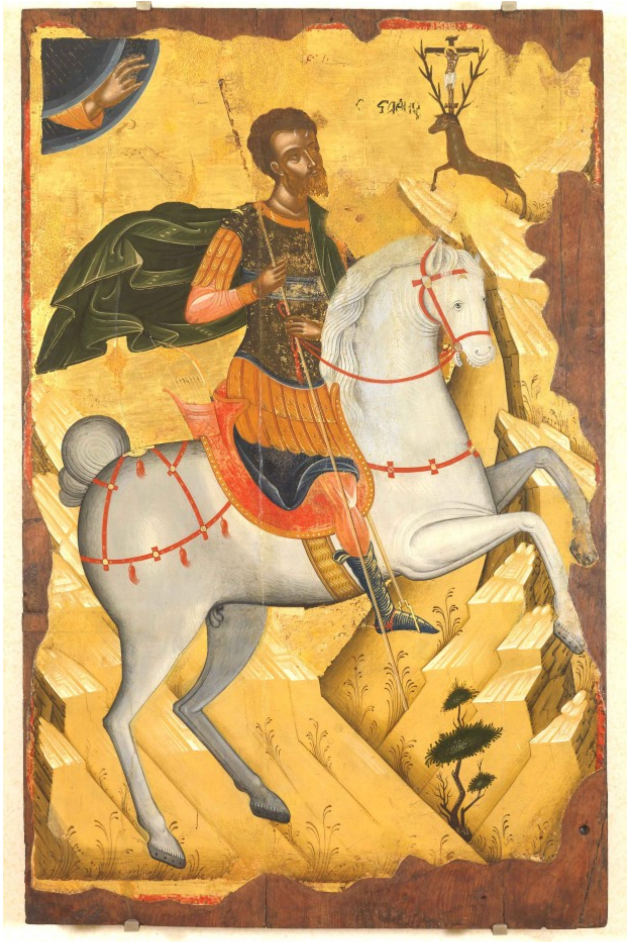
Άγιος Ευστάθιος - άγνωστος Κρητικός ζωγράφος, αρχές 16ου αιώνα μ.Χ.