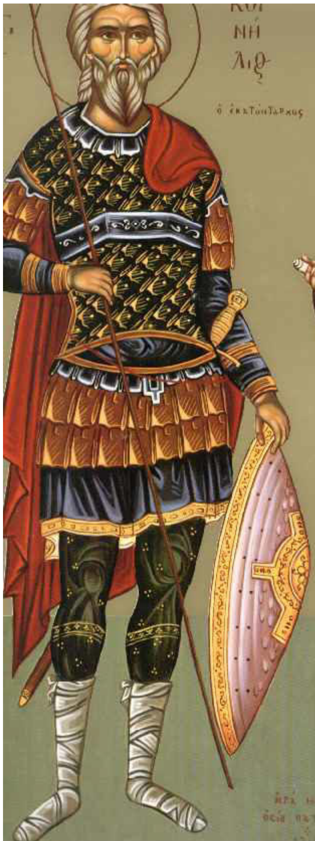
Άγιος Κορνήλιος ο Εκατόνταρχος