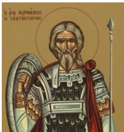
Άγιος Κορνήλιος ο Εκατόνταρχος

Για τον Άγιο Κορνήλιο αναφέρουν οι Πράξεις των Αποστόλων (Ι, 1-13). Ήταν θεοσεβούμενος Ρωμαίος Εκατόνταρχος. Άγγελος Κυρίου του υπέδειξε να συναντήσει τον Απόστολο Πέτρο. Ο Κορνήλιος μεταστράφηκε στο Χριστιανισμό και δίδαξε την διδασκαλία του Χριστού στην Φοινίκη, την Κύπρο, την Αντιόχεια και την Έφεσο. Εξελέγη Επίσκοπος Σκήψης της Μυσίας. Ο ιεραποστολικός του ζήλος απέφερε πλούσιους καρπούς και πολλοί ήσαν οι ειδωλολάτρες που πίστεψαν στο Ευαγγέλιο. Κάποιοι κατήγγειλαν τον Κορνήλιο στον Έπαρχο Δημήτριο, ο οποίος τον συνέλαβε και τον οδήγησε σε ειδωλολατρικό ναό ενώπιον πλήθους, προκειμένου να θυσιάσει στα είδωλα. Ο Κορνήλιος όχι μόνο έμεινε αμετακίνητος στην πίστη του αλλά κατάφερε με την ομολογία του να κάνει να πιστέψουν στη διδασκαλία του Ευαγγελίου η σύζυγος και ο υιός του Επάρχου. Είπε μάλιστα στο Δημήτριο ότι η οικογένειά του δεν θα πάθει κανένα κακό. Ο Έπαρχος κατάλαβε λίγο αργότερα το νόημα των λόγων αυτών, όταν έγινε μεγάλος σεισμός που ισοπέδωσε το ναό και η σύζυγος με τον υιό του βγήκαν ανέπαφοι από τα ερείπια.