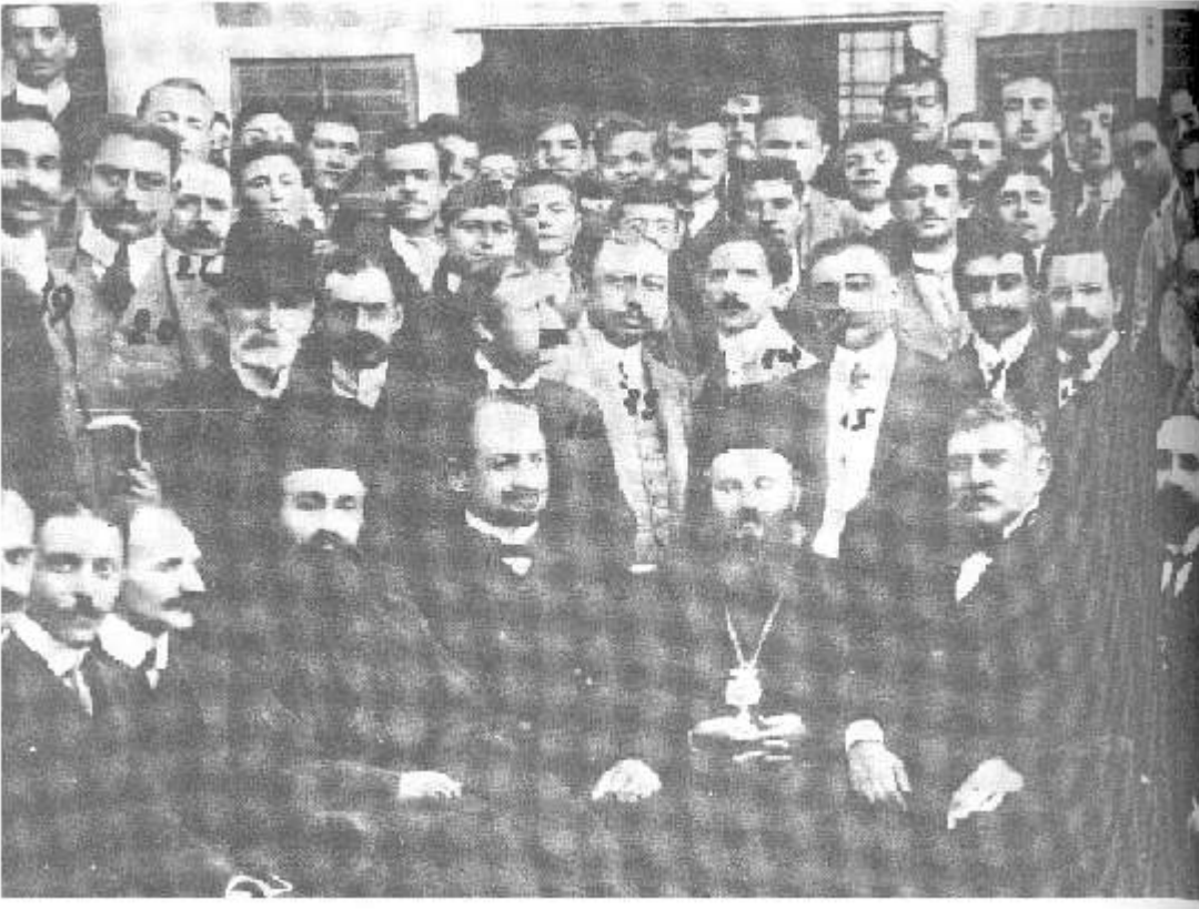
Άγιος Χρυσόστομος Σμύρνης