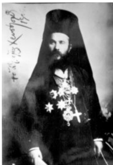
Άγιος Χρυσόστομος Σμύρνης