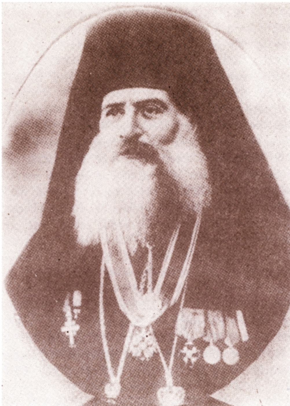
Άγιος Αμβρόσιος Μοσχονησίων

Ο Άγιος Αμβρόσιος σπούδασε στη Θεολογική Σχολή του Τιμίου Σταυρού Ιεροσολύμων και στη θεολογική Ακαδημία του Κιέβου. Υπήρξε δε εφημέριος σε πολλές ελληνικές κοινότητες της Κριμαίας (Θεοδοσίας, Συμφεροπόλεως, Σεβαστουπόλεως). Το 1913 μ.Χ. χειροτονήθηκε βοηθός επίσκοπος της Μητροπόλεως Σμύρνης με τον τίτλο Ξανθουπόλεως, αναπλήρωσε δε τον εξόριστο μητροπολίτη κατά τη διάρκεια του Α΄ παγκοσμίου πολέμου. Το 1919 μ.Χ. χρησιμοποιήθηκε ως πατριαρχικός έξαρχος στα Μοσχονήσια, το δε 1922 μ.Χ. έγινε Μητροπολίτης Μοσχονησίων. Κατά τη Μικρασιατική καταστροφή τάφηκε ζωντανός, από τους Τούρκους μαζί με άλλους εννέα Ιερείς σε λάκκο έξω από την