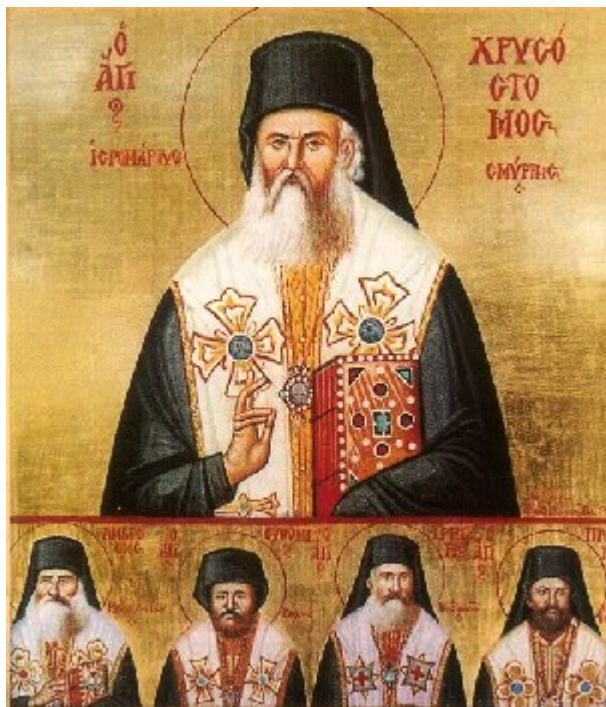
Άγιος Χρυσόστομος Σμύρνης