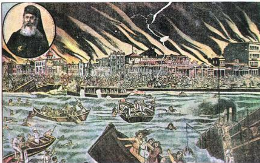
Η Μικρασιατική Καταστροφή