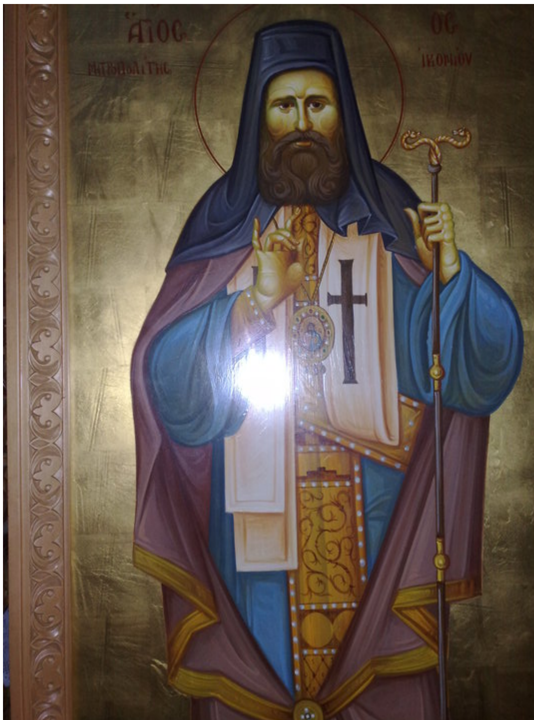
Άγιος Προκόπιος Ικονίου (έργο Αναστασίου Δρακόπουλου - Ιερός Ναός Αγίου Κοσμά Αιτωλού Ν.Φιλαδέλφειας)

Προηγούμενος επίσκοπος Αμφιπόλεως (1894 - 1899 μ.Χ.) και Μητροπολίτης Δυρραχείου (1899 - 1906 μ.Χ.) και Φιλαδέλφειας (1906 - 1911 μ.Χ.). Ήταν και