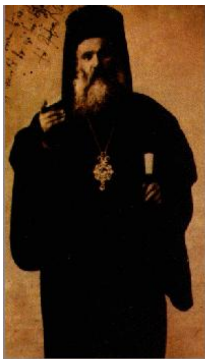
Άγιος Χρυσόστομος Σμύρνης