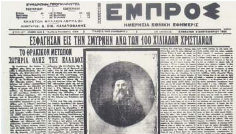
Άγιος Χρυσόστομος Σμύρνης