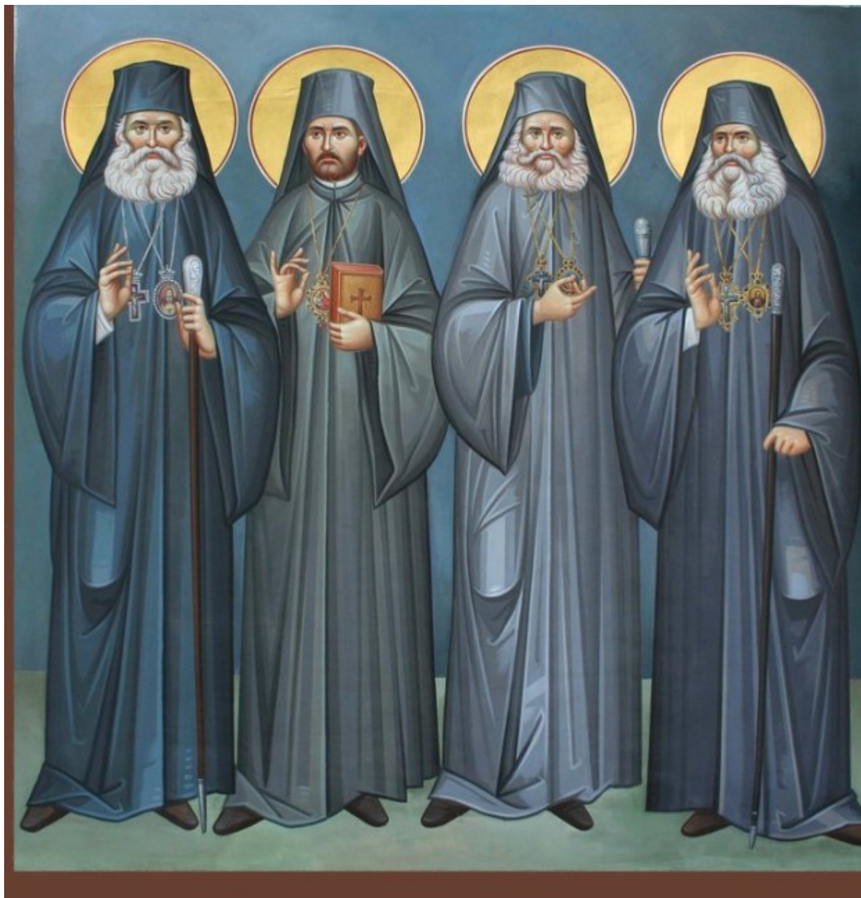
Άγιοι Αρχιερείς Προκόπιος Ικονίου, Γρηγόριος Κυδωνιών, Αμβρόσιος Μοσχονησίων, Ευθύμιος Ζήλων