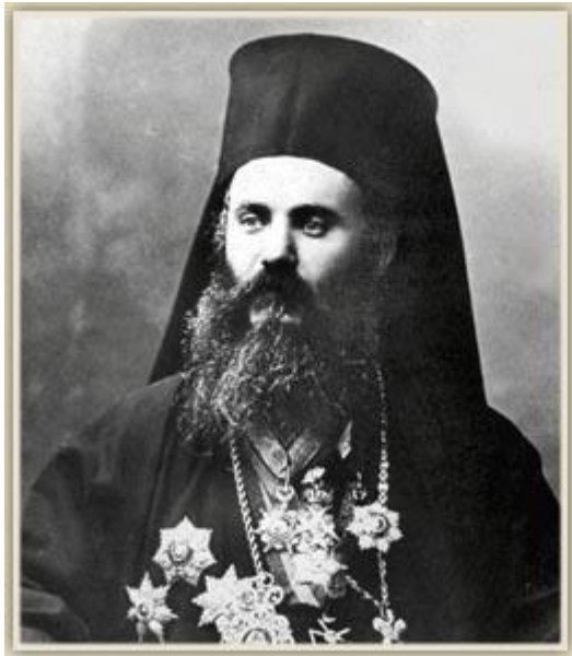
Άγιος Χρυσόστομος Σμύρνης