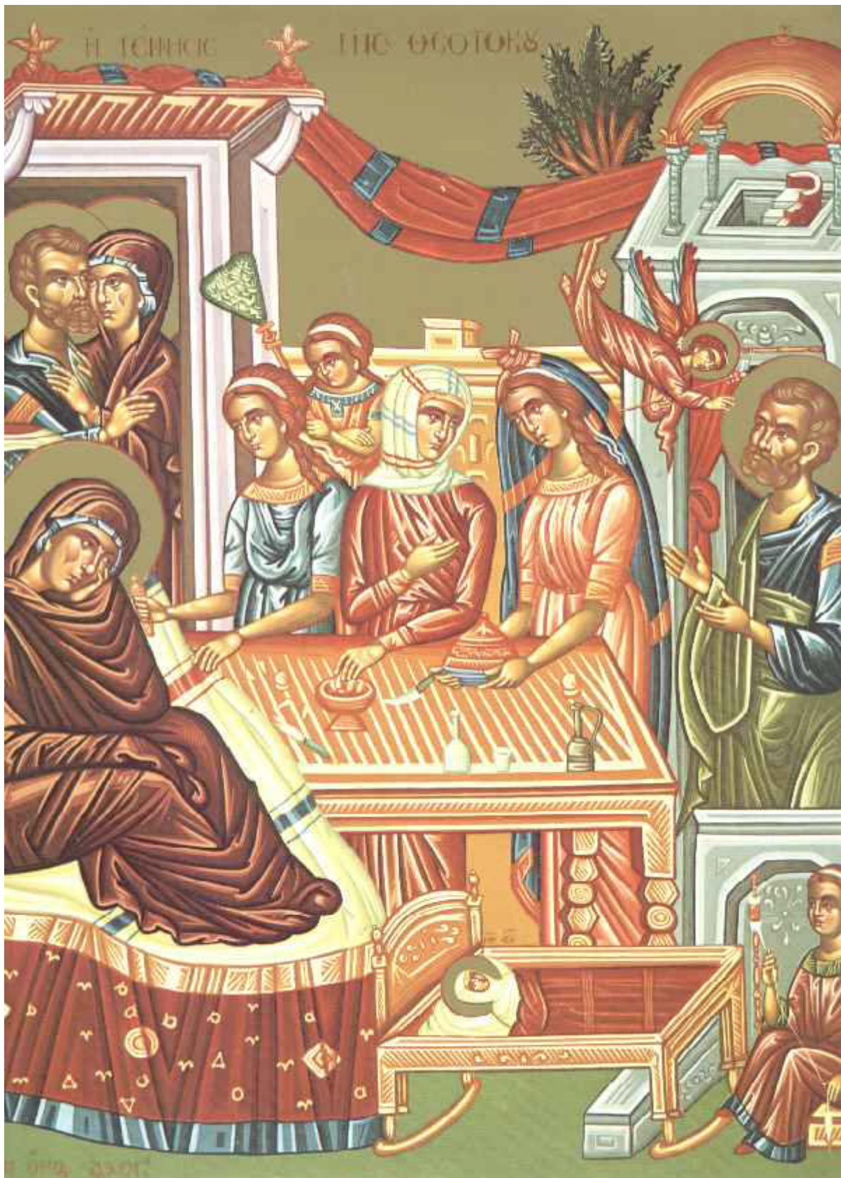
Γέννηση της Υπεραγίας Θεοτόκου