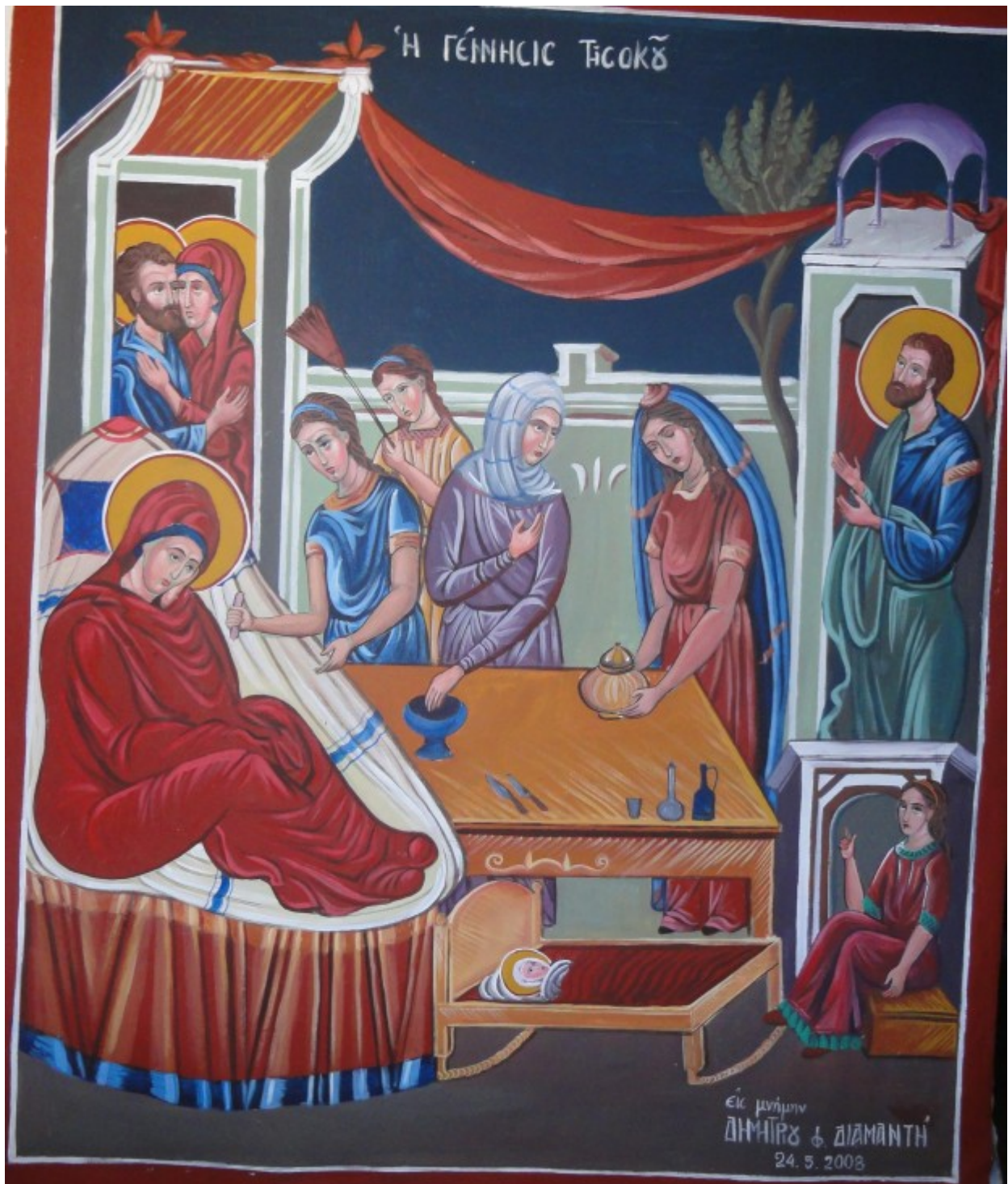
Γέννηση της Υπεραγίας Θεοτόκου - Πηνελόπη Σχιζοδήμου© (www.porpe.gr)