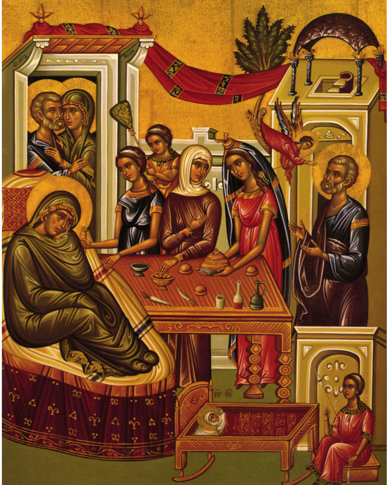
Γέννηση της Υπεραγίας Θεοτόκου