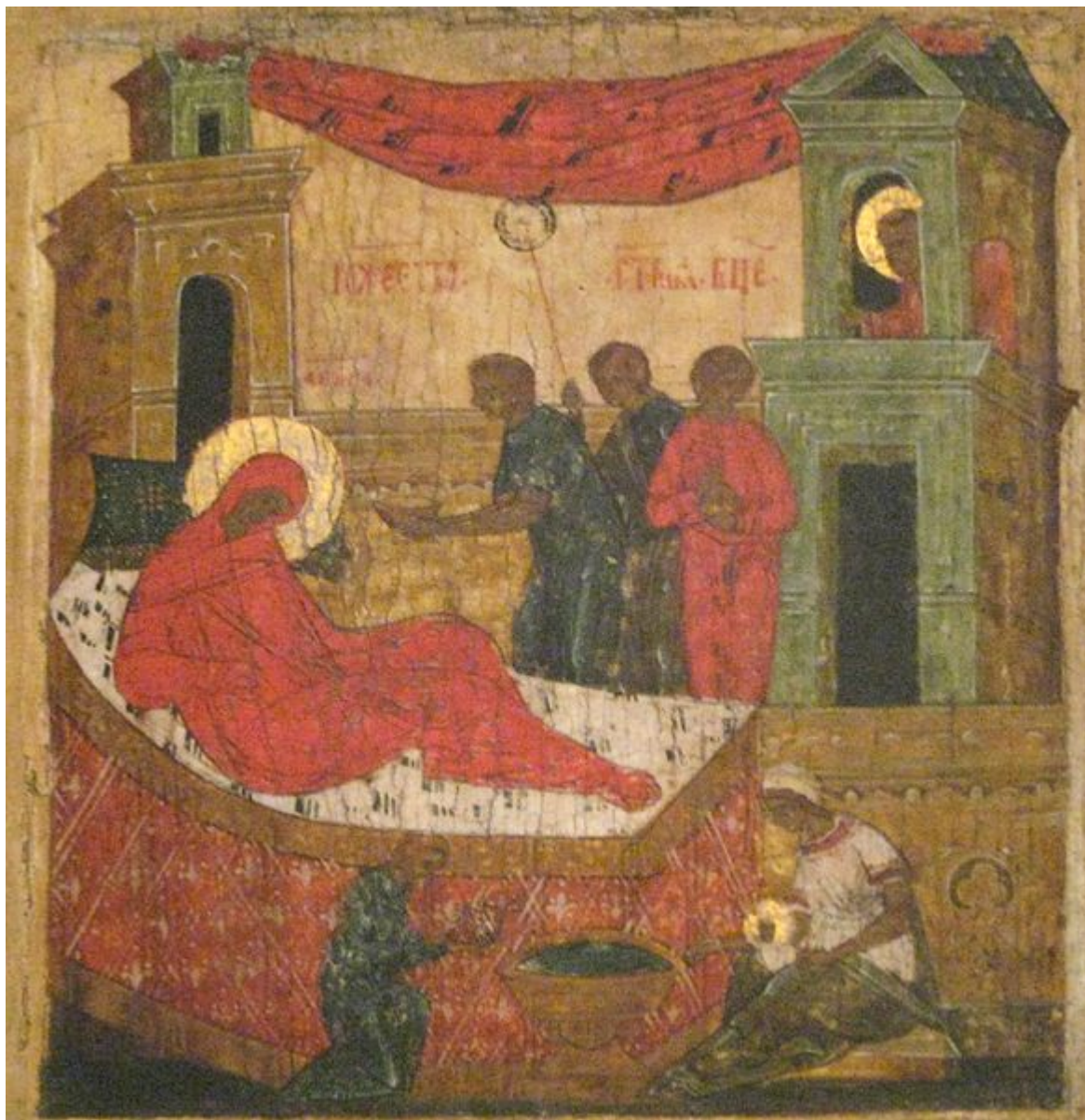
Γέννηση της Υπεραγίας Θεοτόκου