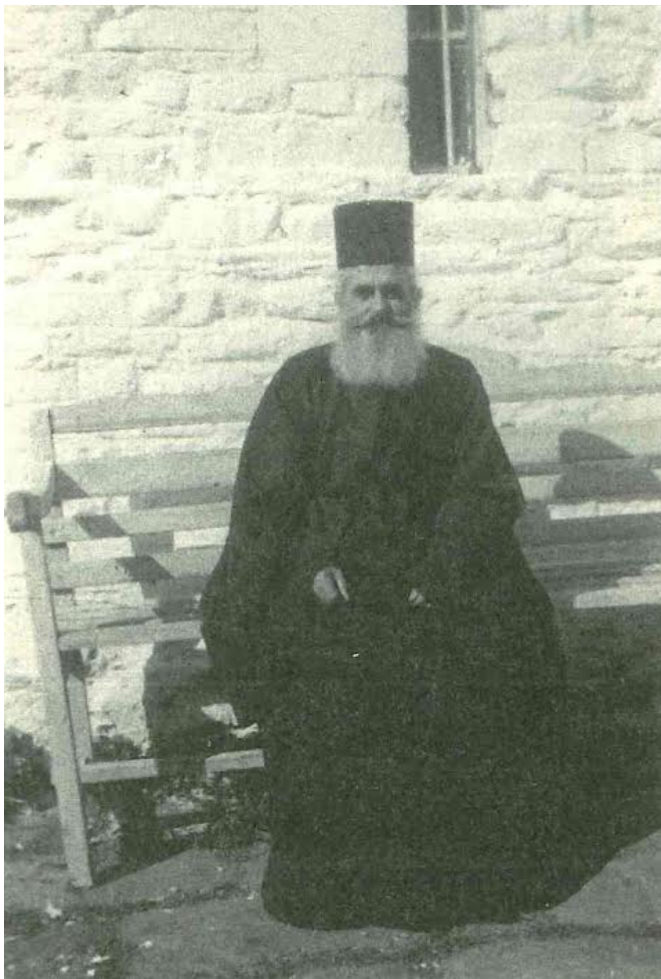
Ιεροδιάκονος Αρκάδιος Βατοπεδινός σεμνός και ταπεινός πάντοτε

Όταν το 1917 η Γεροντική Σύναξη της μονής, για κάποιο σοβαρό θέμα, διχάσθηκε κι επήλθε μεγάλη αναστάτωση, ο Γέροντας Αρκάδιος προσπάθησε να κατευνάσει τα πνεύματα και να ενώσει τις δύο μερίδες. Όταν είδε ότι δεν τα καταφέρνει, προτίμησε ν' αποσυρθεί στο μετόχι της μονής, τον Άγιο Μάμα Χαλκιδικής, επί μία τετραετία, ώστε να περάσει ο πειρασμός και να έλθει η ειρήνη. Όταν το 1922 ήλθαν οι πρόσφυγες από τη Μικρά Ασία στην Ελλάδα, ο Γέροντας Αρκάδιος μερίμνησε να συγκεντρώσει τους πρόσφυγες της ιδιαίτερης πατρίδος του και να τους εγκαταστήσει στο Βατοπεδινό Μετόχι στον Πρόβλακα, ιδρύοντας το χωριό Νέα Ρόδα. Αρκετές φορές τους επισκεπτόταν, στηρίζοντάς τους υλικά και