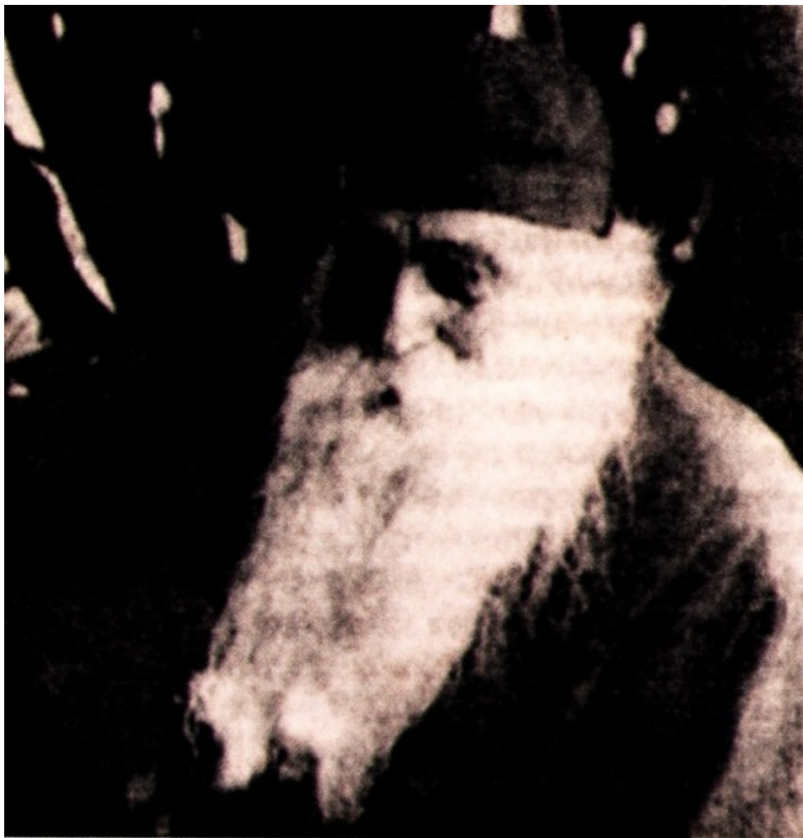
Γέροντας Νεκτάριος ο Πνευματικός. ο ευλαβέστατος και ευσεβέστατος

Γεννήθηκε στις 28.3.1904, ημέρα Κυριακή του Πάσχα, στην Περαχώρα Κορινθίας. Μικρός μετοίκησε με τους γονείς του στο χωριό Καπαρέλι Θηβών. Εκεί έμαθε τα πρώτα γράμματα ο τότε Νικόλαος.