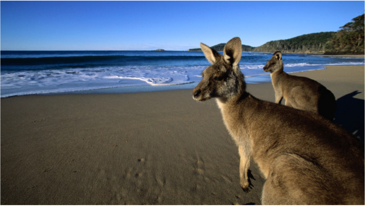
ca. 1990-2000, Australia — Eastern Grey Kangaroos on the Beach