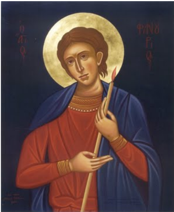
Άγιος Φανούριος ο Νεοφανής, ο Μεγαλομάρτυρας