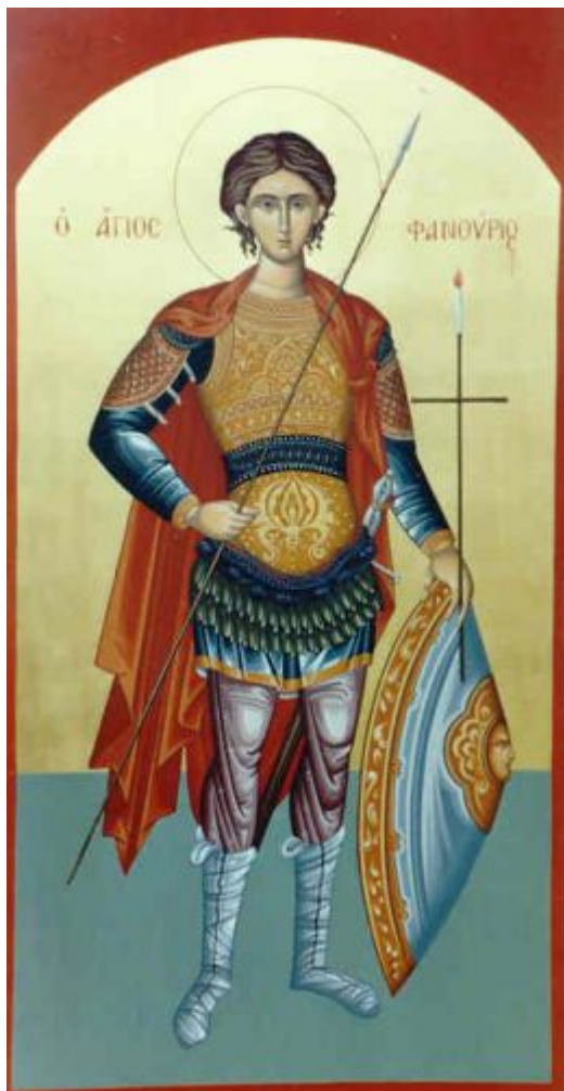
Άγιος Φανούριος ο Νεοφάνης, ο Μεγαλομάρτυρας