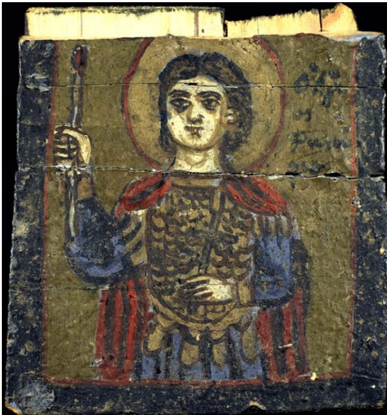
Άγιος Φανούριος ο Νεοφανής, ο Μεγαλομάρτυρας