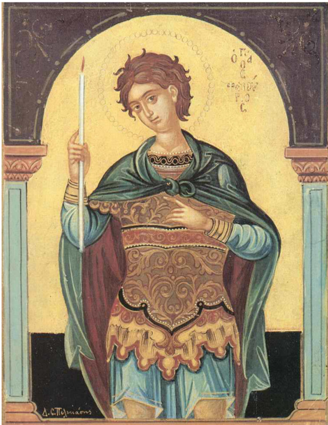
Άγιος Φανούριος ο Νεοφάνης, ο Μεγαλομάρτυρας