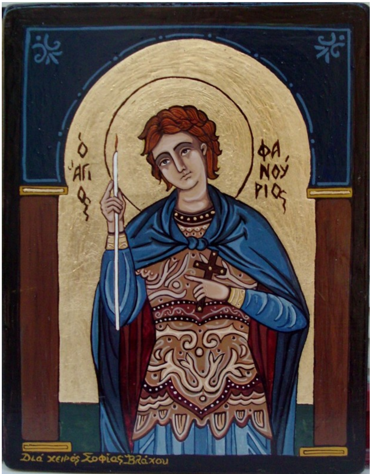
Άγιος Φανούριος ο Νεοφανής, ο Μεγαλομάρτυρας - Σοφία Βλάχου© (taergamou.blogspot.com)