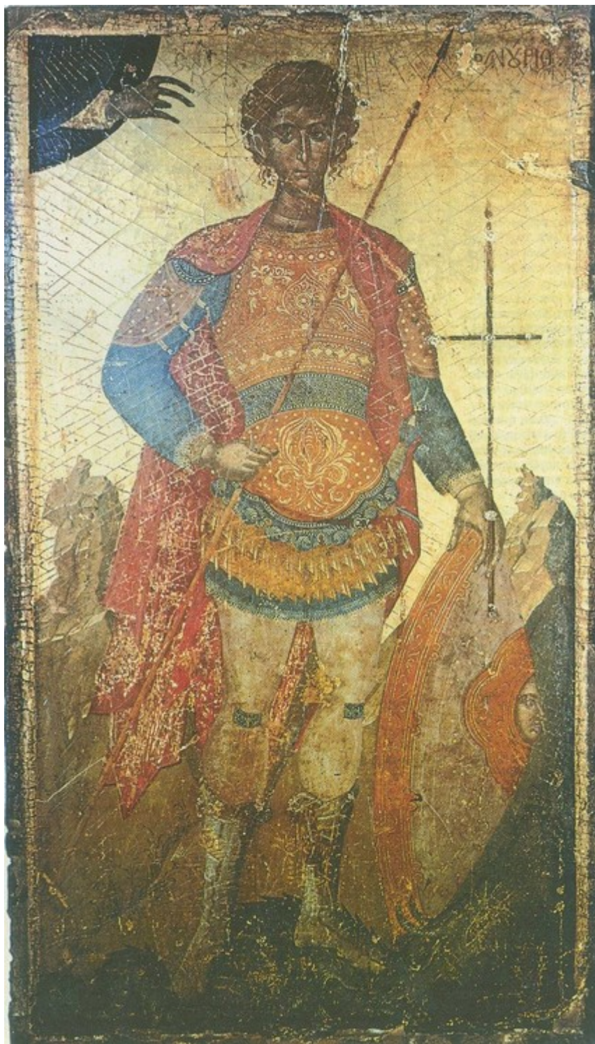
Άγιος Φανούριος ο Νεοφανής, ο Μεγαλομάρτυρας