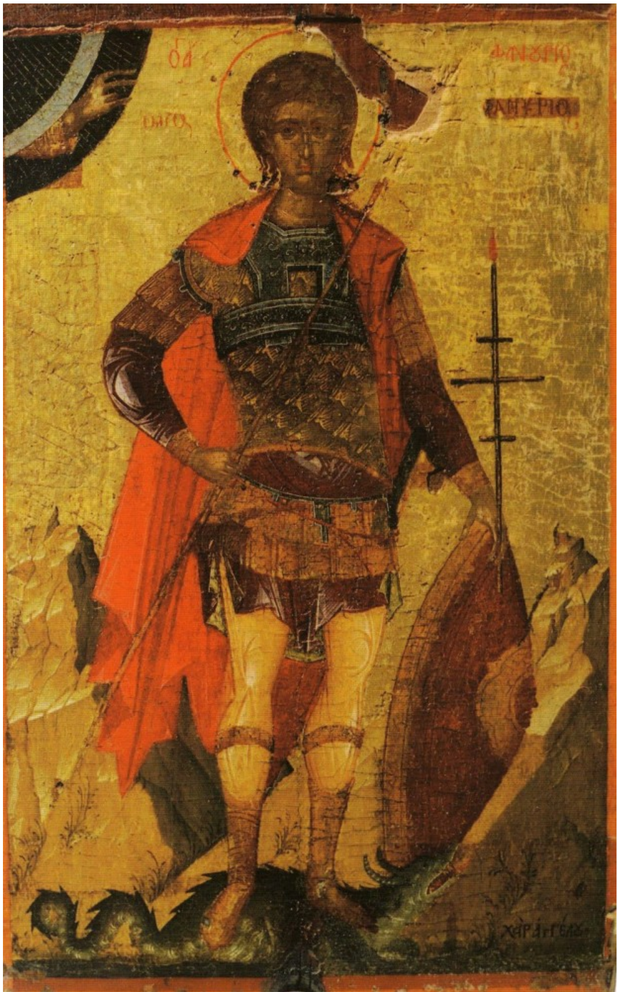
Άγιος Φανούριος ο Νεοφανής, ο Μεγαλομάρτυρας - Χειρ Αγγέλου (Άγγελος Ακοτάντος) 15ος αιώνας