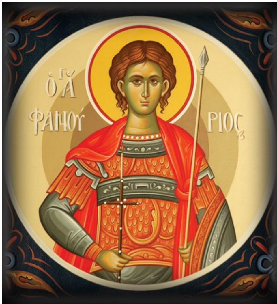
Άγιος Φανούριος ο Νεοφανής, ο Μεγαλομάρτυρας

Εορτάζει στις 27 Αυγούστου εκάστου έτους.