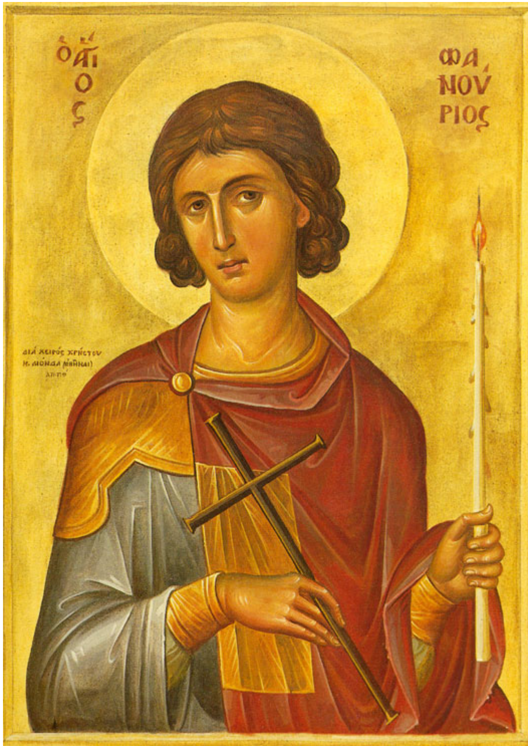
Άγιος Φανούριος ο Νεοφανής, ο Μεγαλομάρτυρας