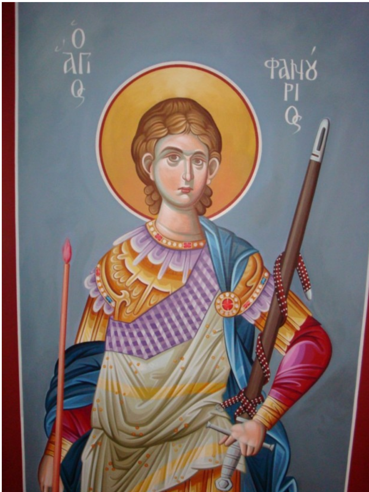
Άγιος Φανούριος ο Νεοφανής, ο Μεγαλομάρτυρας - Σταύρος Τωνας© (ctonas-agiografies.blogspot.com)