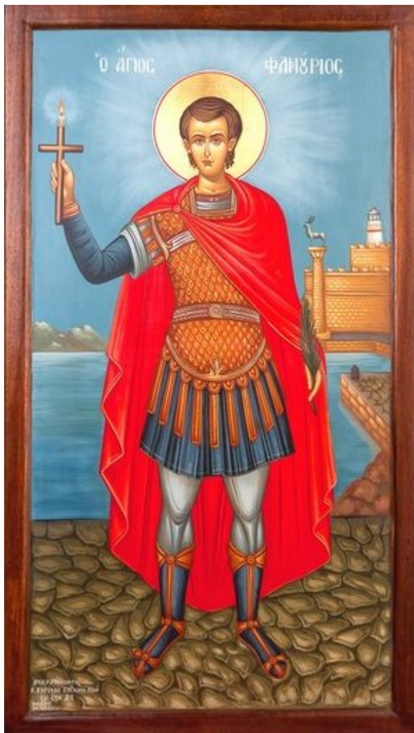
Άγιος Φανούριος ο Νεοφανής, ο Μεγαλομάρτυρας