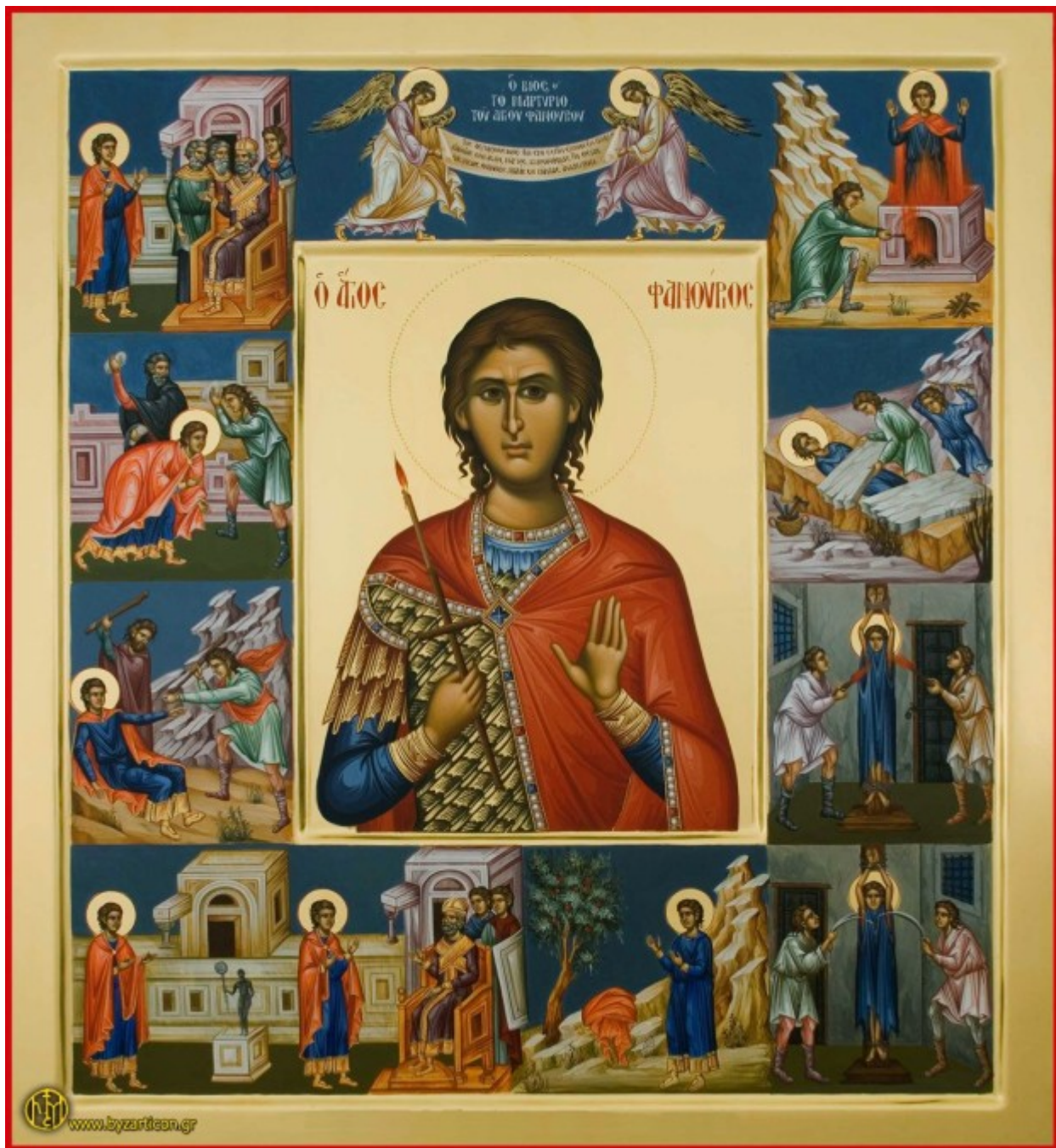
Άγιος Φανούριος ο Νεοφανής, ο Μεγαλομάρτυρας