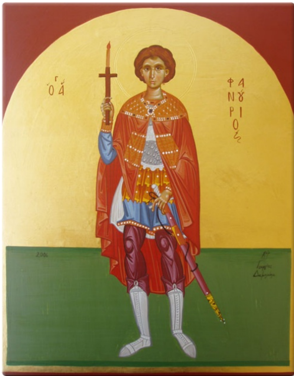
Άγιος Φανούριος ο Νεοφανής, ο Μεγαλομάρτυρας - Γεωργία Δαμικούκα© ( www.tempera.gr )