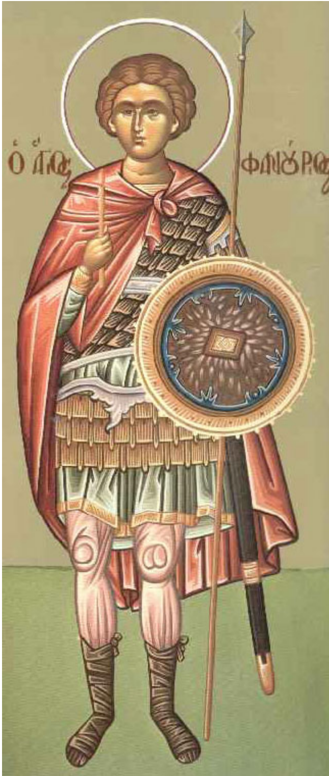
Άγιος Φανούριος ο Νεοφανής, ο Μεγαλομάρτυρας