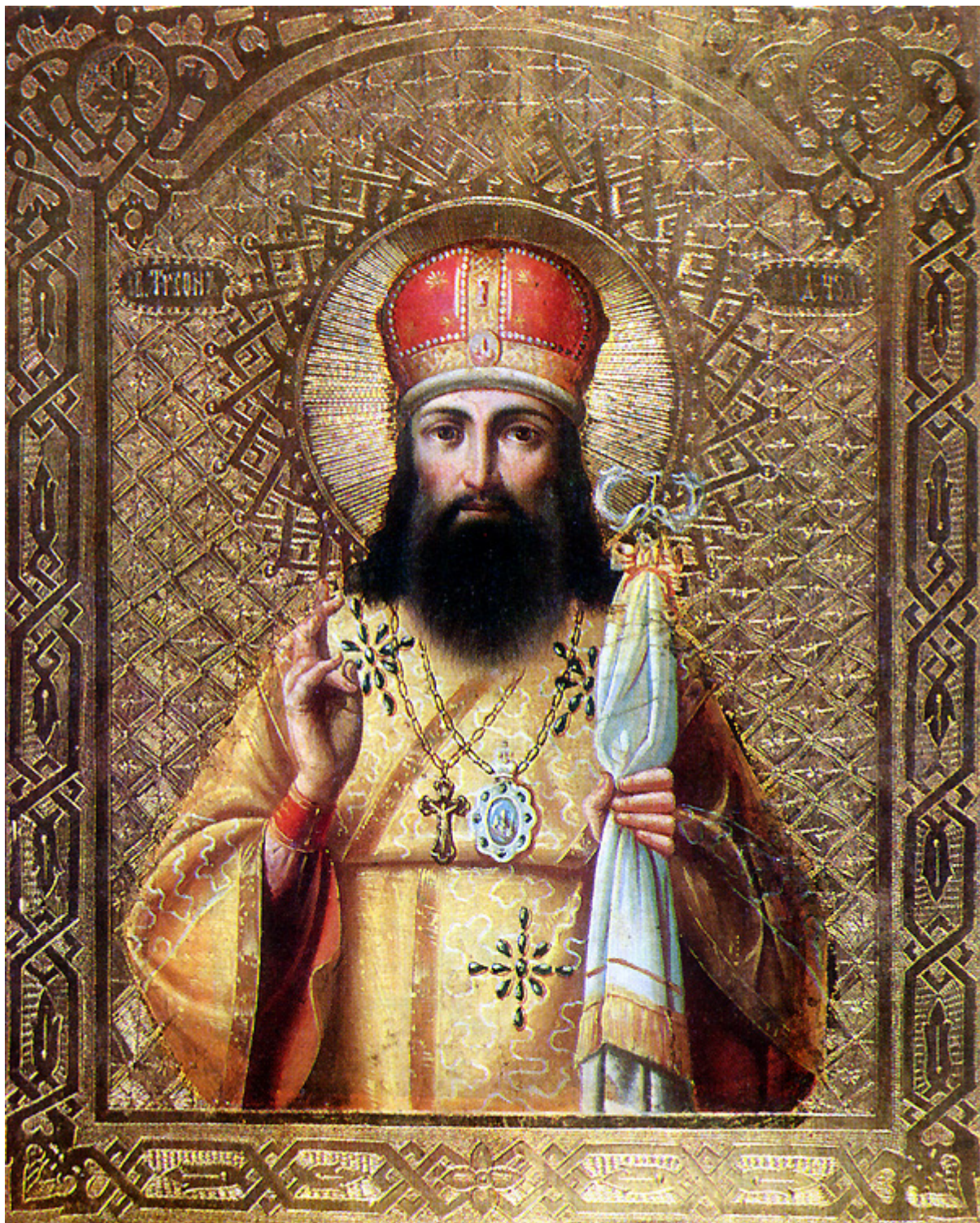
Άγιος Τύχων Επίσκοπος Ζαντόνσκ