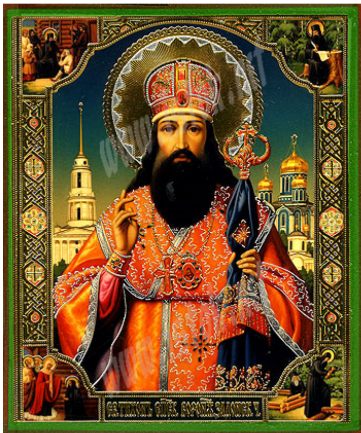
Άγιος Τύχων Επίσκοπος Ζαντόνσκ