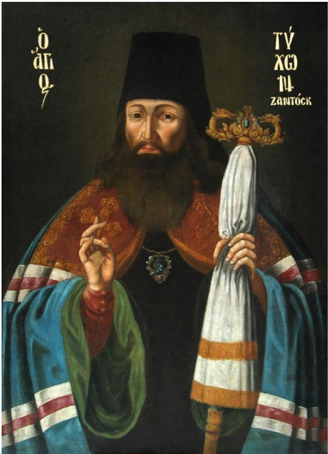
Άγιος Τύχων Επίσκοπος Ζαντόνσκ