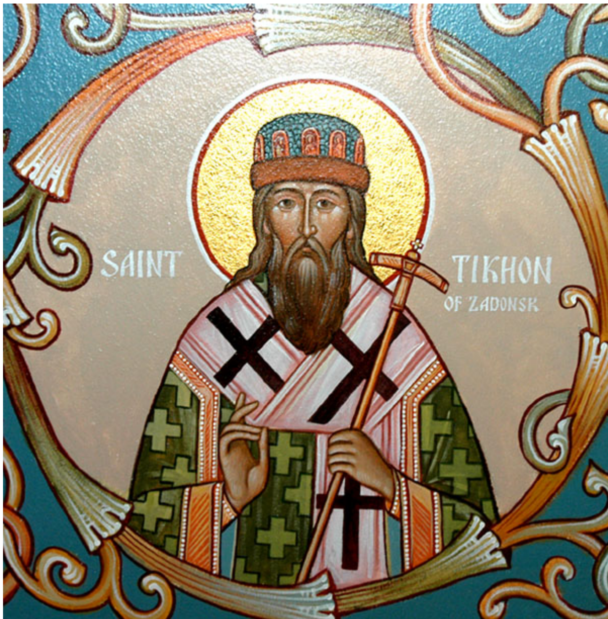
Άγιος Τύχων Επίσκοπος Ζαντόνσκ

Εορτάζει στις 13 Αυγούστου εκάστου έτους.