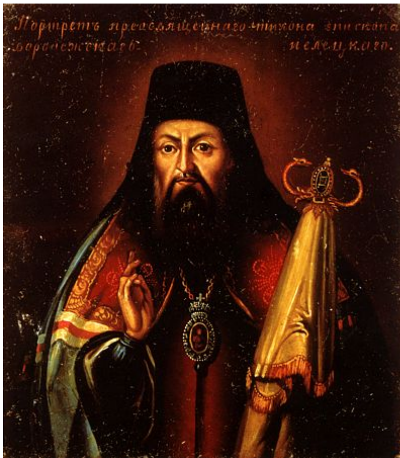
Άγιος Τύχων Επίσκοπος Ζαντόνσκ