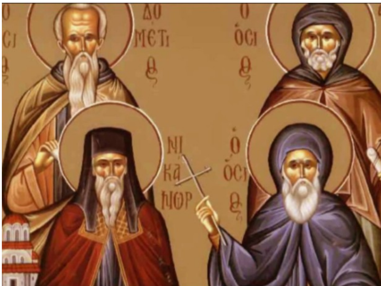
Άγιος Δομέτιος ο Πέρσης και οι δύο μαθητές του

Εορτάζει στις 7 Αυγούστου εκάστου έτους.