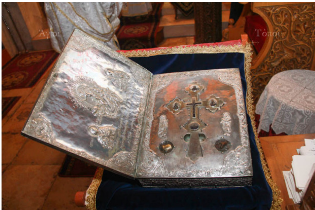
Τεμάχιο του ιερού λειψάνου του ιαματικού Παντελεήμονος