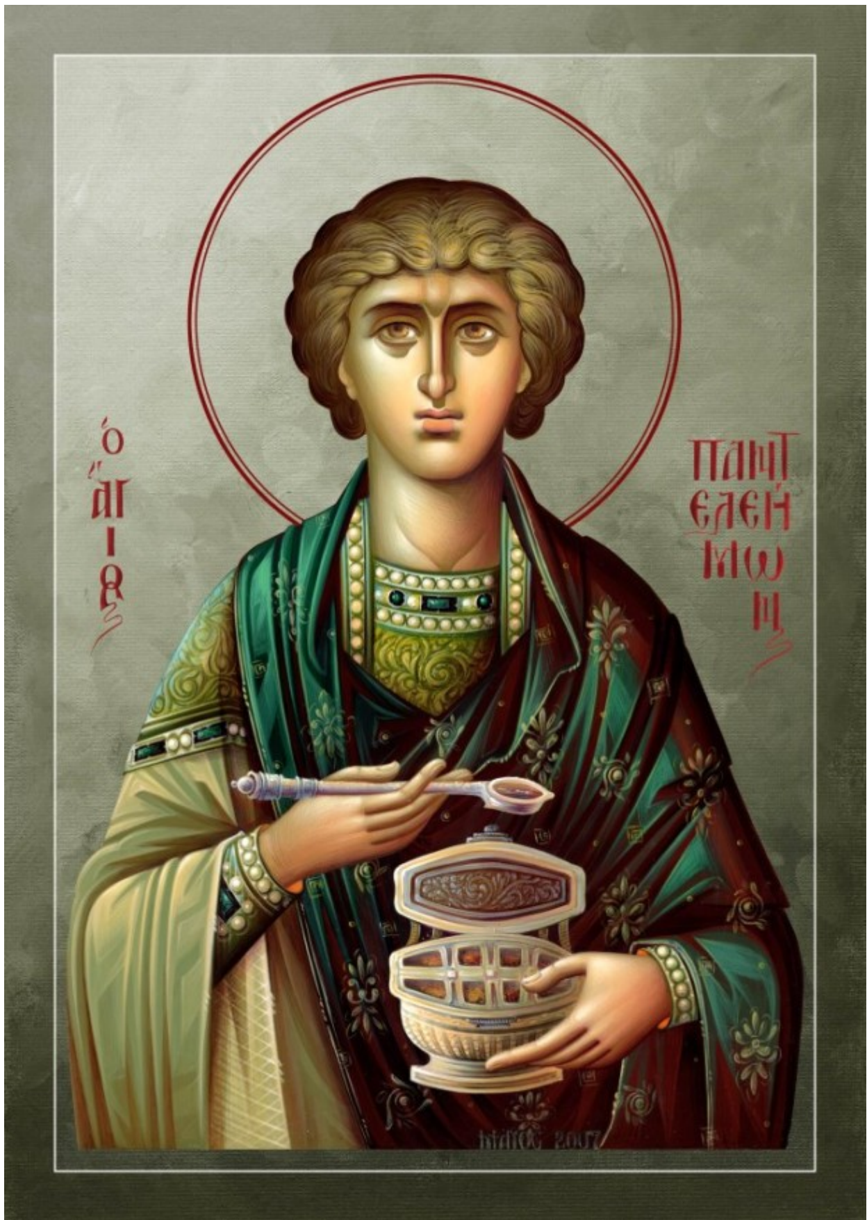
Άγιος Παντελεήμων ο Μεγαλομάρτυς και Ιαματικός