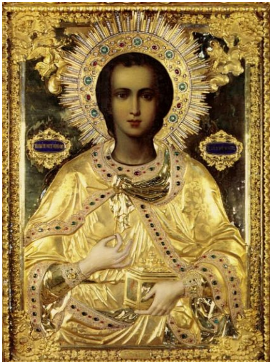
Άγιος Παντελεήμων ο Μεγαλομάρτυς και Ιαματικός