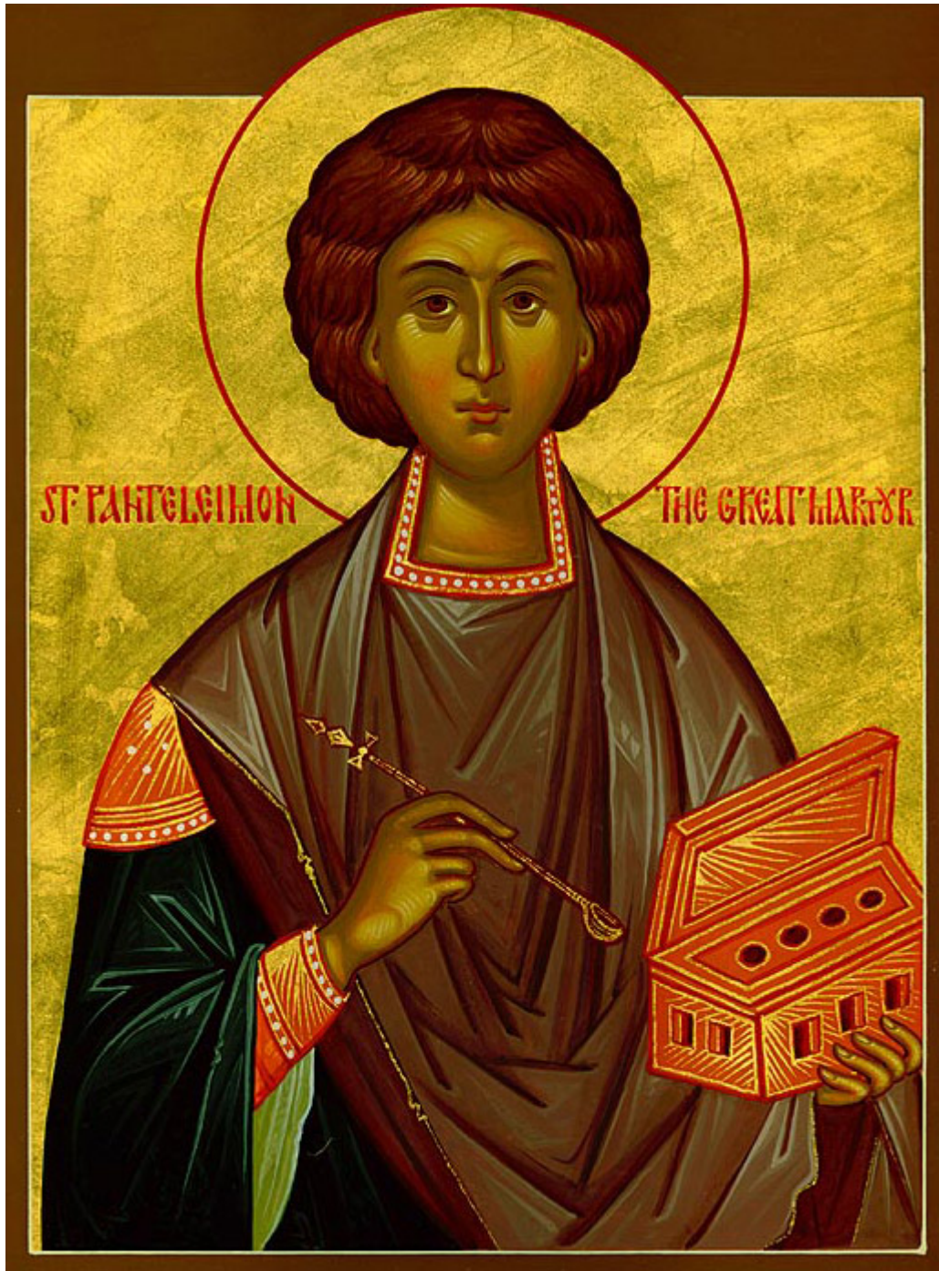
Άγιος Παντελεήμων ο Μεγαλομάρτυς και Ιαματικός