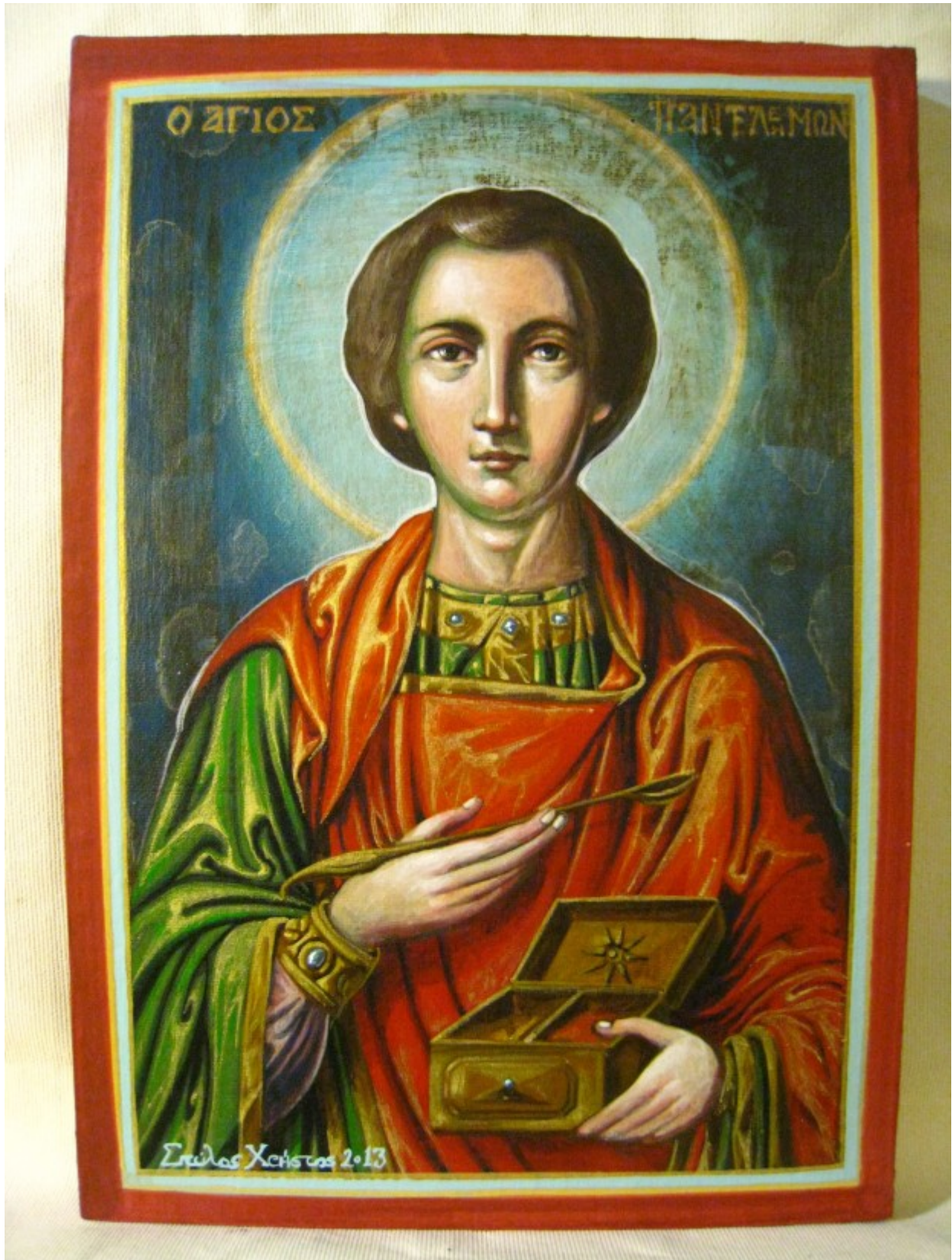
Άγιος Παντελεήμων ο Μεγαλομάρτυς και Ιαματικός - Χρῆστος Στύλος ©