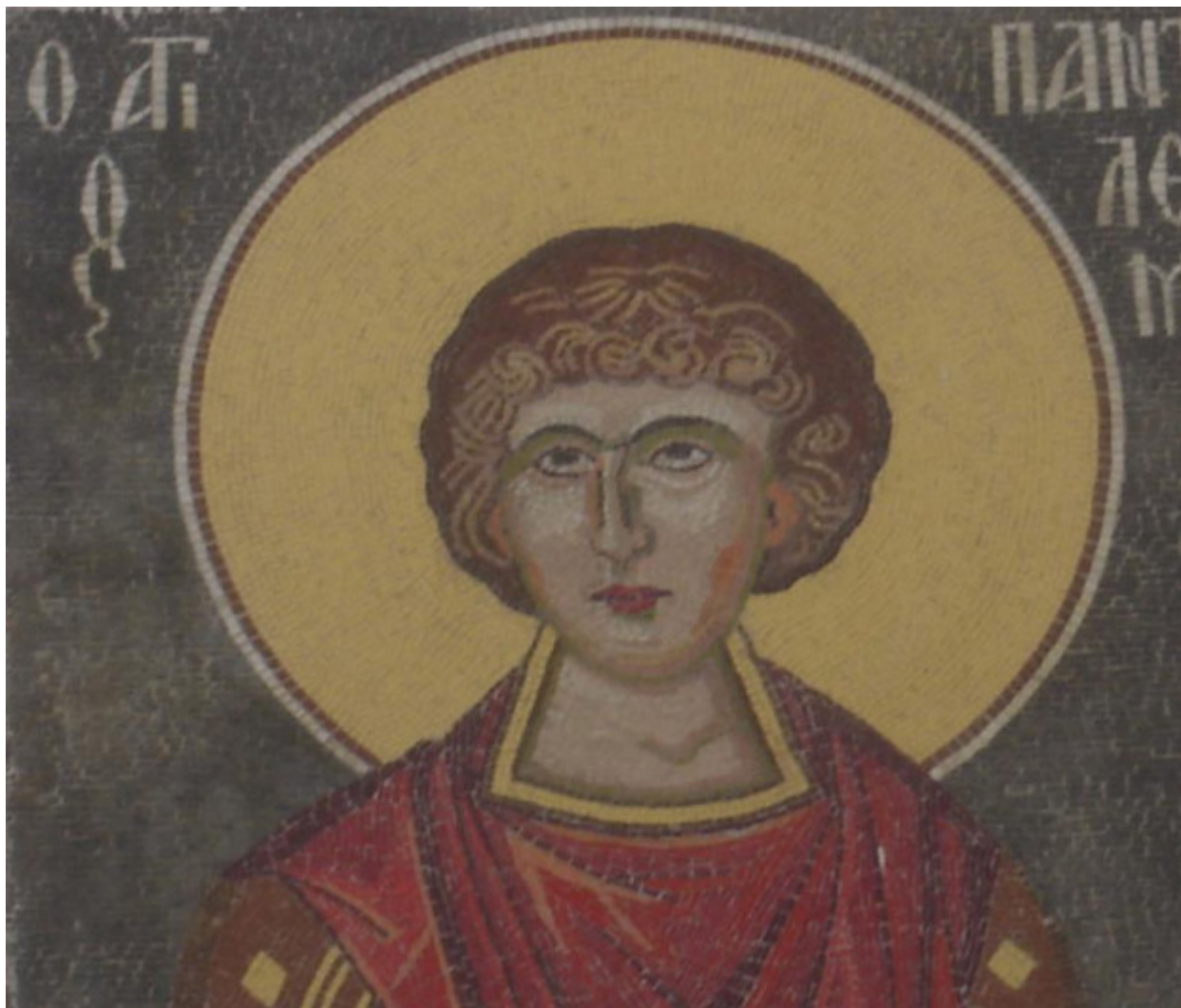
Άγιος Παντελεήμων ο Μεγαλομάρτυς και Ιαματικός