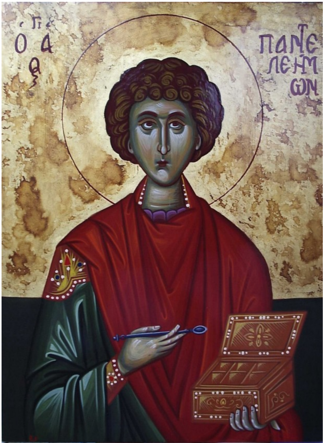
Άγιος Παντελεήμων ο Μεγαλομάρτυς και Ιαματικός