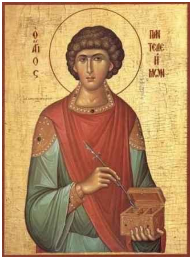
Άγιος Παντελεήμων ο Μεγαλομάρτυς και Ιαματικός