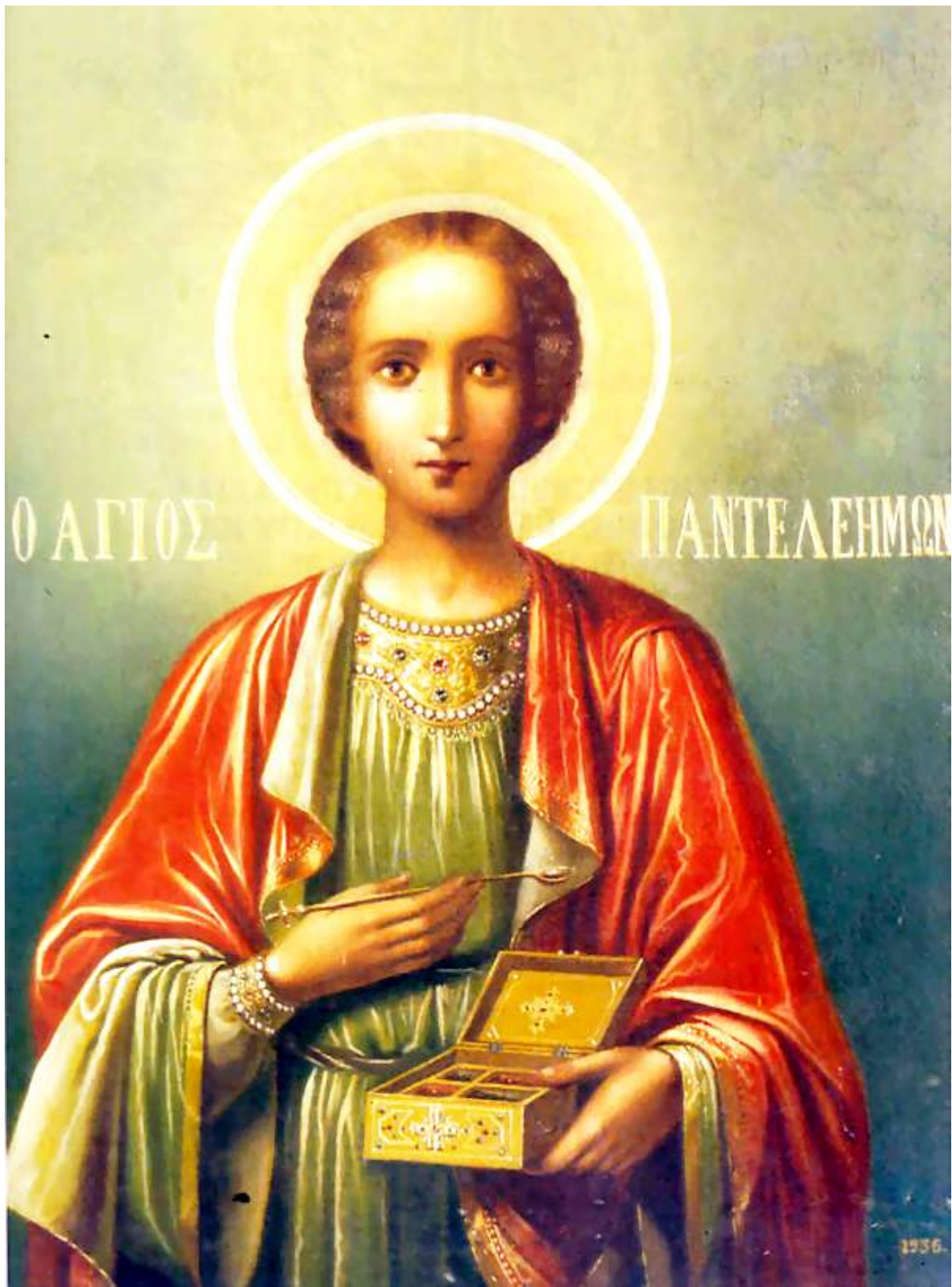
Άγιος Παντελεήμων ο Μεγαλομάρτυς και Ιαματικός