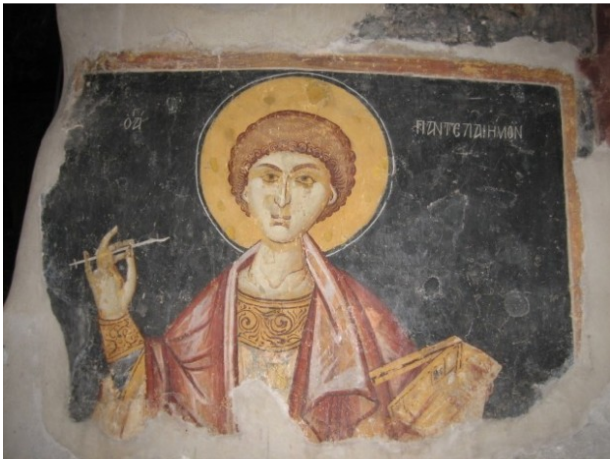
Άγιος Παντελεήμων ο Μεγαλομάρτυς και Ιαματικός