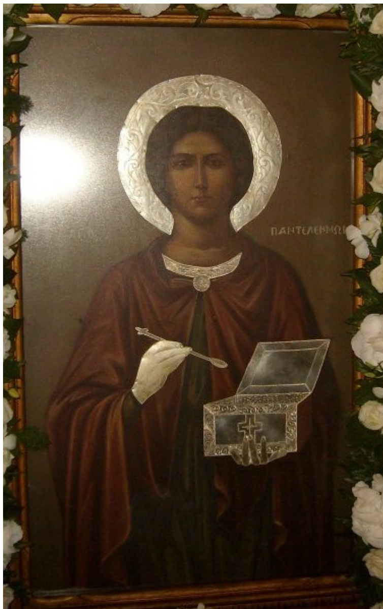
Άγιος Παντελεήμων ο Μεγαλομάρτυς και Ιαματικός