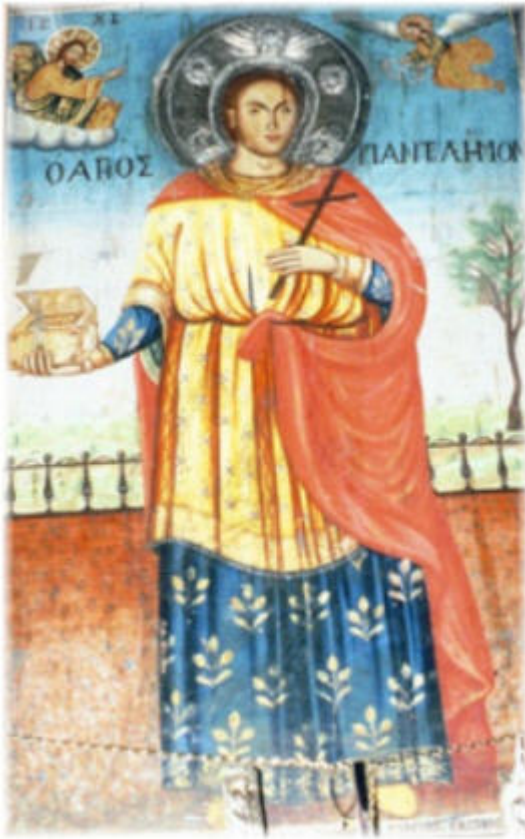
Άγιος Παντελεήμων ο Μεγαλομάρτυς και Ιαματικός