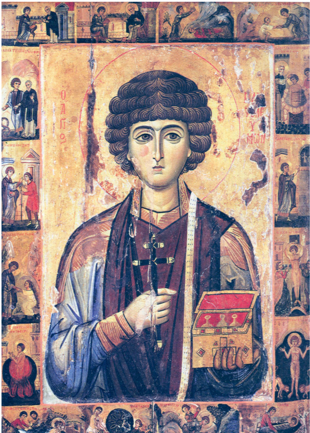
Άγιος Παντελεήμων ο Μεγαλομάρτυς και Ιαματικός