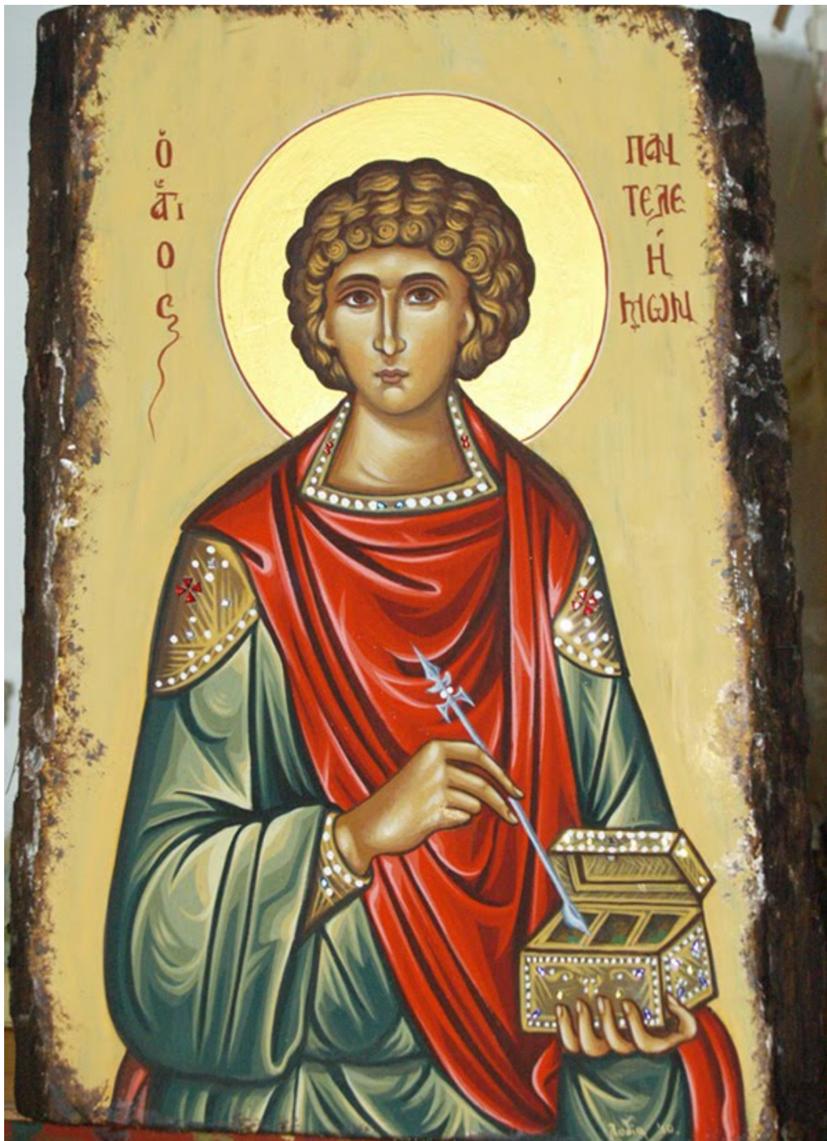
Άγιος Παντελεήμων ο Μεγαλομάρτυς και Ιαματικός - Λυδία Γουριώτη© (lydiagourioti- iconography.blogspot.gr)

Άγιος Παντελεήμων ο Μεγαλομάρτυς και Ιαματικός - www.zografiki.com©