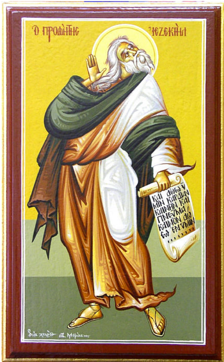
Προφήτης Ιεζεκιήλ - Δημήτριος Μιχαήλ Μεμάκης