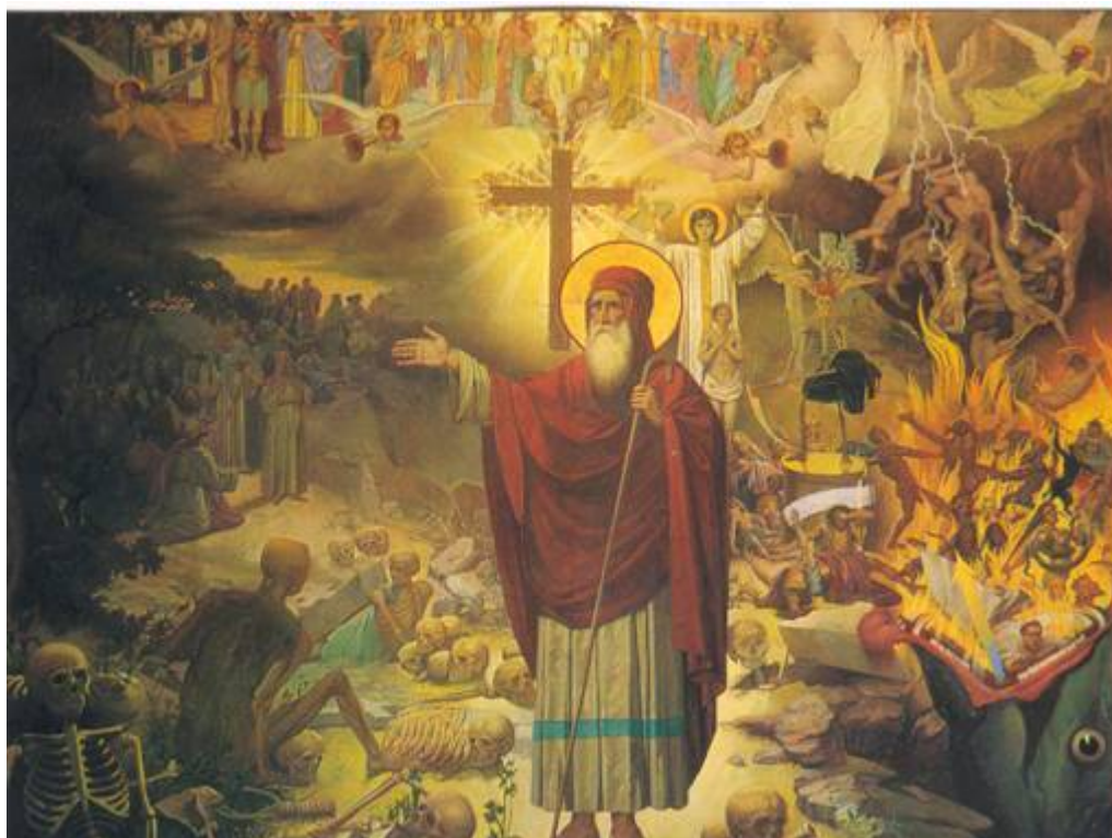
Τὸ Ὁραμα τοῦ Προφήτη Ἰεζεκιήλ