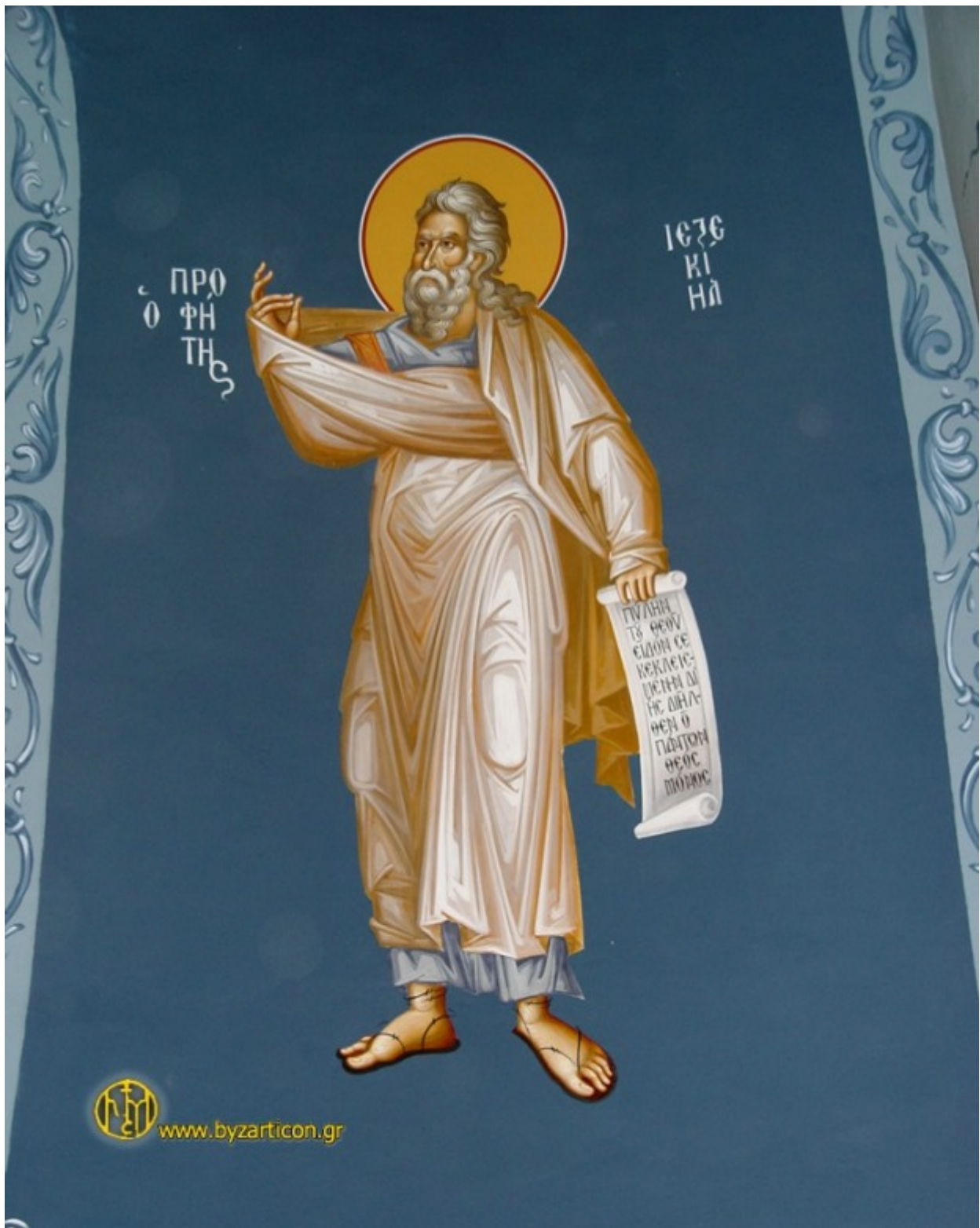
Προφήτης Ιεζεκιήλ - Μαρία Σιγάλα & Νικόλαος Σπανόπουλος