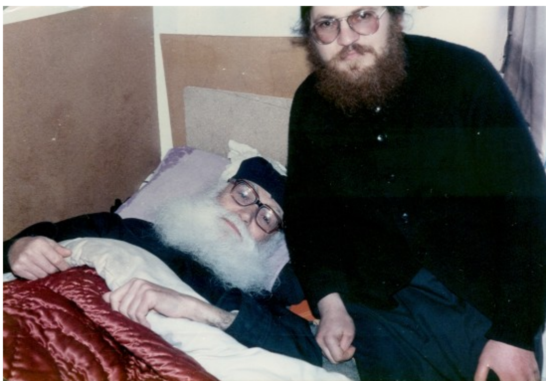
Ο Γέροντας Εφραίμ με τον σημερινό Καθηγούμενο της Ι.Μ.Μ.Βατοπαιδίου το 1985