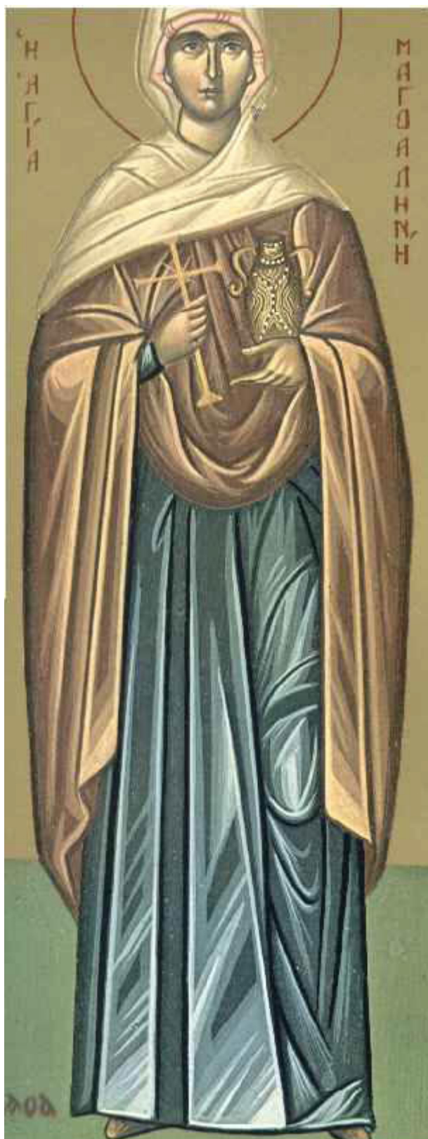
Αγία Μαρία η Μαγδαληνή η Μυροφόρος και Ισαπόστολος