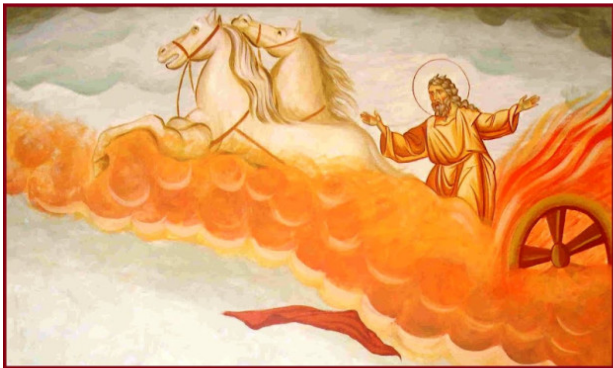
Προφήτης Ηλίας ο Θεσβίτης