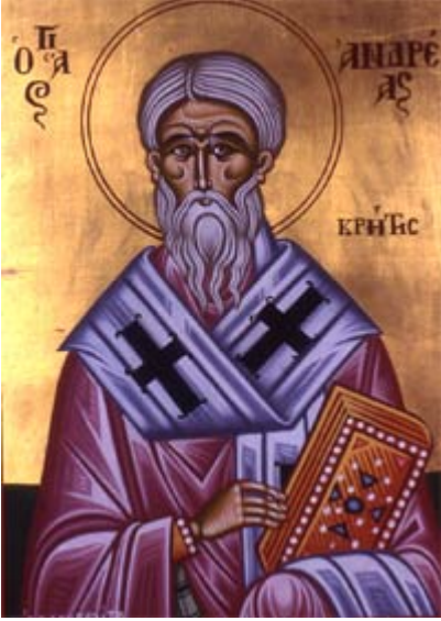
Άγιος Ανδρέας ο Ιεροσολυμίτης Αρχιεπίσκοπος Κρήτης

Κουδουμά, δια χειρός Παναγιώτη Μόσχου (2006)