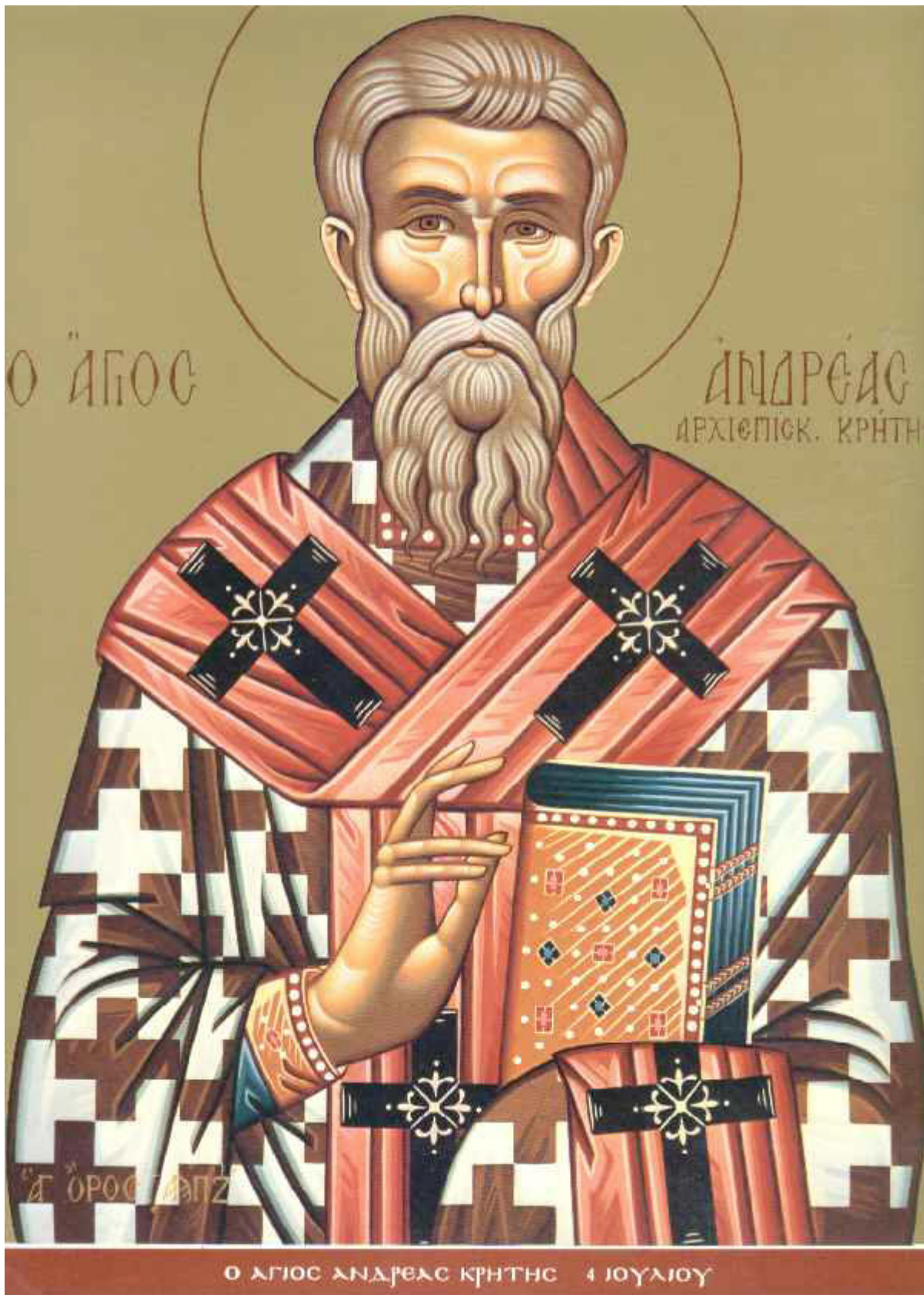
Άγιος Ανδρέας ο Ιεροσολυμίτης Αρχιεπίσκοπος Κρήτης