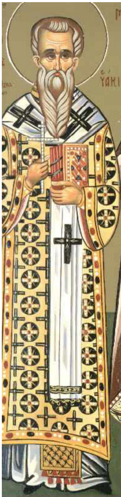
Άγιος Ανατόλιος Πατριάρχης Κωνσταντινούπολης