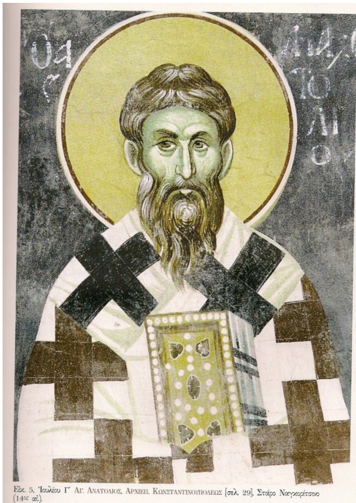
Εξ. 5, 'Ιουλίου Γ' ΑΓ. ΑΝΑΤΟΛΙΟΣ, ΑΡΧΙΕΠ. ΚΩΝΣΤΑΝΤΙΝΟΥΠΟΛΕΩΣ [σελ. 29], Στάρο Ναγκορτίσκινο (14ος αι.).