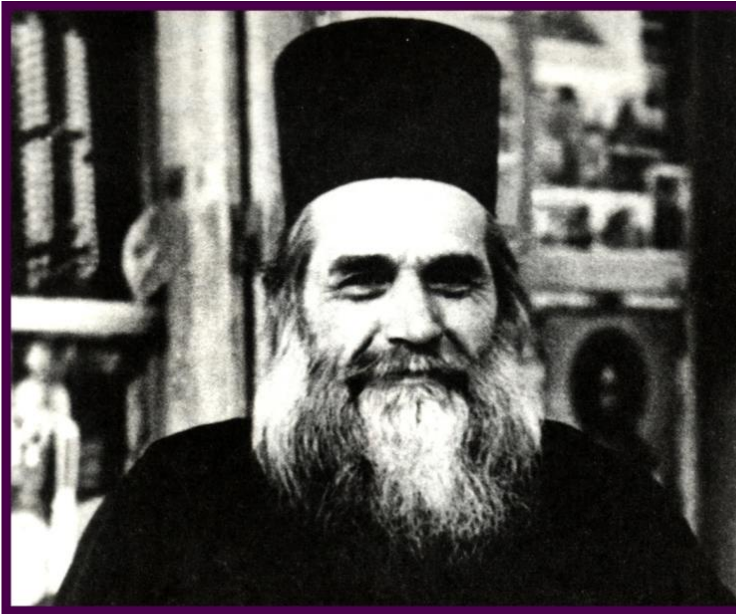
Ο σπουδαίος Πνευματικός παπα-Αρτέμιος