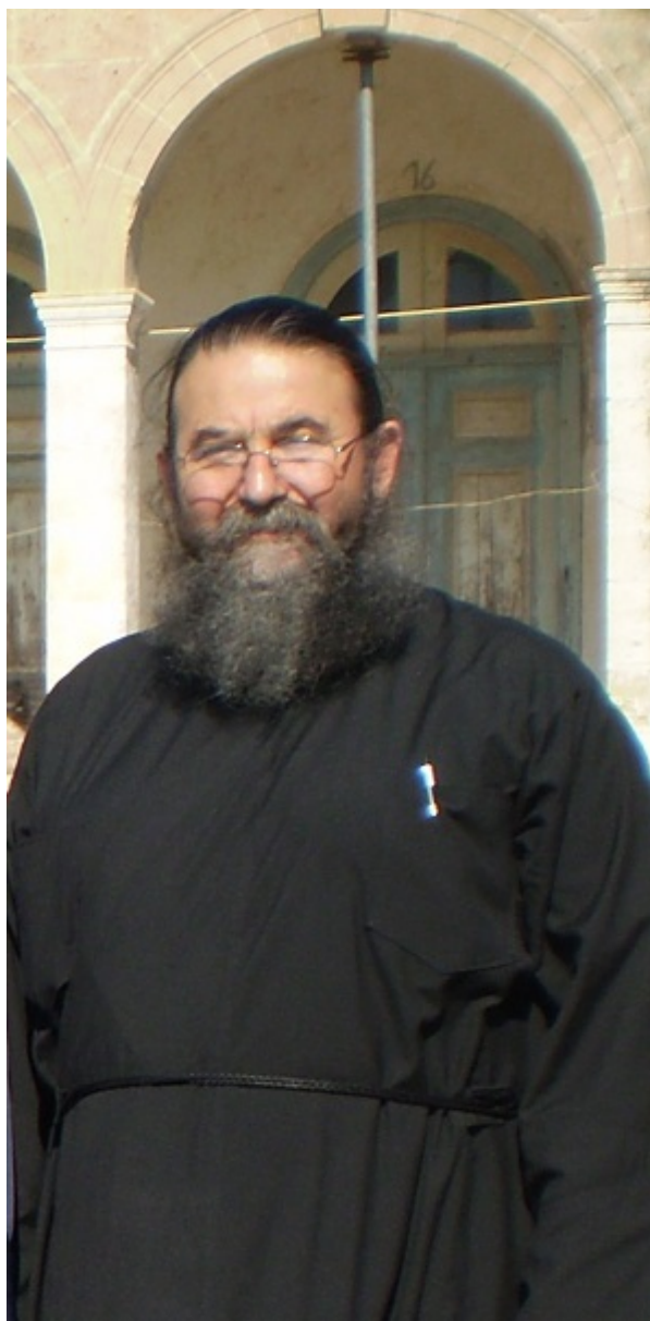
OLYMPUS DIGITAL CAMERA

Αν απαριθμήσουμε τις αρετές του καθενός, μπορεί να φαίνονται ακατόρθωτες για μας που παραπαίουμε με τα πάνω και τα κάτω μας, αισθανόμενοι την αδυναμία μας να πάμε λίγο πιο πέρα. Ο πόνος όμως που γνώρισαν και άντεξαν μπορεί να γίνει κίνητρο εμπιστοσύνης στο Θεό που το επιτρέπει και μέσο υπομονής για το δικό μας μικρό ή μεγάλο πόνο.