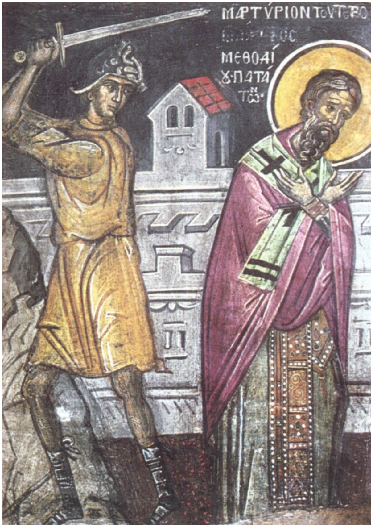
Άγιος Μεθόδιος ο Ιερομάρτυρας επίσκοπος Πατάρων