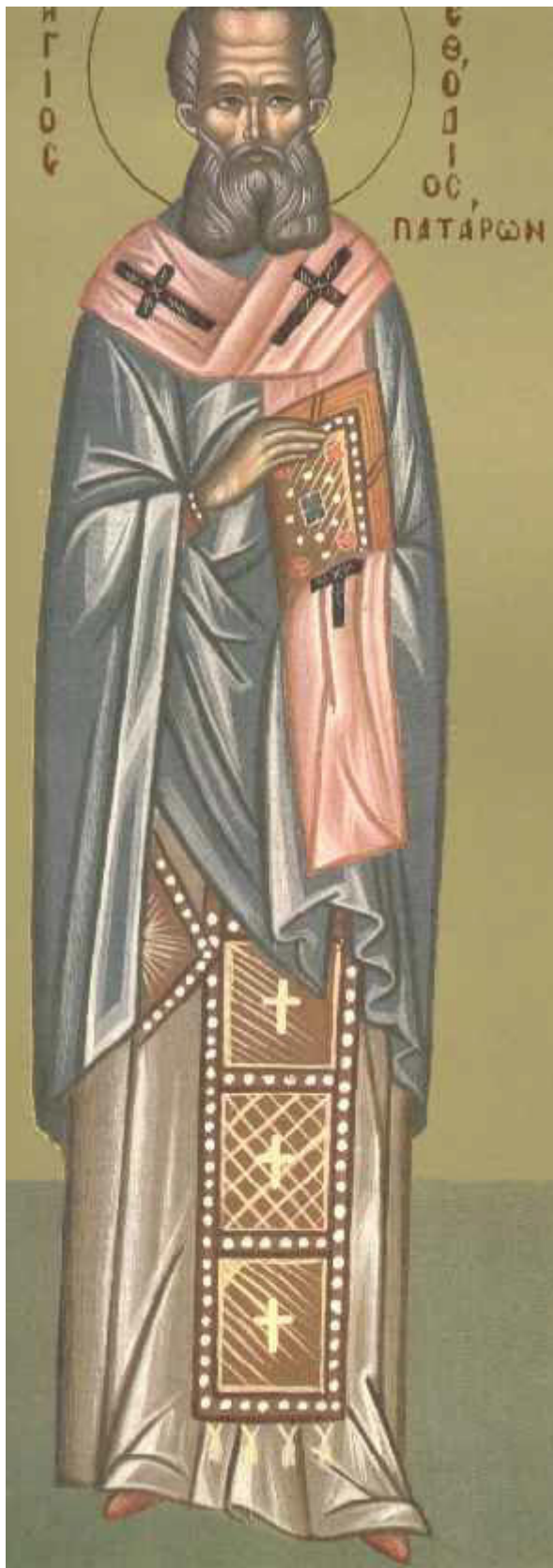
Άγιος Μεθόδιος ο Ιερομάρτυρας επίσκοπος Πατάρων