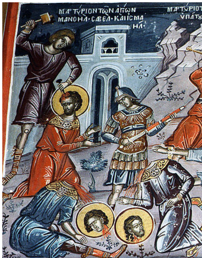
Ἅγιοι Μανουήλ, Σαβέλ και Ισμαήλ