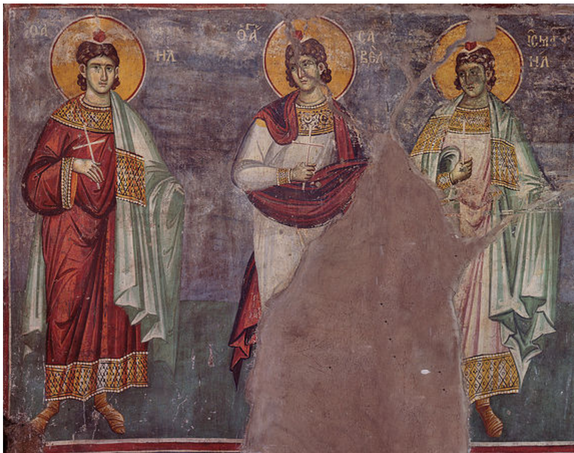
Άγιοι Μανουήλ, Σαβέλ και Ισμαήλ