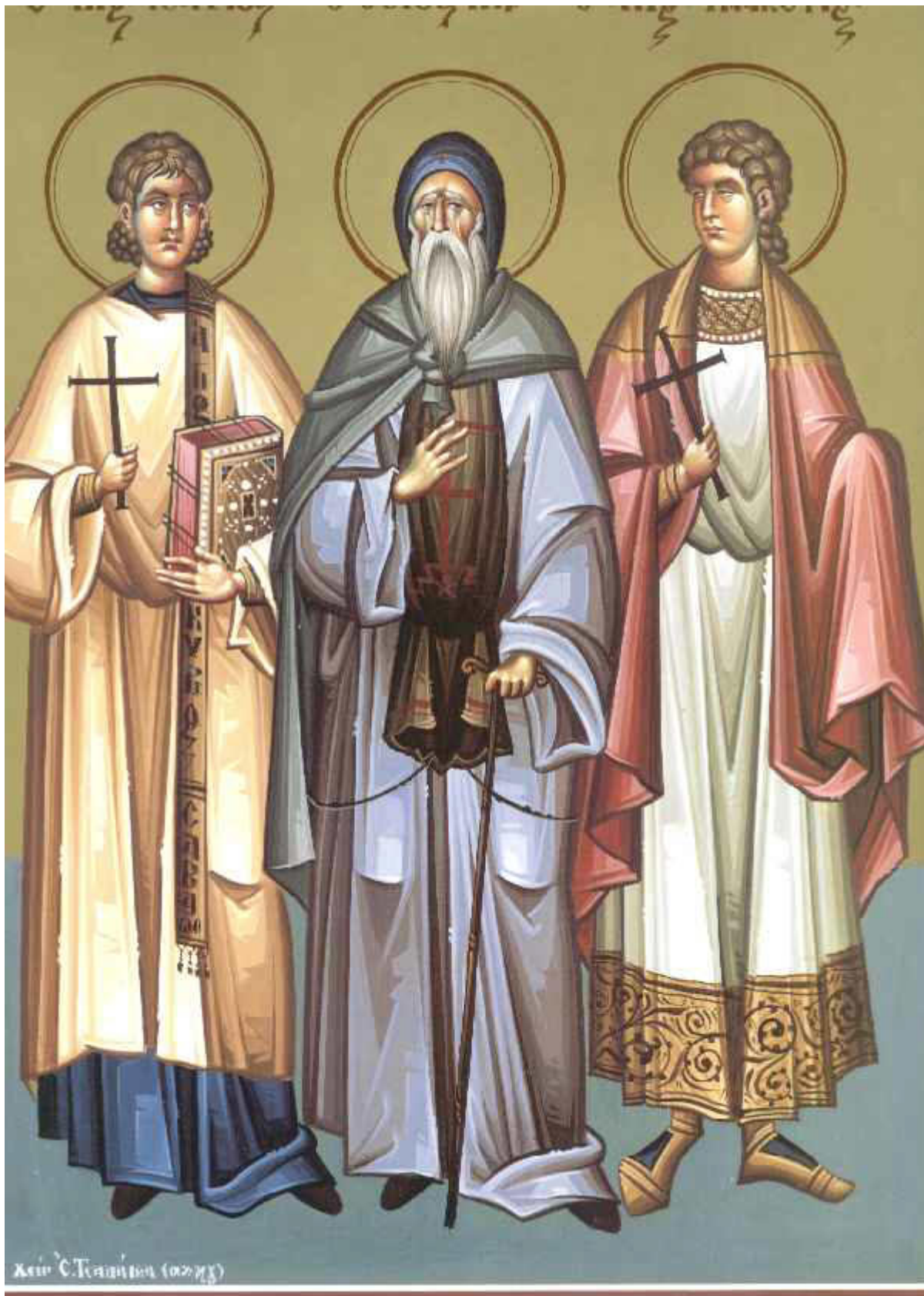
Ἅγιοι Μανουήλ, Σαβέλ και Ισμαήλ