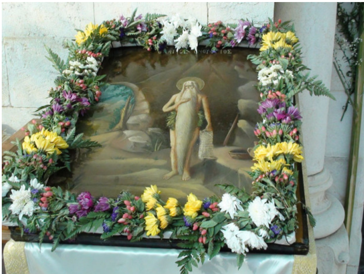
Όσιος Ονούφριος ο Αιγύπτιος (Ι.Μ. Αγίου Ονουφρίου στην Ιερουσαλήμ)