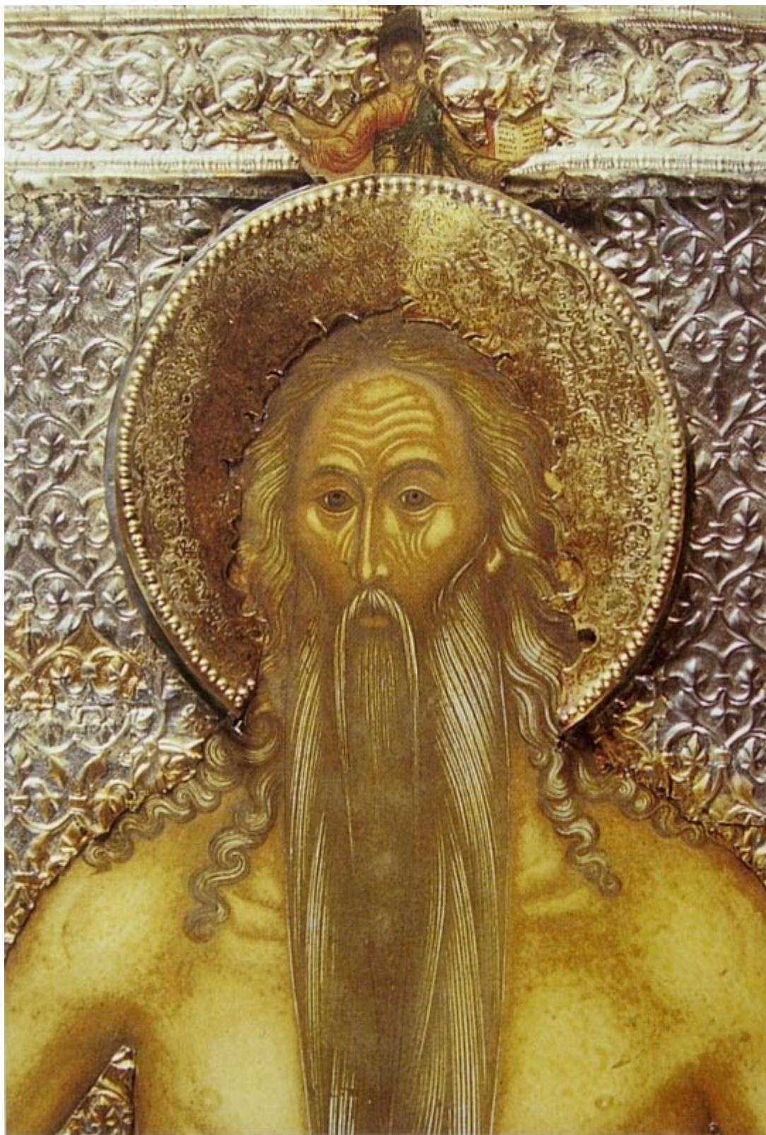
Όσιος Ονούφριος ο Αιγύπτιος