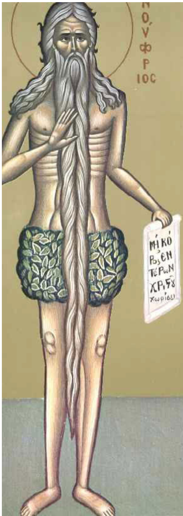
Όσιος Ονούφριος ο Αιγύπτιος