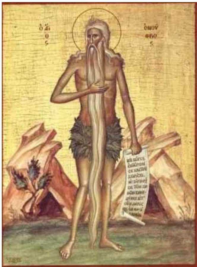
Όσιος Ονούφριος ο Αιγύπτιος