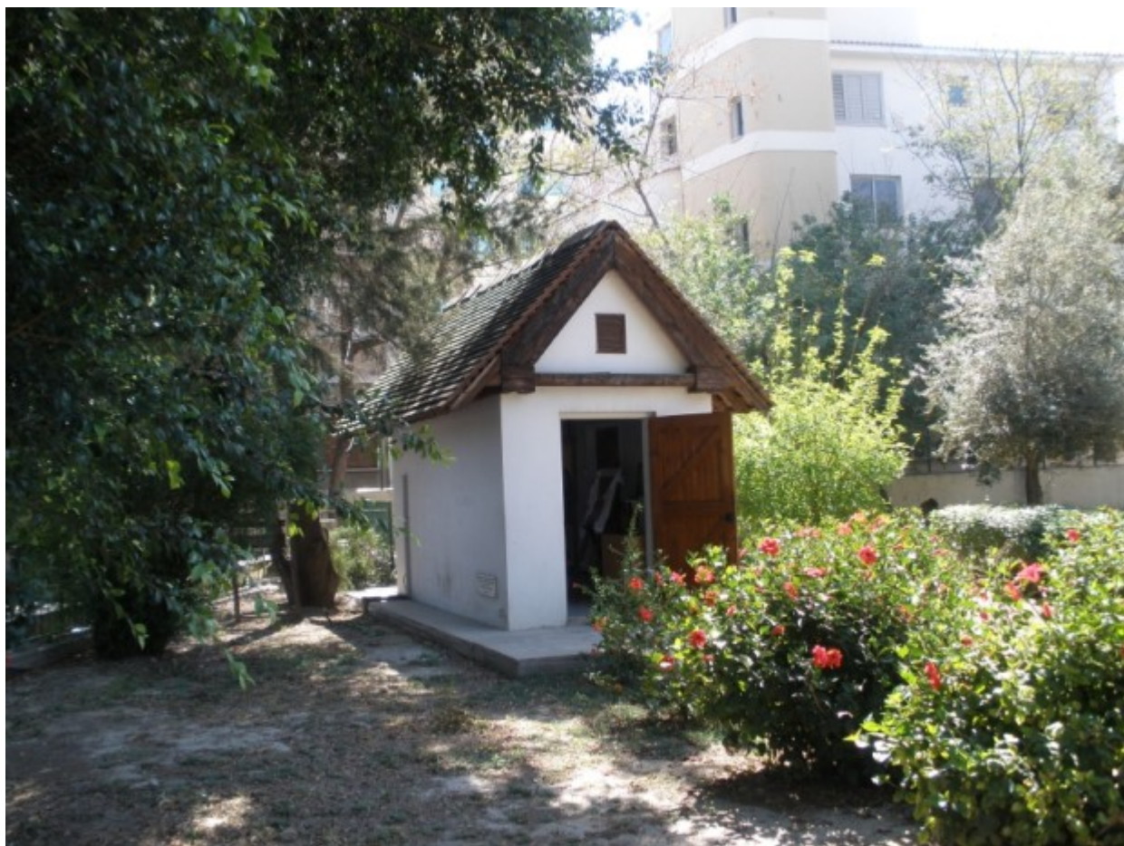
Ο μοναδικός ναός που αφιερωμένος στον Άγιο Τριφύλλιο πρώτο Επίσκοπο της Λευκωσίας στην αυλή του Δημοτικού Σχολείου Ελένειον

Ο μοναδικός ναός, σήμερα, σε όλη την Κύπρο, ο οποίος είναι αφιερωμένος στον πολιούχο και πρώτο Επίσκοπο της Λευκωσίας, είναι το μικρό παρεκκλήσι στην αυλή του Δημοτικού Σχολείου Ελένειον.