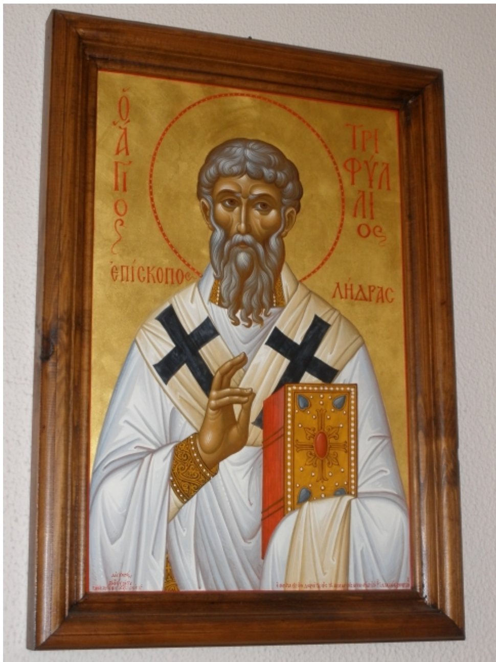
Άγιος Τριφύλλιος Επίσκοπος Λήδρας