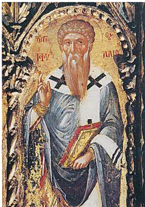
Άγιος Τριφύλλιος Επίσκοπος Λήδρας