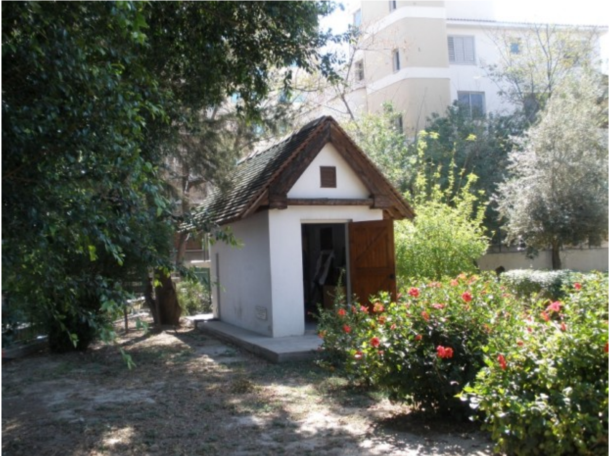
Ο μοναδικός ναός που αφιερωμένος στον Άγιο Τριφύλλιο πρώτο Επίσκοπο της Λευκωσίας στην αυλή του Δημοτικού Σχολείου Ελένειον

Ο μοναδικός ναός, σήμερα, σε όλη την Κύπρο, ο οποίος είναι αφιερωμένος στον πολιούχο και πρώτο Επίσκοπο της Λευκωσίας, είναι το μικρό παρεκκλήσι στην αυλή του Δημοτικού Σχολείου Ελένειον.