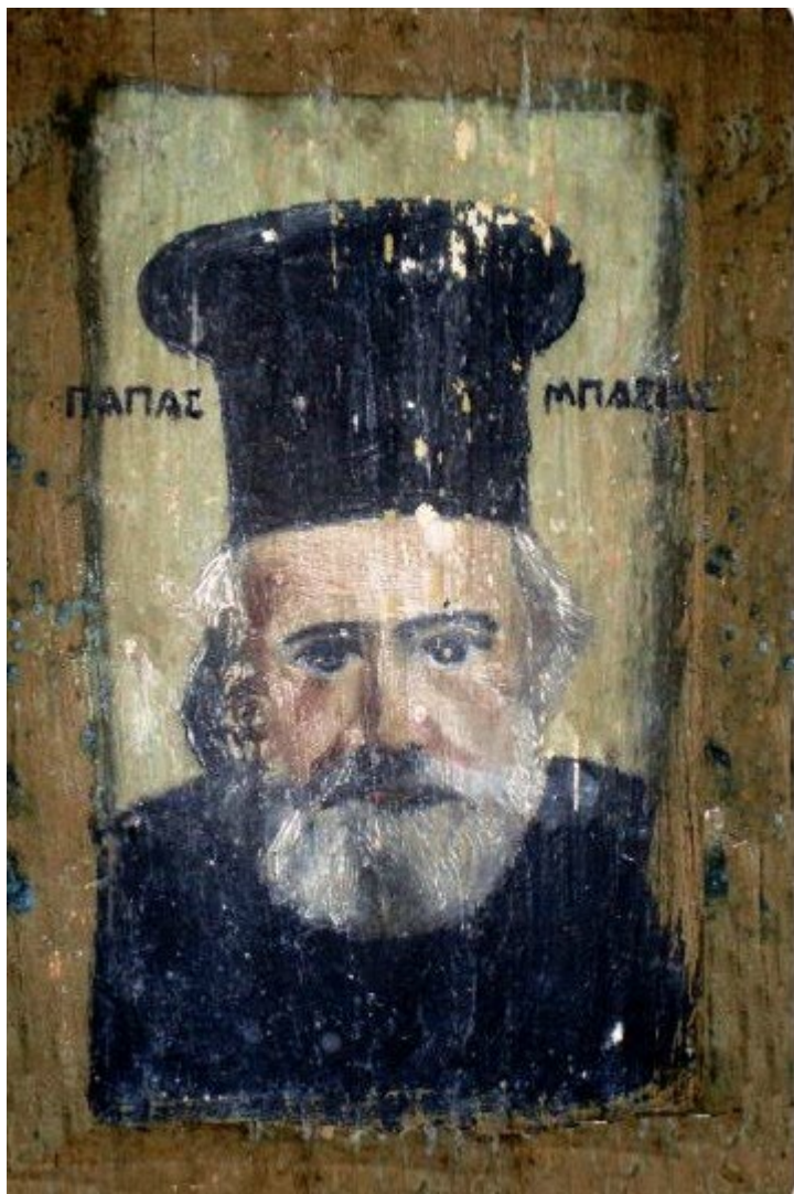
Όσιος Παναγής Μπασιάς (Παΐσιος)