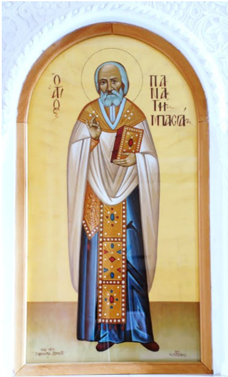
Όσιος Παναγής Μπασιάς (Παΐσιος)