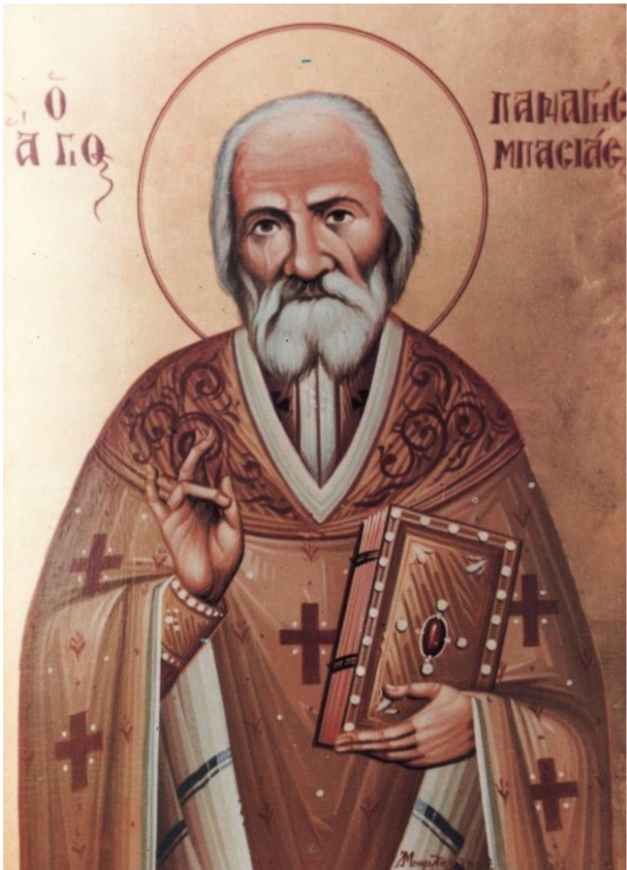
Όσιος Παναγής Μπασιάς (Πάϊσιος)