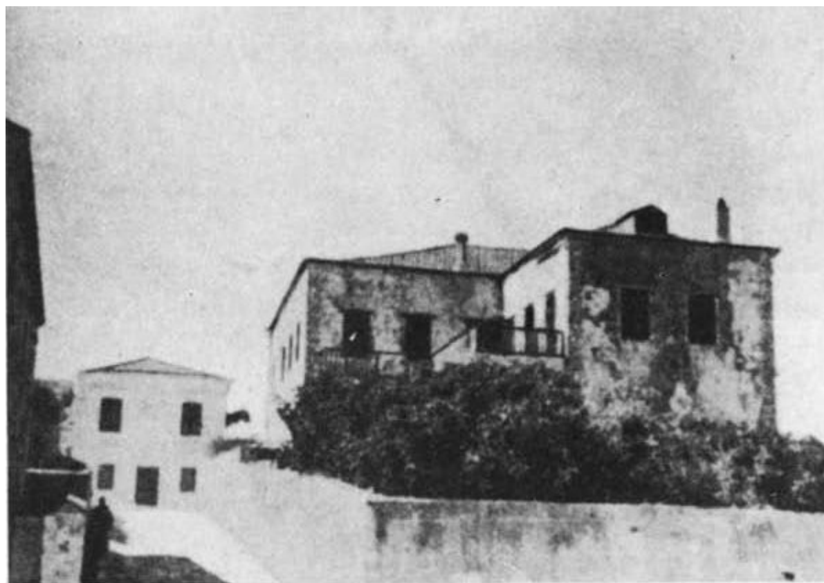
Οικία Γερουλάνου όπου διέμενε ο "Άγιος. (Προσεισμική φωτογραφία)