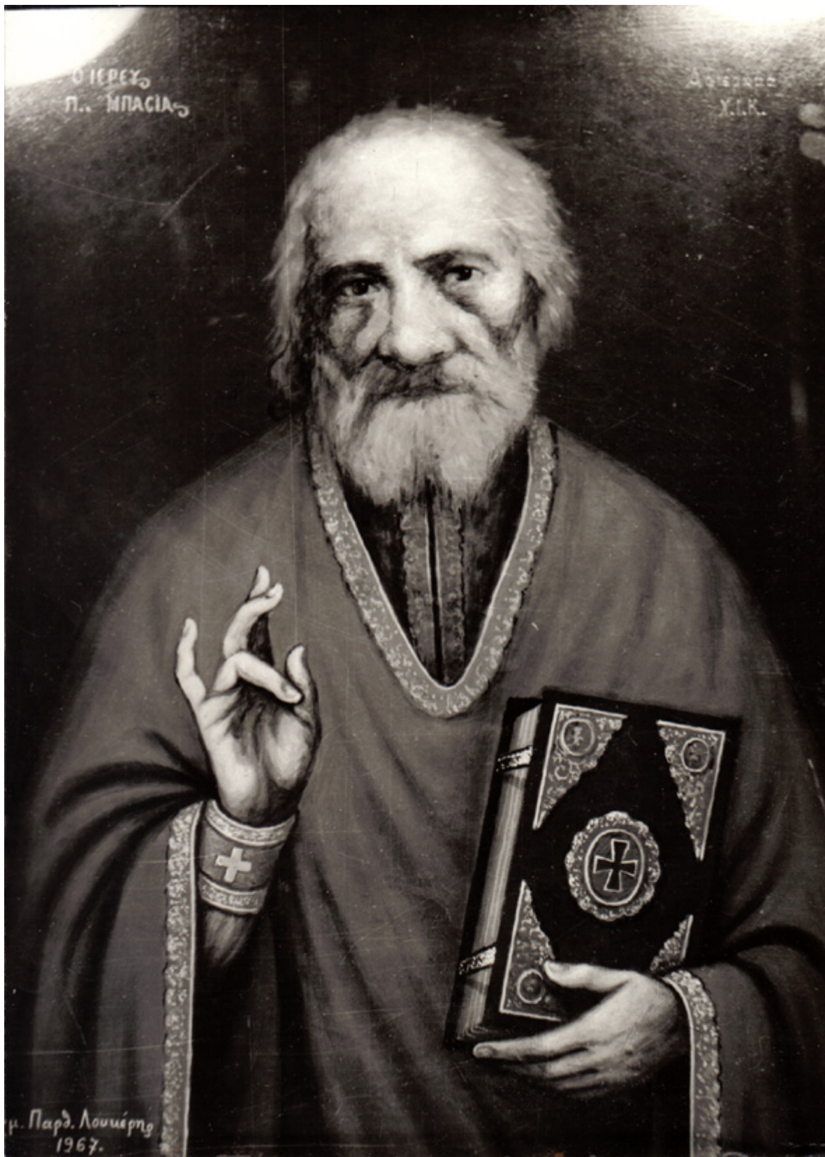
Όσιος Παναγής Μπασιάς (Παΐσιος)