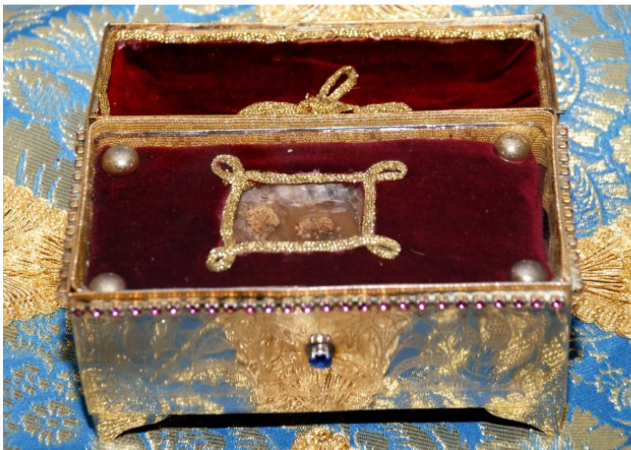
Η λειψανοθήκη του Οσίου Παναγή Μπασιά