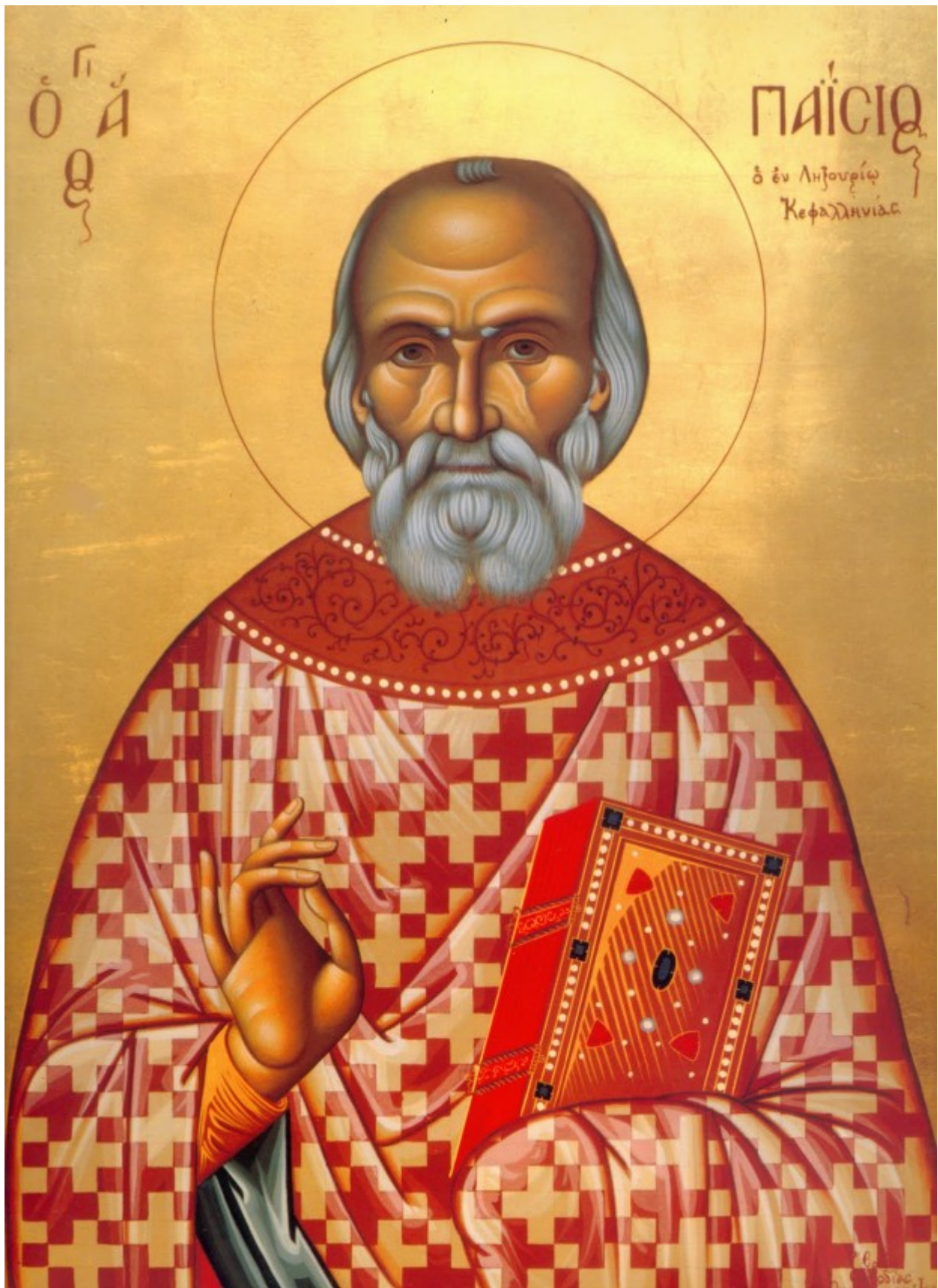
Όσιος Παναγής Μπασιάς (Πάϊσιος)