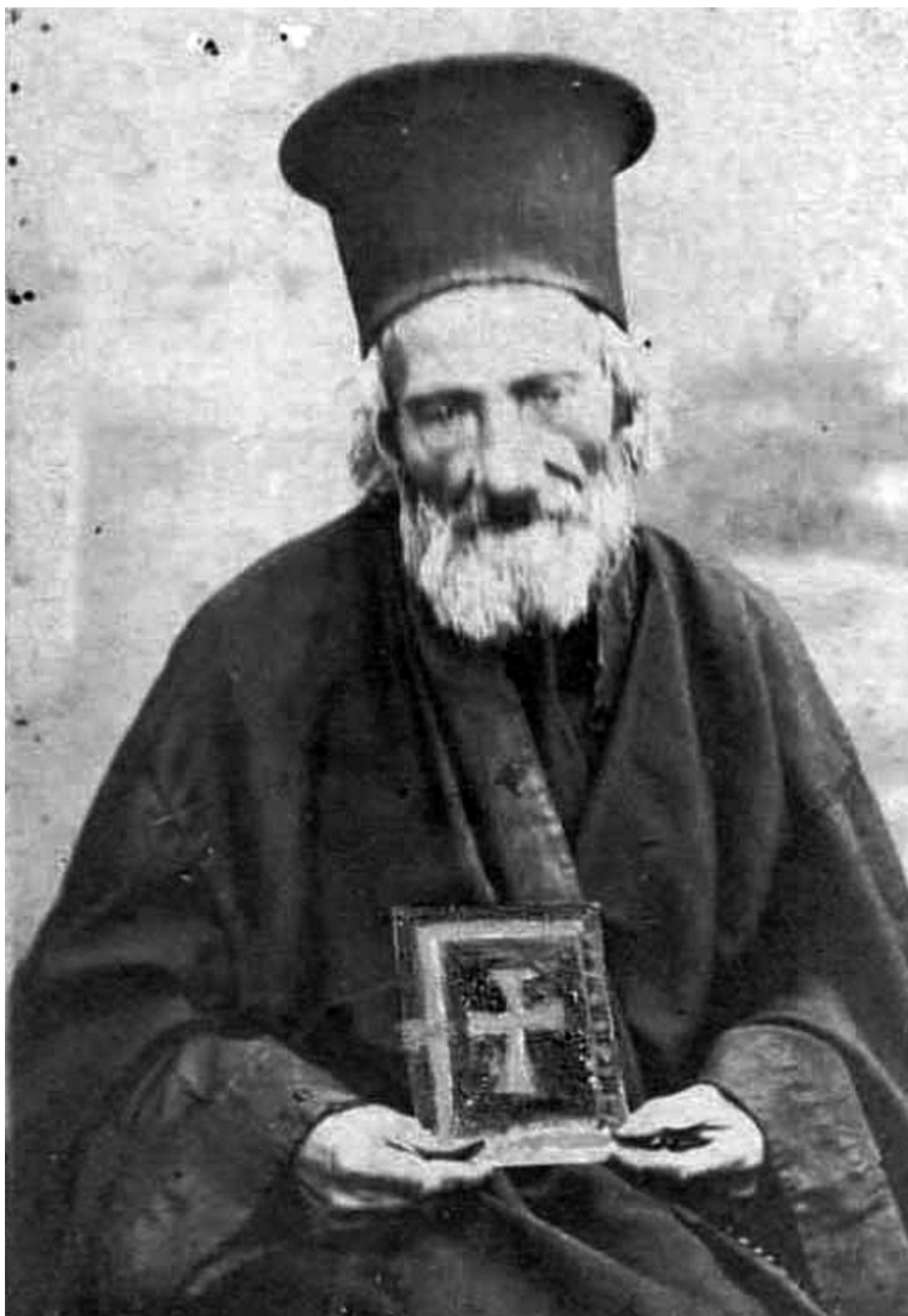
Όσιος Παναγής Μπασιάς (Παΐσιος)