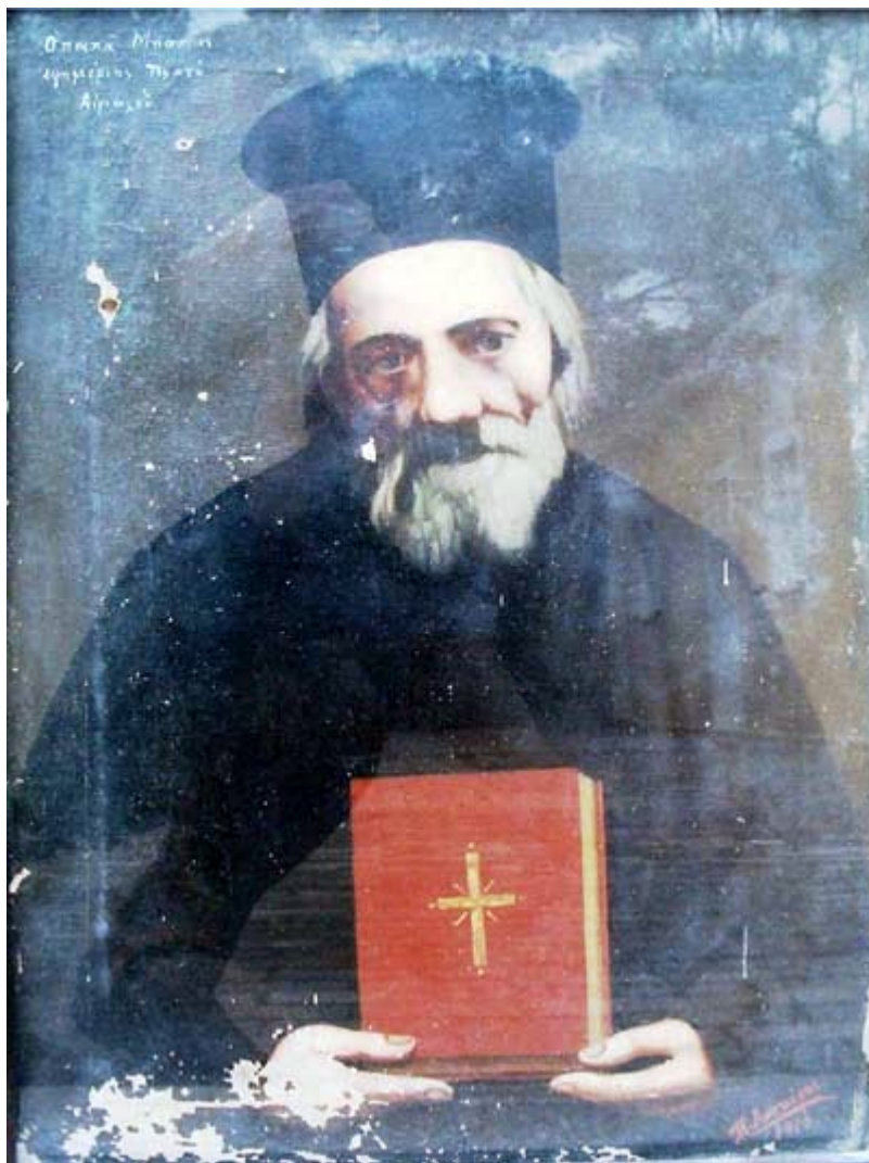
Όσιος Παναγής Μπασιάς (Παΐσιος)